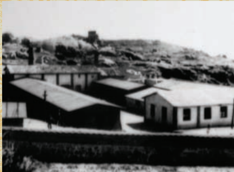
九龍江酒廠鳥瞰(今金門城)