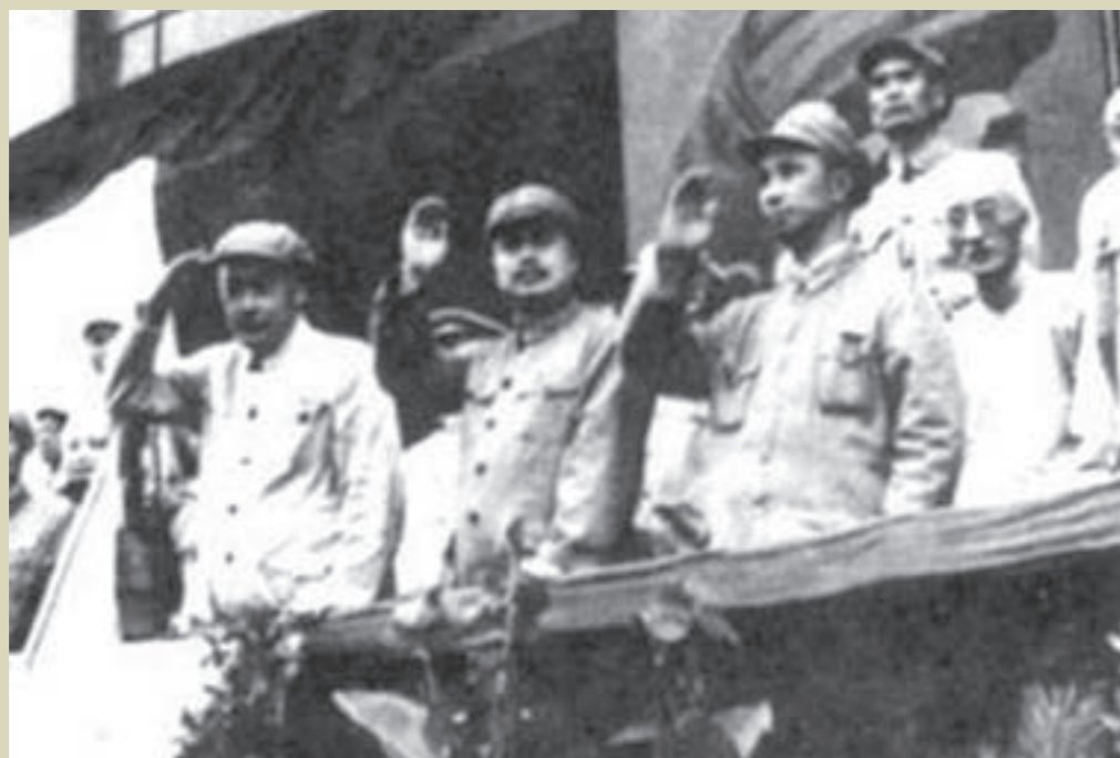
民國38年5月27日，上海解放大會上之中共華東野戰軍三巨頭。前排從左至右：陳毅、饒漱石、粟裕

共軍華東野戰軍陳毅部渡江後，氣燄萬丈，4月23日陷南京，5月3日進杭州，27日奪上海。在6月21日中共主席毛澤東給共軍華東野戰軍副司令員粟裕等人的電令中，已提及對臺灣的作戰指示：「……不佔領臺灣，則國民黨的海、空軍基地不能拔除……，我們希望能於夏、秋兩季完成各項準備，冬季佔領臺灣。」