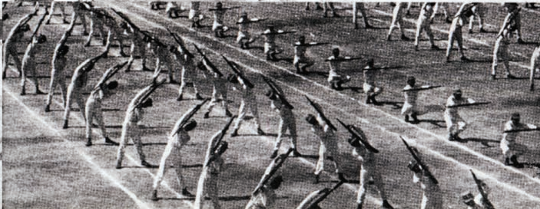
第201師在臺受訓過程。(左圖) 於灣子頭打野外、(右上) 於嘉義內角受騎兵訓練、 (右下) 持槍運動鍛鍊手勁