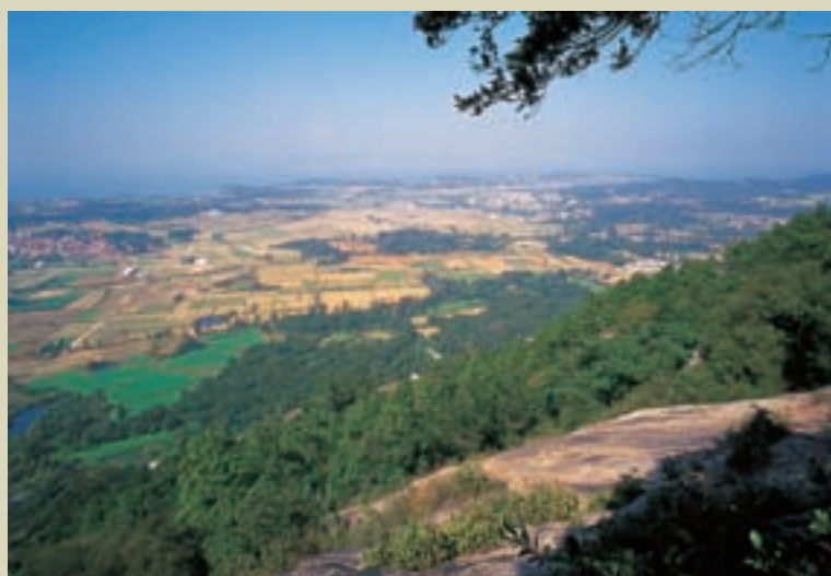
太武山遠眺

本島形狀兩頭大、中間小，形式如一啞鈴，中央狹窄為一腰部，將本島分為東金與西金；東西長18公里，南北最闊處約14.5公里(官澳-料羅)；最狹之腰部約3.5公里(瓊林-沙頭)。