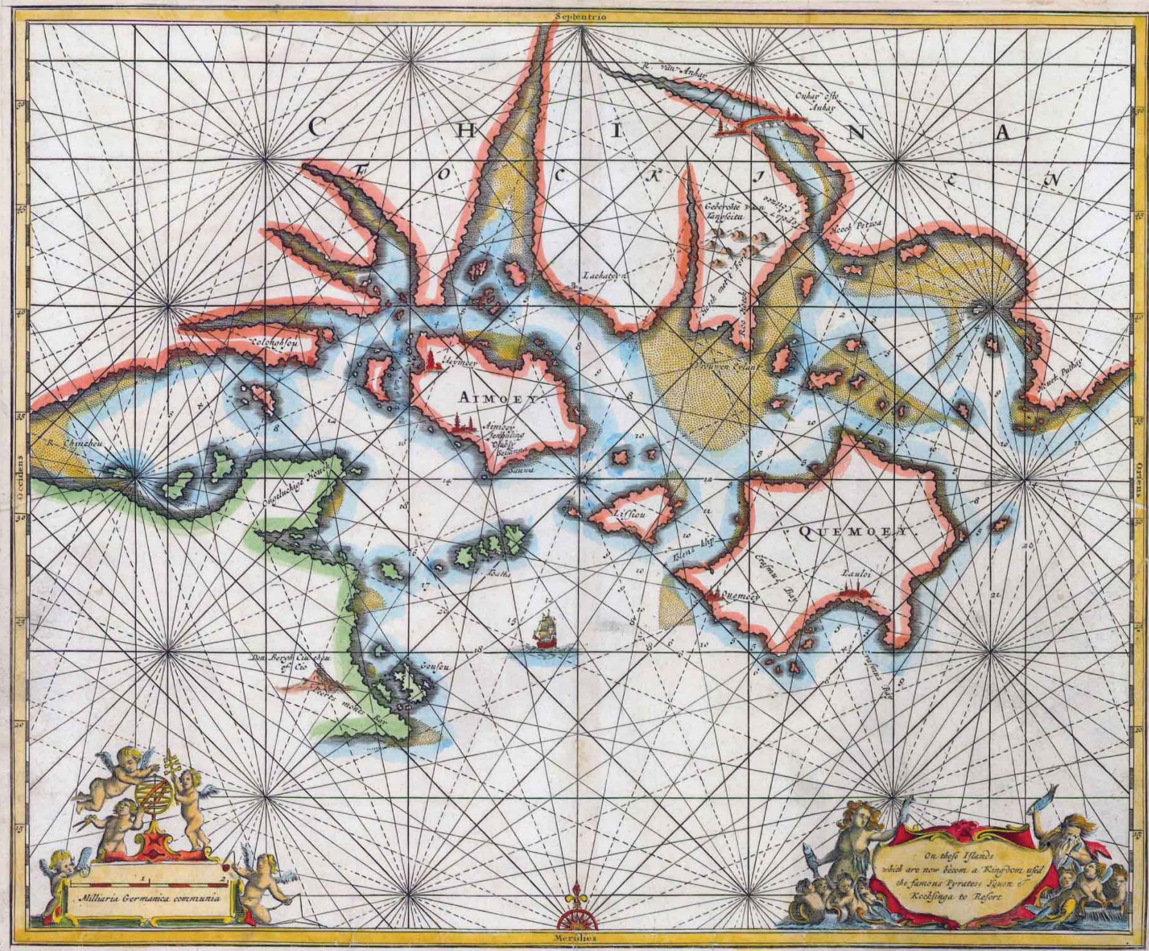
金門古地圖-1764年 法文版