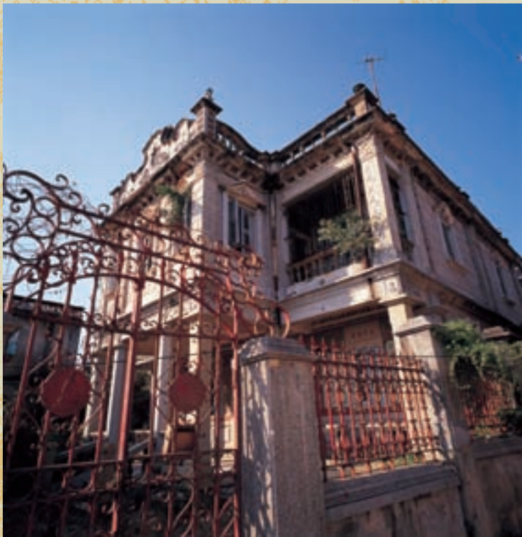
陳詩吟洋樓

東部沿岸多暗礁，秋冬季節風浪特大；瓊林經古寧頭迄水頭之海岸暗礁較少，惟古寧頭西北有斷崖300餘公尺，攀登困難；料羅灣雖較廣大平坦，然因面臨大洋，東北風起後滔天巨浪，無法靠船。全年潮汐以農曆九月初三及十月初一最大，滿潮停留12分鐘後即逐漸退潮。