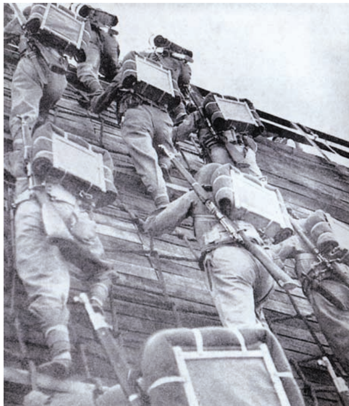
第201師改編為49師後，民國43年於左營受兩棲訓練

在此同時，分散各地的國軍重新集結，向西南及東南沿海撤退，採取重點防禦。東南軍政長官陳誠上將，為確保以臺灣為中心的東南各省，遂將各軍隊整編，並於臺灣擴建新軍。