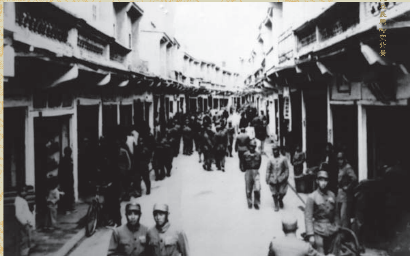
因駐軍而一片繁榮的金城莒光路舊景

汗，胼手胝足，把過去的荒涼砂礫，建設成堅固的堡壘；弟兄們一點一滴的辛勤灌溉下，把金門培植成蒼鬱蒼翠、碧波盪漾的綠洲。同時也因長期實施戰地政務體制，保存了一個相當完整而特殊的自然生態體系，為保護此等珍貴資產，於民國84年10月18日成立金門國家公園，成為我國第六座國家公園，亦是第一座以維護戰役史蹟、文化資產為主且兼具保育自然資源的國家公園。