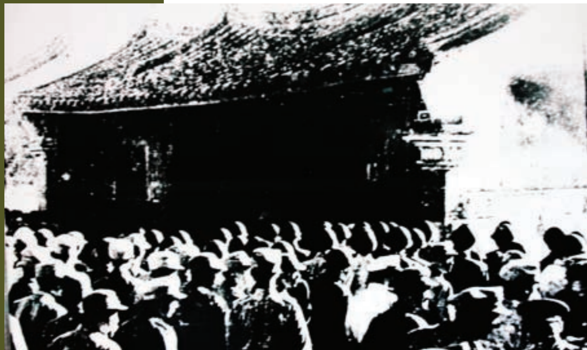
國軍參戰前於金門北山舉行效忠宣示大會

5. 我軍戰志堅強，有與金門共存亡的決心： 當共軍登陸時，在島上的部隊，上下一心，都抱定與金門共存亡的決心，幹部身先士卒，帶頭前進，軍、師長亦皆親臨前線，指揮督戰。