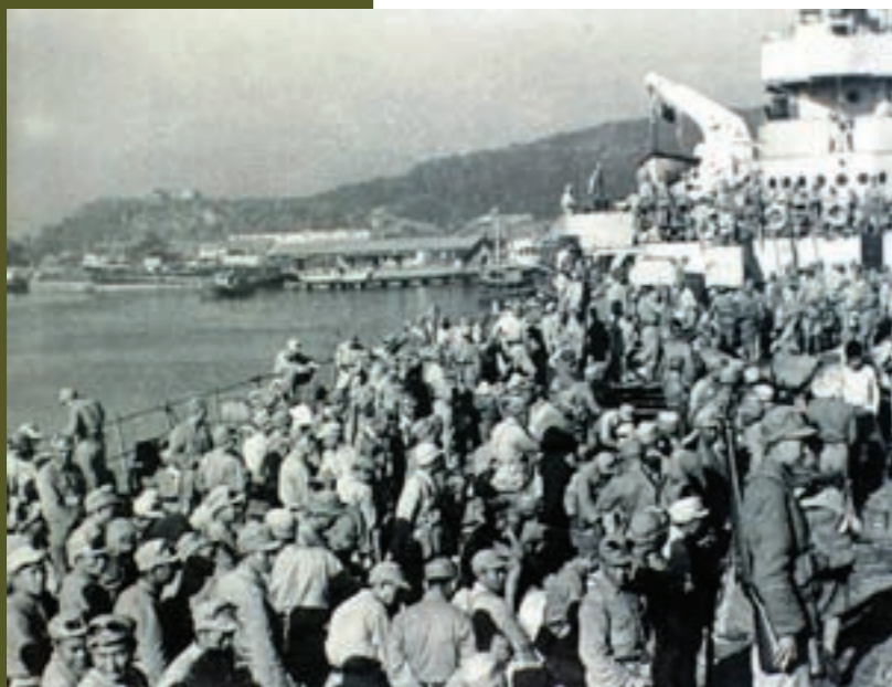
古寧頭戰役中立功的陸軍第80軍201師官兵凱旋返台整訓

5. 我軍戰志堅強，有與金門共存亡的決心： 當共軍登陸時，在島上的部隊，上下一心，都抱定與金門共存亡的決心，幹部身先士卒，帶頭前進，軍、師長亦皆親臨前線，指揮督戰。