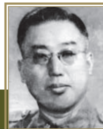
陸軍第25軍 少將軍長沈向奎