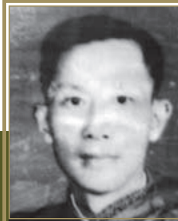
陸軍第14師 少將師長羅錫疇