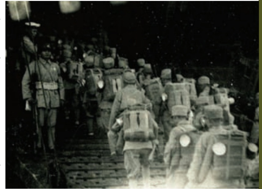
第18軍11師之少數十三、四歲的新兵正登艦中，真正成了名實相符的「小兵」