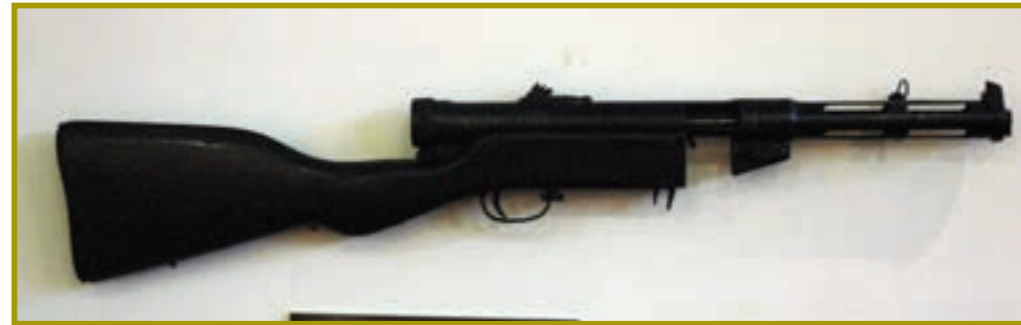
一九四二衝鋒槍(俄造)