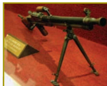
七九式輕機槍(捷造)