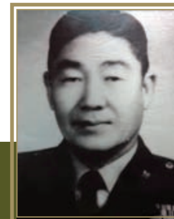
陸軍第18軍 少將軍長高魁元