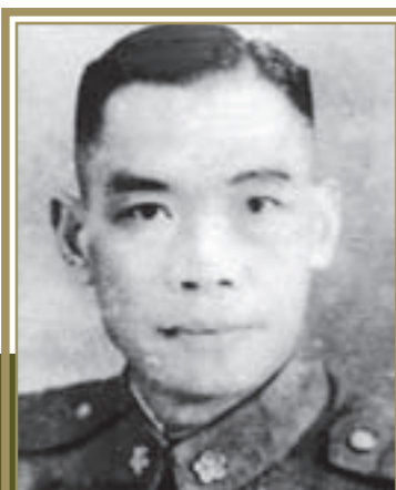
陸軍第45師 少將師長勞聲寰