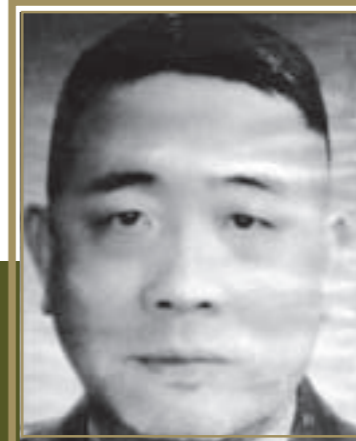
陸軍第18師 上校師長尹俊