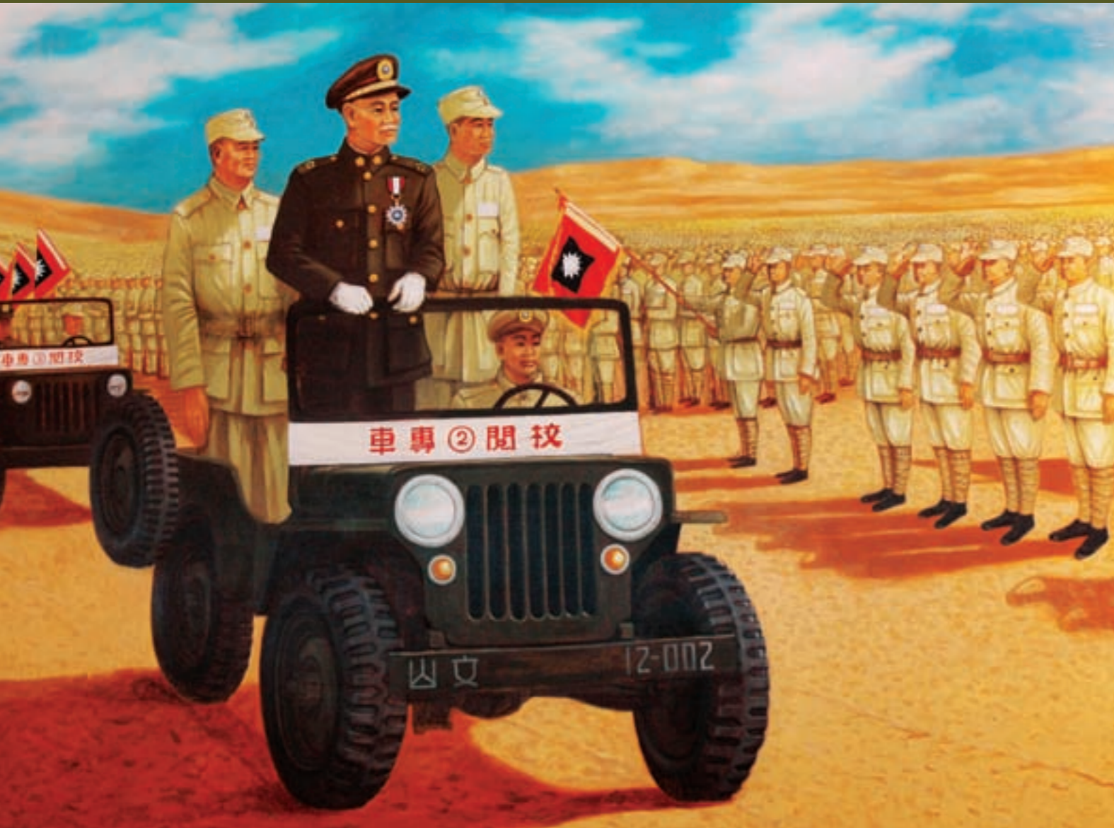
古寧頭戰史館油畫—先總統 蔣公於戰役後，在金門親校參戰部隊 (顧崇光畫)