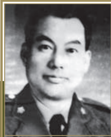
陸軍第201師 少將師長鄭果