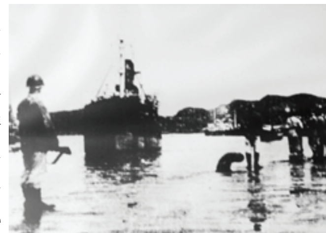
被俘共軍由我海軍運抵高雄碼頭