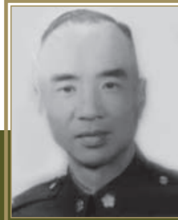
陸軍第43師 少將師長鮑步超