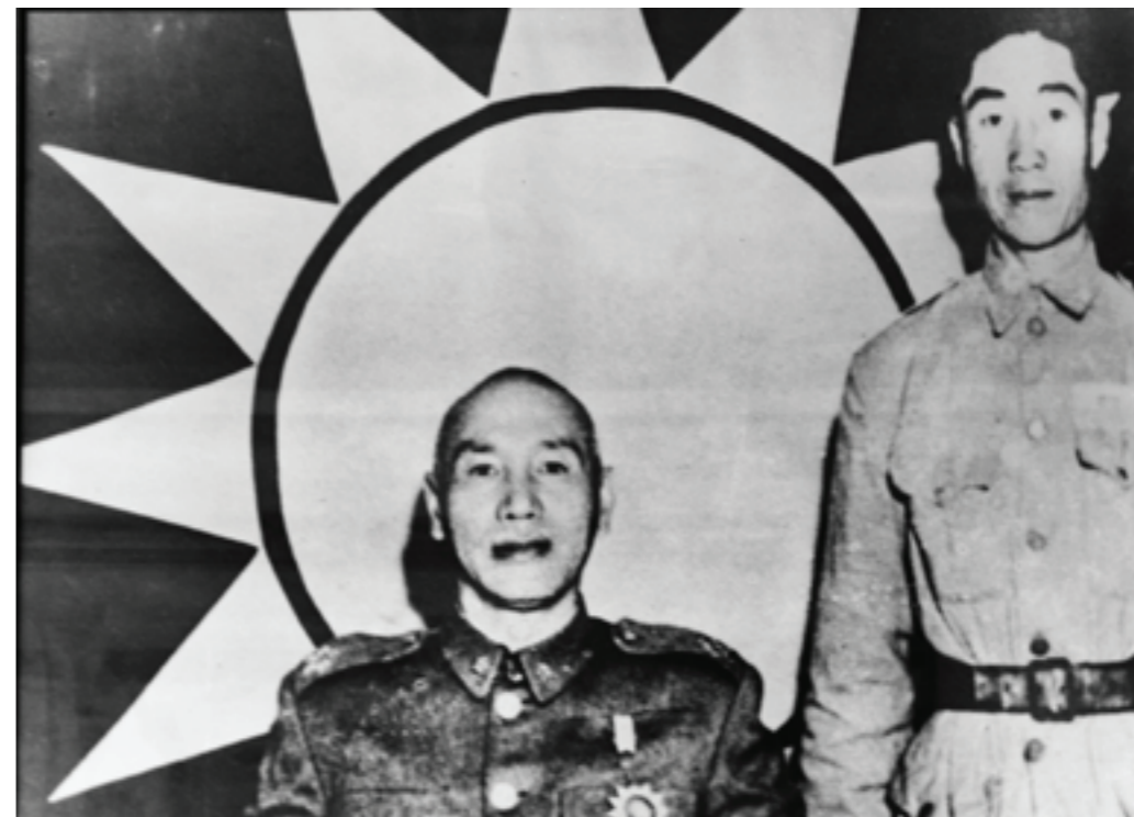
先總統 蔣公於戰役後召見第18軍軍長高魁元將軍

第22兵團司令李良榮將軍、第12兵團司令胡璉將軍及第18軍軍長高魁元將軍等高級指揮官判斷正確，對於防衛金門的計劃，及爾後的作戰指導均甚適切，指揮若定。故能收迅速殲共軍之功。