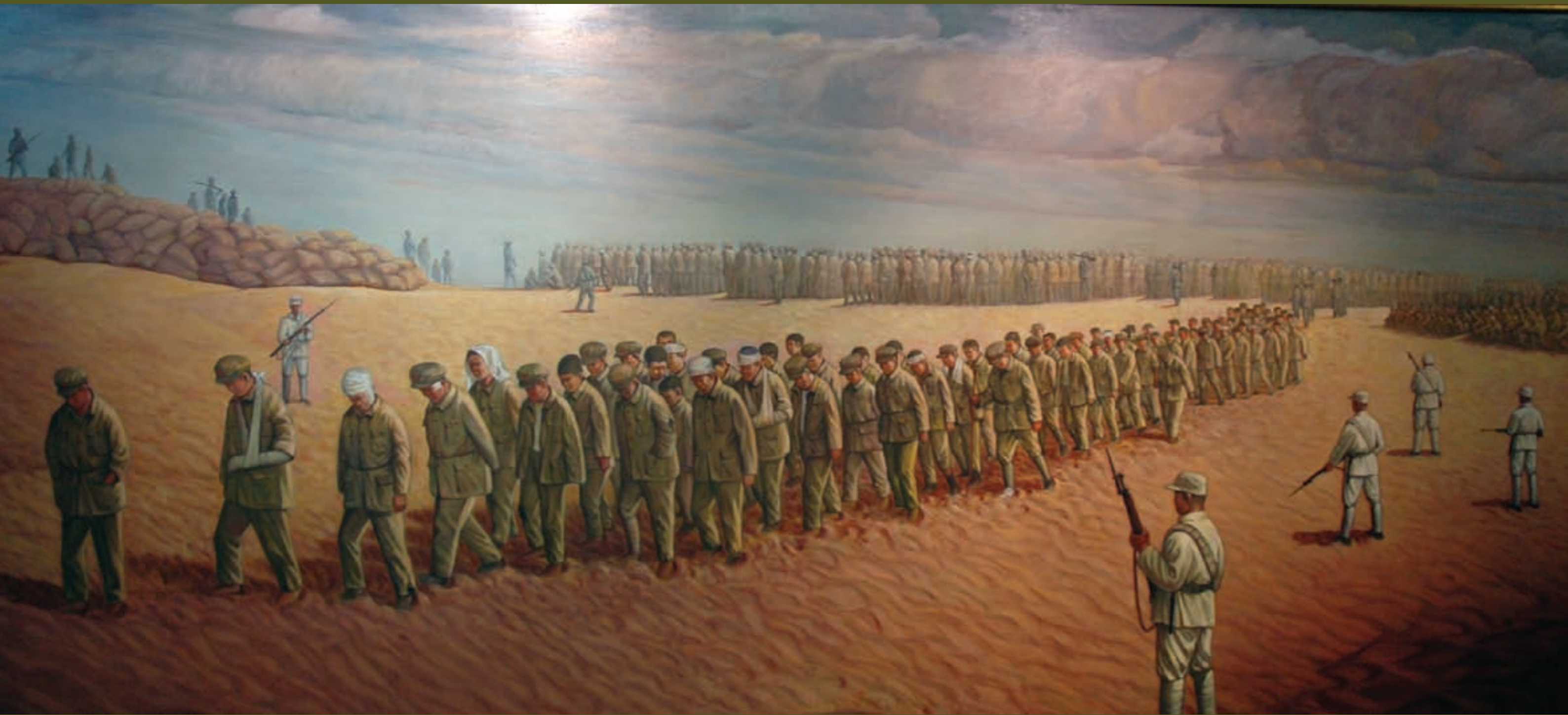
古寧頭戰史館油畫—被俘共軍搭乘軍艦遣送抵台