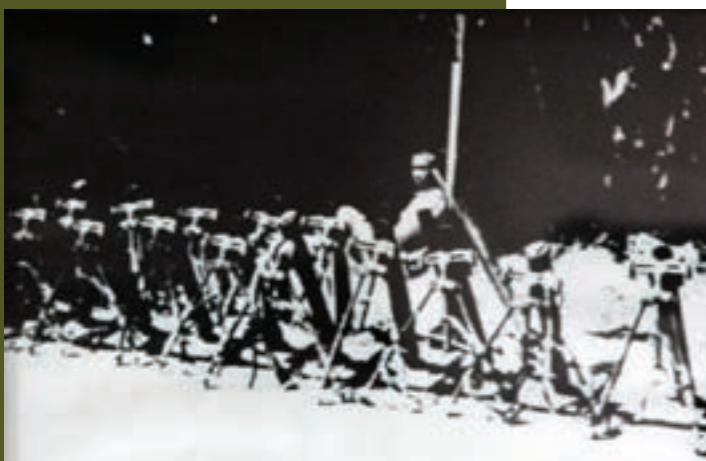
古寧頭戰役中，所擄獲之共軍各式輕重武器