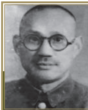
聯合勤務第一分區 中將司令繆啟賢

陸軍官校第1期畢業，經常秉公直言，素有「二通將軍」雅號。民國38年6月出任第22兵團中將司令，轄第5軍、第25軍駐廈門，於9月移防金門，為古寧頭戰役防衛作戰之戰場經營及前段作戰指揮官，時年42歲。