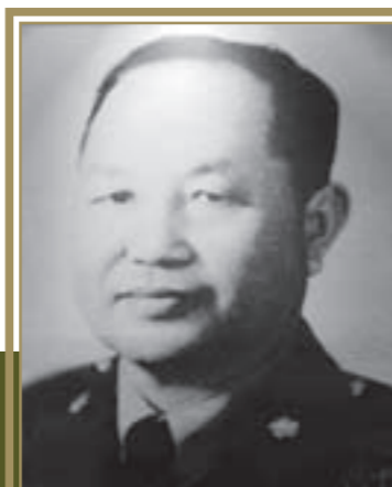
陸軍第40師 少將師長范麟