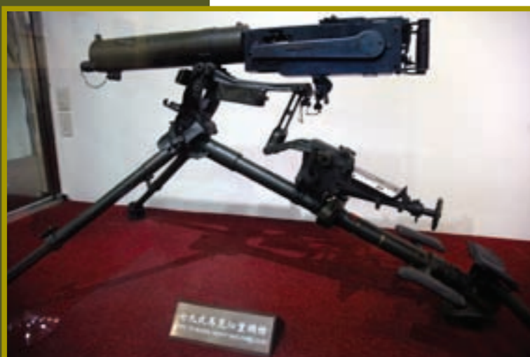
七九式 馬克沁重機槍