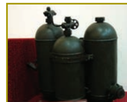
三六式火焰噴射器