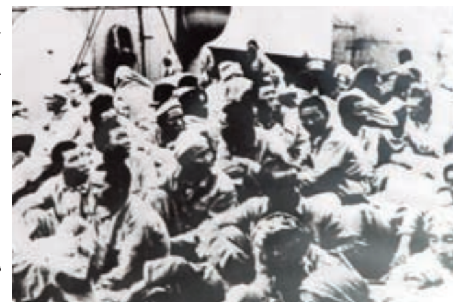
我海軍運輸艦，將古寧頭戰役中俘虜之共軍，由金門運往台灣途中

共軍登陸海灘選在古寧頭一帶，本是登陸金門最好的海灘，但也是國軍嚴陣以待的地區，因而失去了奇襲之效。共軍選定金門一年中的大潮日期及高潮時間：10月25日凌晨2時4分，為D日H時，然就實際作戰的經過來看，共軍登陸後，即須在已設防的敵人陣地前實行夜間戰鬥，致使共軍尚未恢復建制，與組成灘頭陣地之前，即遭我軍迅雷不及掩耳之反擊，使共軍不但不能立足，且在不到半天之內，即被殲滅過半。