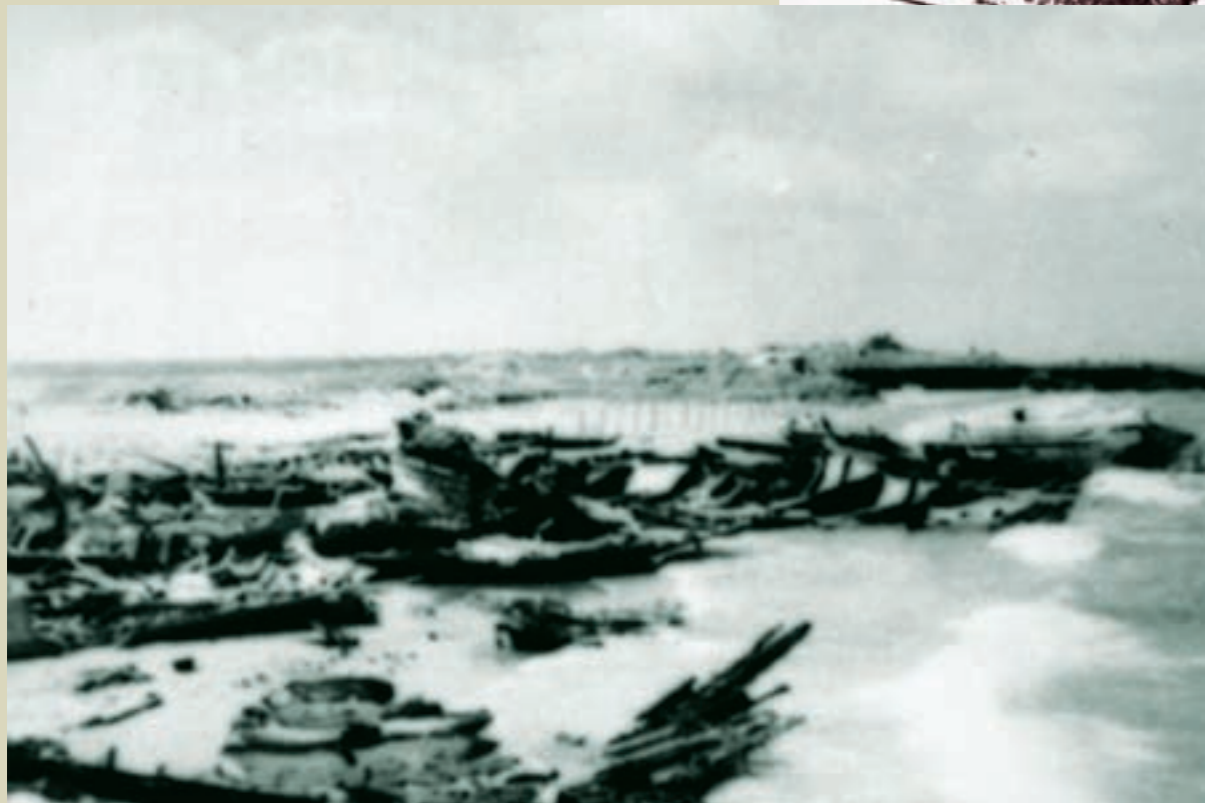
共軍木船二百餘艘滿載共軍乘高潮向金門搶灘後擱淺，全被國軍破壞