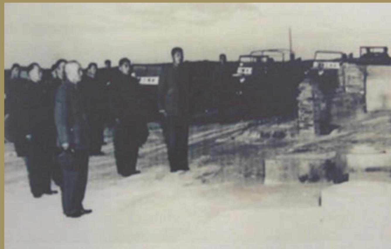
先總統 蔣公於金門太武山向古寧頭戰役陣亡將士致敬