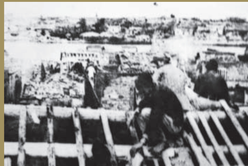
戰火後重新修整的民房

「歷史不能遺忘，經驗必須記取」，在兩岸謀求和平、解決歧見之際，爰將本戰役戰前的一般情勢、作戰經過，以及敵我兩軍戰略戰術上之得失關鍵所在，分別加以敘述，除紀念古寧頭戰役60週年，更傳達古寧頭大捷不變的時代意義與價值。