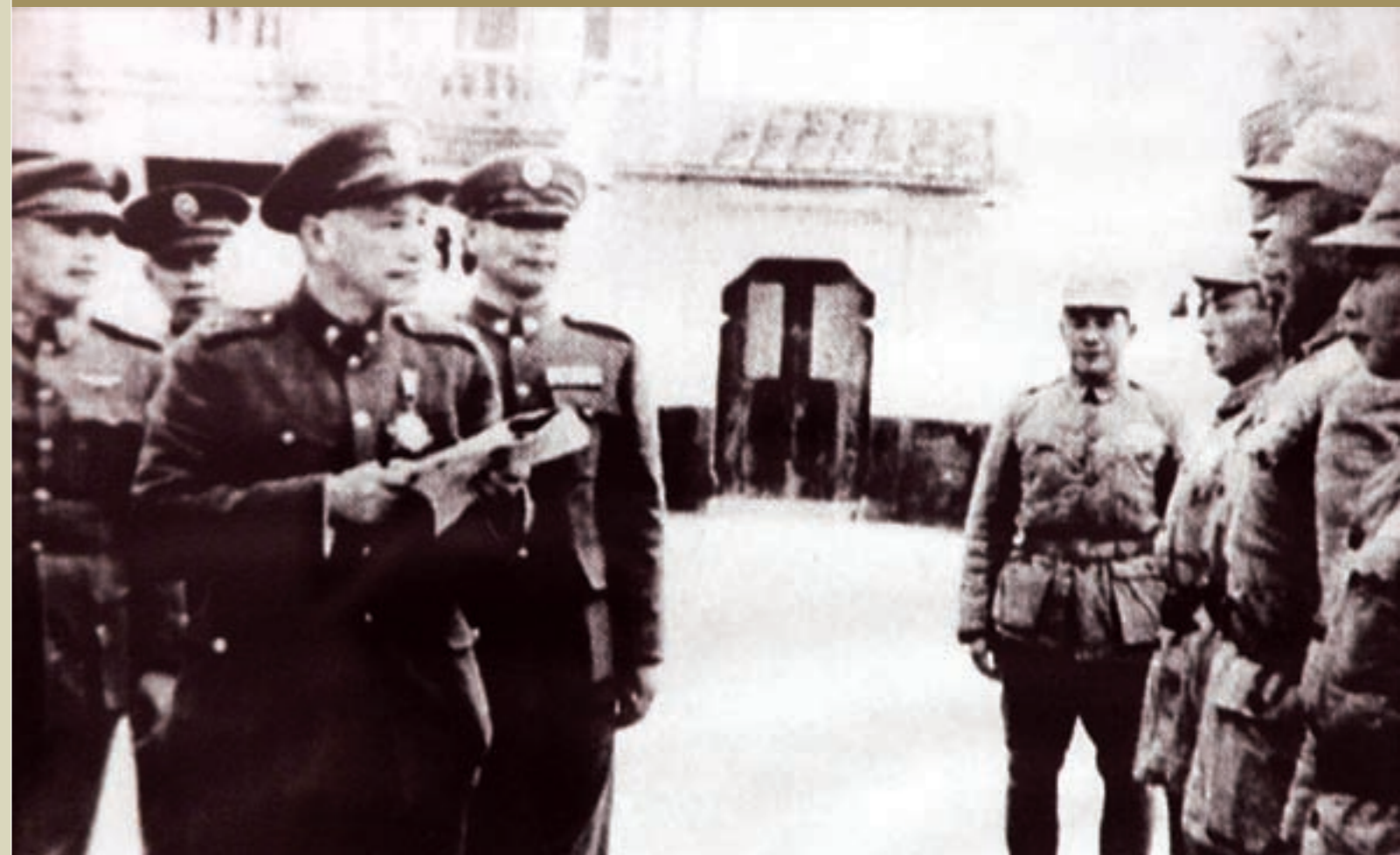
民國39年冬，先總統 蔣公首次巡視金門，點校古寧頭戰役有功官兵

中國之友前美國參議員諾蘭先生伉儷於是年11月19日來華訪問，曾蒞金門憑弔古寧頭戰場。離臺之時，曾對當時的東南軍政長官兼臺灣省主席陳誠上將說：「金門之戰