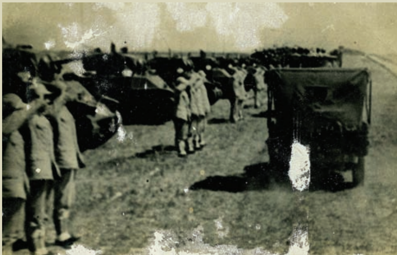
第12兵團司令胡璉將軍巡視金門之態

「歷史不能遺忘，經驗必須記取」，在兩岸謀求和平、解決歧見之際，爰將本戰役戰前的一般情勢、作戰經過，以及敵我兩軍戰略戰術上之得失關鍵所在，分別加以敘述，除紀念古寧頭戰役60週年，更傳達古寧頭大捷不變的時代意義與價值。