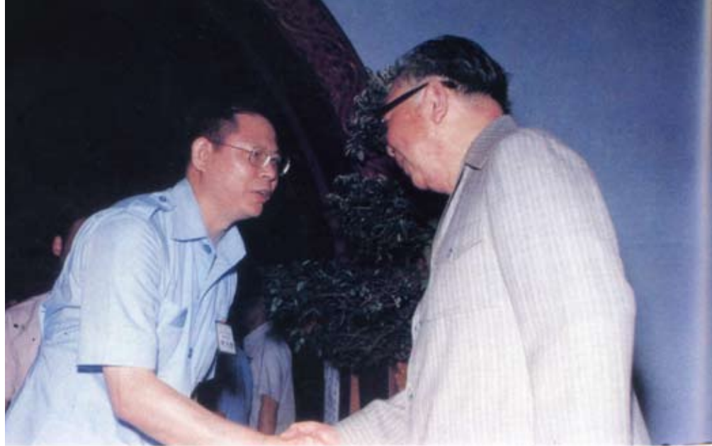
▲參加國建會與蔣經國總統合照。

魏兆歆學成歸國後，立刻學以致用，開始了他擔任教職的工作。但到了民國七十年，魏兆歆接掌國立高雄海事專科學校，這