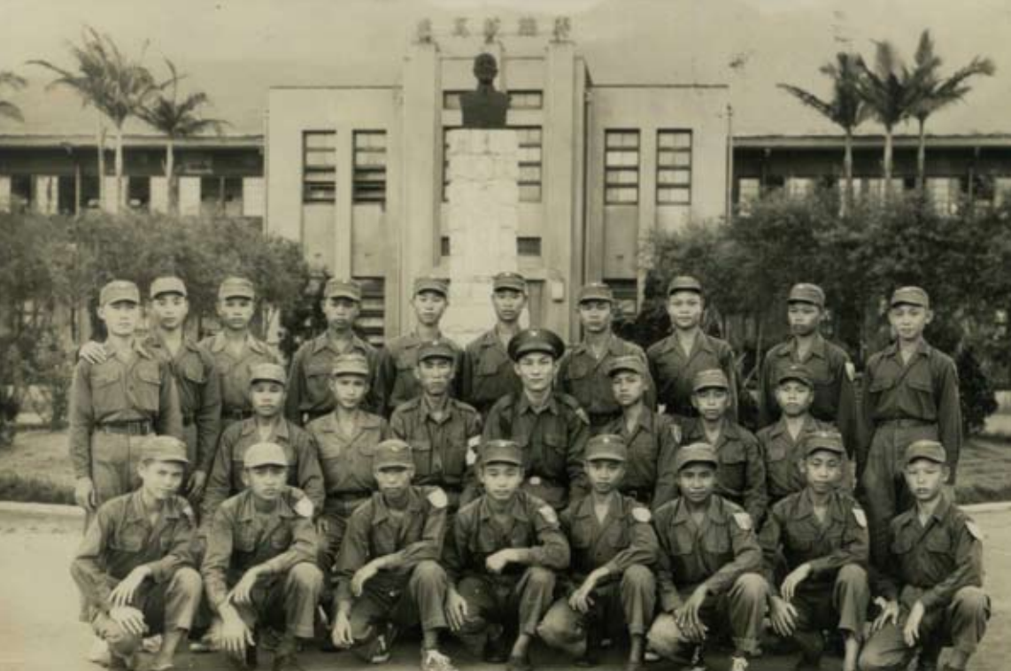
▲政工幹校行政大樓前團體照。

滋味，我沒坐過大船，沒看過真正的大海，從上船，一路碧海青天，時時刻刻都充滿新奇。現在想起來，大人們深沉的眼眸，只有我長大才能體會，其實，部隊要撤遷到臺灣島，是不是能再回到自己出生成長的地方，沒有人有把握。」也因為實在是個娃娃兵，在船上一直聽人說臺灣是個四季如春的寶島，所以當時腦子裡只想到要吃香蕉。以致當船隻抵達基隆港後，「那天晚上就跟著幾個士兵叔叔出去山裡找香蕉吃。」