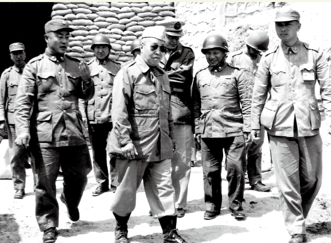
▲民國四十八年，國防部長俞大維再訪金門，由張國英將軍陪侍，於南坑道口所攝。其後戴大盤帽者為何士禮將軍。右一為時任作戰聯絡官的傅克毅少校。

總龔處長避於南靖一坑道中，不幸遭擊，多處負傷，雖經八六六醫院急救，仍延至八月二十四日十三時五十分左右逝世。空軍副司令官章傑，於砲擊中擬至火力協調中心坑道，跑至小橋遭砲擊直接命中，遺骸墜於蓮花池中，死狀甚慘。