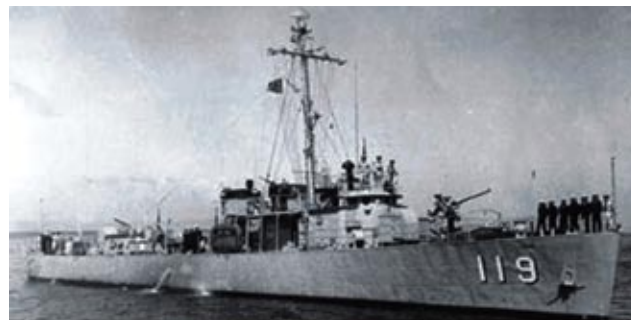
▲劉金標服役的「東江艦」。

「東江艦」於砲戰期間主要執行巡邏及護航，劉金標回憶道，二十五日夜間十一時許，當時任國防安全會議副祕書長蔣經國無預警到「東江艦」上，而劉金標剛好又是值更官，此時艦長下令將「東江艦」開往金門，官兵受命後立即整備啓航，由於正值戰時，「東江艦」為了保護國防安全會議副祕書長蔣經國及隨行船艦的安全，特別在艦艏拖了一具干擾雷達，此具雷達裝置在一艘木製小艇上，由「東江艦」以拖行方式在船後，航行期間不斷發出雷達波，讓中共無法得知「東江艦」及船團的行蹤。