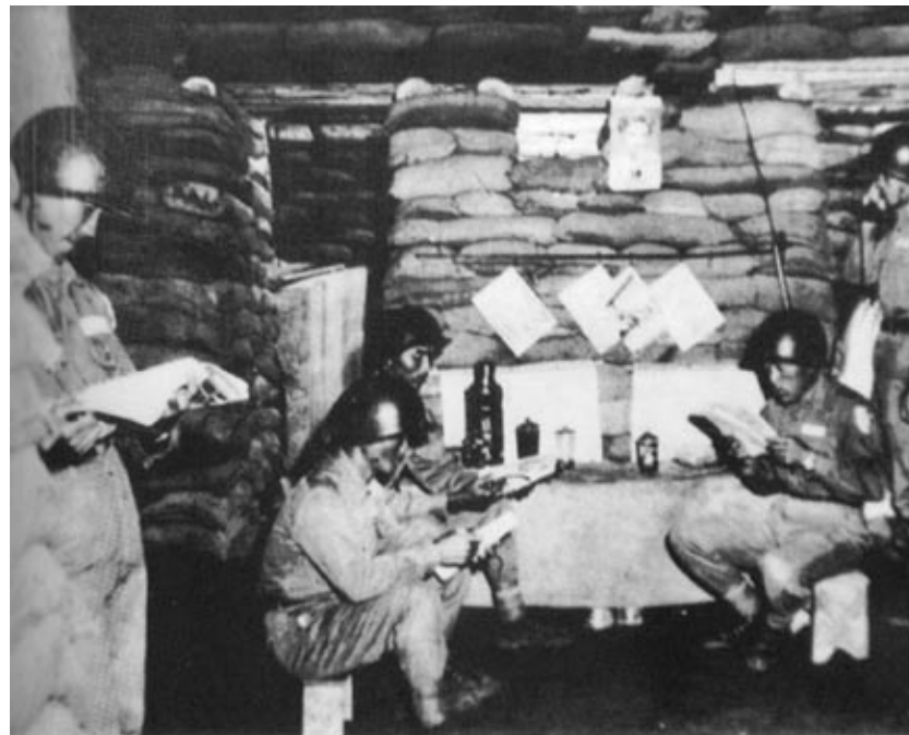
▲ 砲火轟炸下的官兵於掩體內日常生活，處劇變而不驚，乃軍人本色也。

當接近金門陸地時，乘載增援砲兵部隊的美國軍艦，在共軍的火砲射程外停泊。待夜幕低垂，增援部隊搭乘LVT水陸兩用登陸戰車，準備從料羅灣登陸。