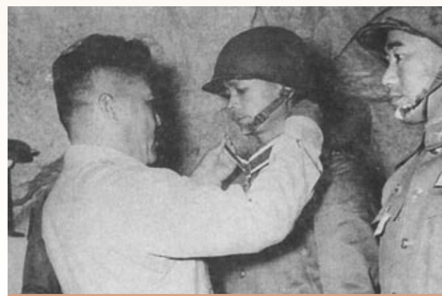
▲王叔銘參謀總長為砲戰中建戰功之官兵授勳。