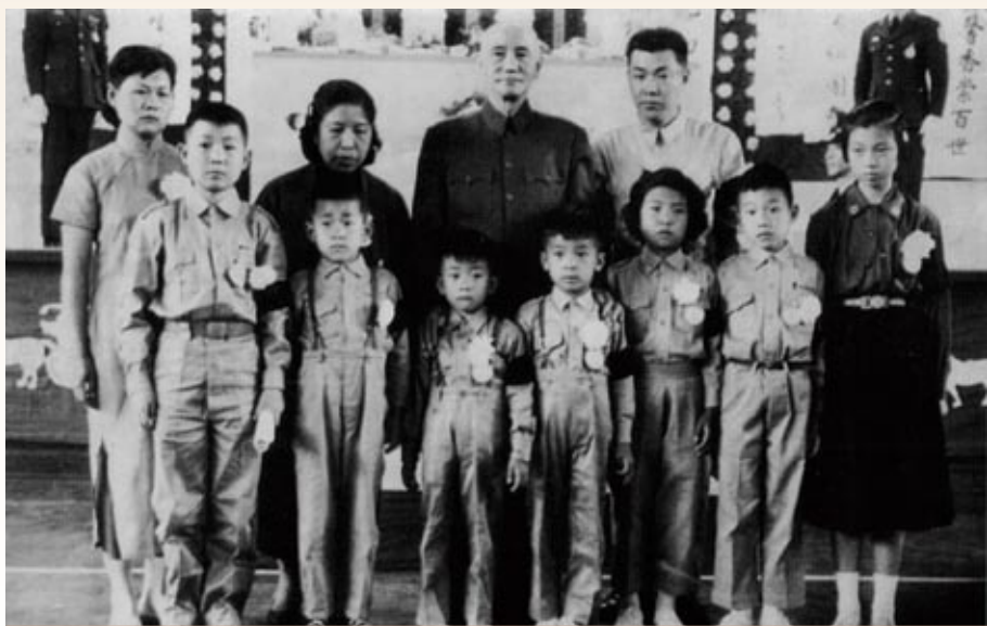
▲蔣中正總統慰問民族英雄吉星文將軍的家屬，蔣中正總統左側的是吉星文夫人沈嘉斌女士，前排左三為最小兒子吉民立。