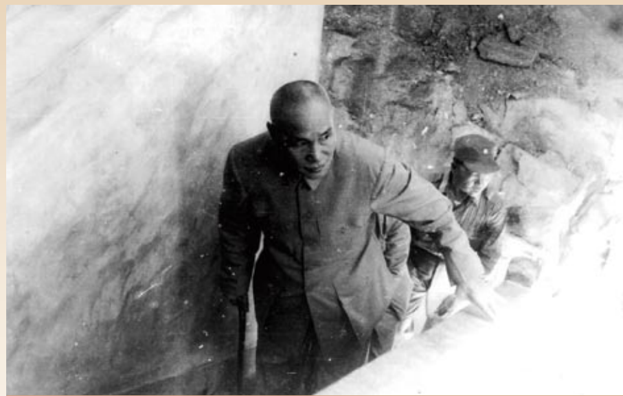
▲蔣中正總統視導途中，於坑道內。