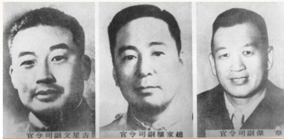
▲八二三當日遭共軍火砲急襲殉國的三位副司令官。