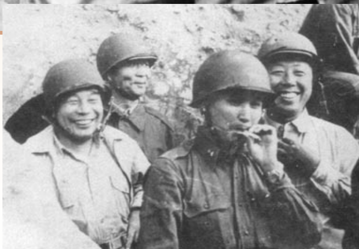
▲ 蔣經國副秘書長於民國四十七年中秋節，於金門所攝，其左後為胡璉金防部司令官。