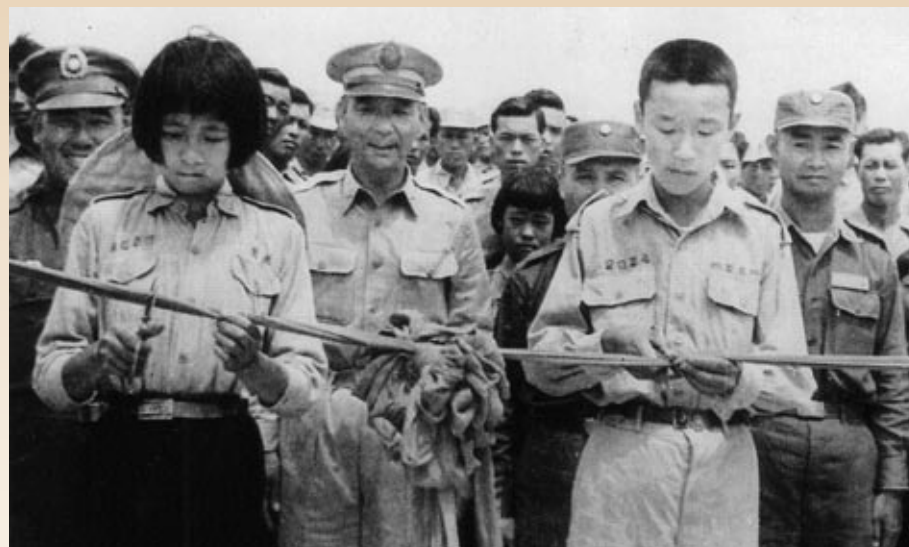
▲金門實施戰地政務，由軍方撥款興建之柏村國校，完工後舉行落成典禮，金防部司令官胡璉將軍親臨主持。上圖為小學生代表剪綵，後面站著四位將軍，分別是胡璉（左二）、柯遠芬（右二）、馬安瀾（右一）、郝柏村（左一）。