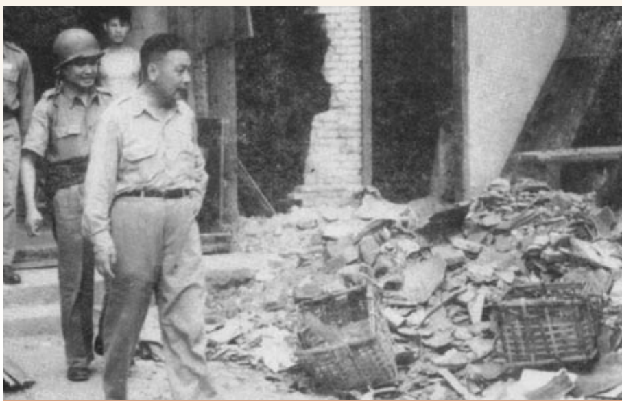
▲國防安全會議蔣經國副秘書長，不顧個人安危，多次於砲戰中前往金門慰問視導。