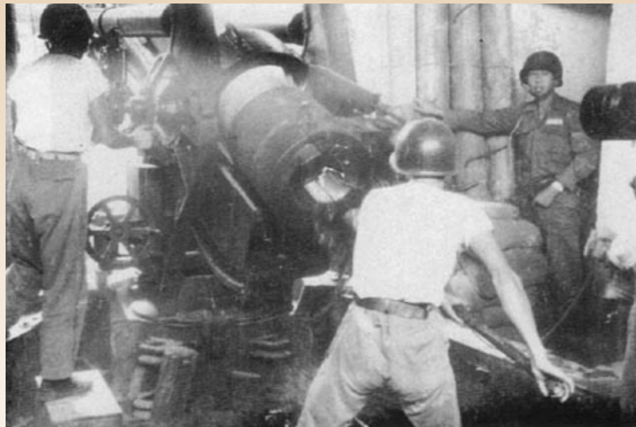
▲ 金門砲兵實施反砲戰，重創共軍砲陣地，圖是砲兵操作一五五榴彈砲。