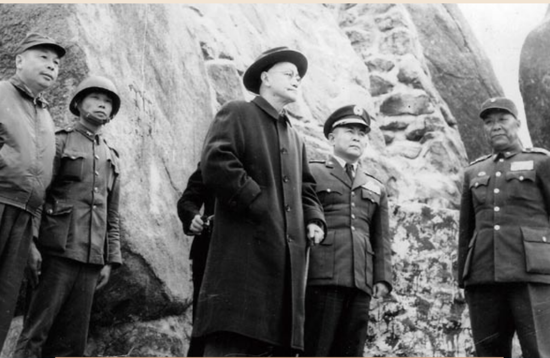
▲自民國四十七年十月二十二日中共宣布「單打雙不打」後，蔣中正總統於民國四十八年一月二十日首度蒞臨金門視導，左起：蔣經國副秘書長、蔣中正總統、陳嘉尚空軍總司令、劉安祺金防部司令官。