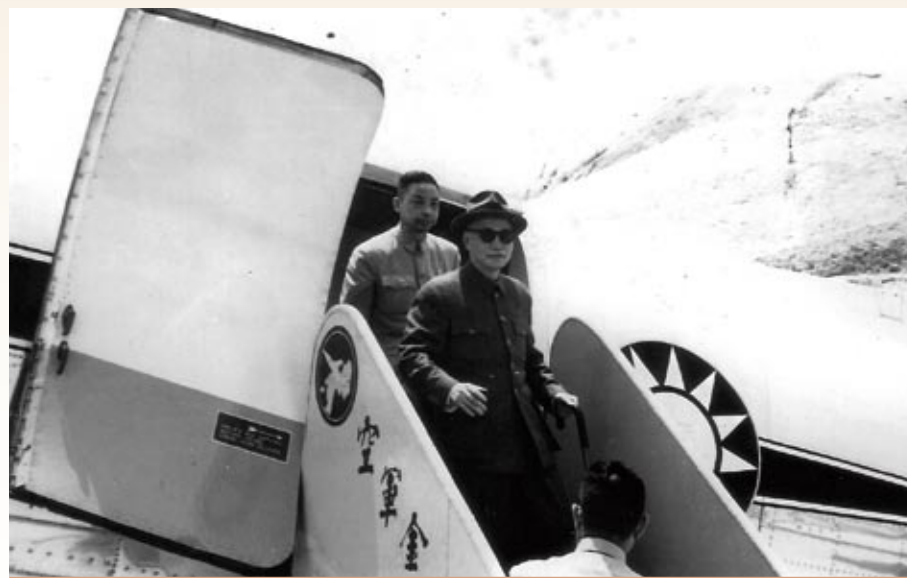
▲總統座機美齡號抵達金門料羅機場，蔣中正總統下機時所攝。