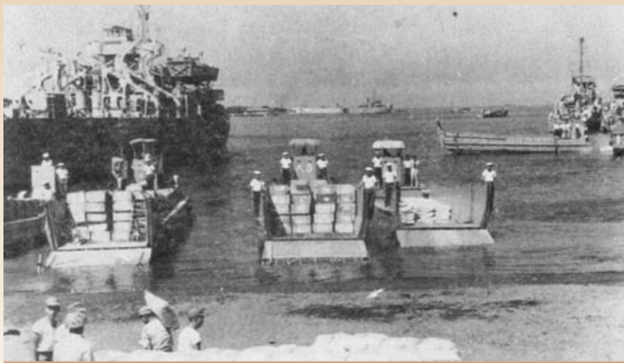
▲金門砲戰，中共妄想以砲擊與魚雷快艇封鎖金門，但為我海軍「閃電計畫」所打破，圖為海軍LST戰車登陸艦與LCM登陸艇於料羅灣搶灘，下卸運補。