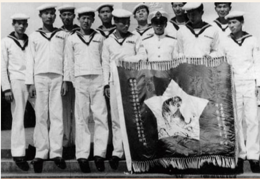
▲九二海戰「沱江艦」以單艦英勇迎戰優勢共軍艇隊，創下輝煌戰功，獲頒榮譽虎旗，圖示官兵在接受虎旗的儀式後，驕傲地展示。