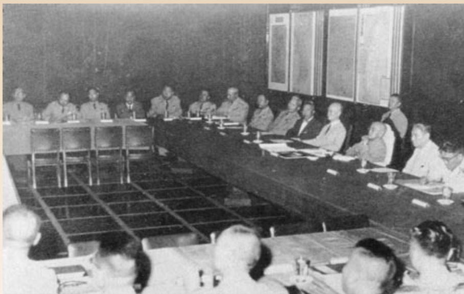
▲臺北由蔣中正總統親自主持的臺海防衛聯席會議，可以見到蔣中正總統、陳誠副總統、俞大維國防部長、張群等重要高層。