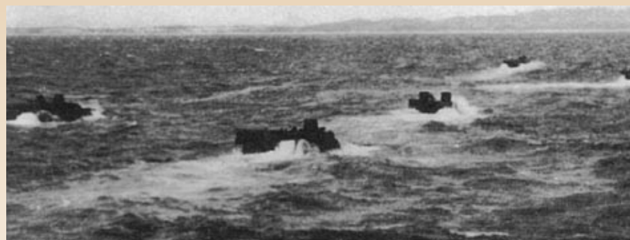
▲海軍「鴻運計畫」，以LVT兩棲登陸戰車行突擊搶灘運補，成效卓著。