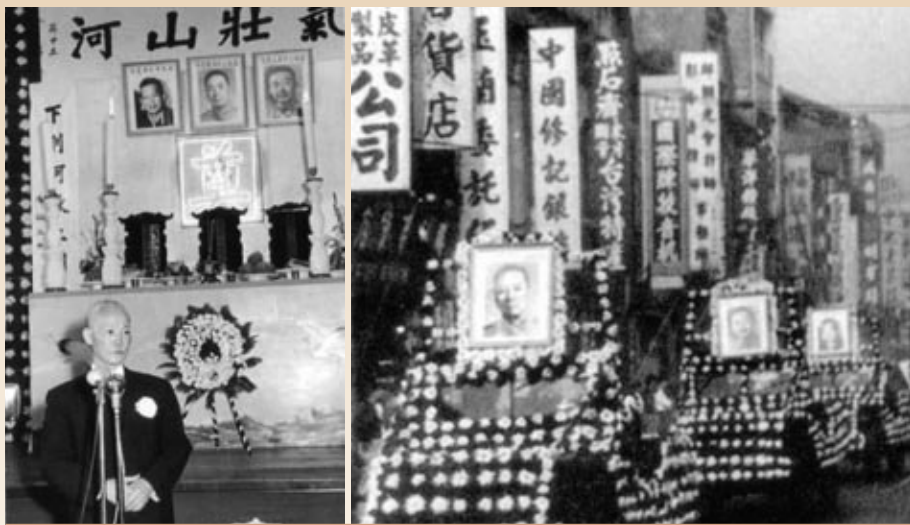
▲左：金門三位副司令官追悼大會，於臺北舉行，陳誠副總統親自主持。 右：三位副司令的靈車於臺北市街遊行，接受民衆哀悼。