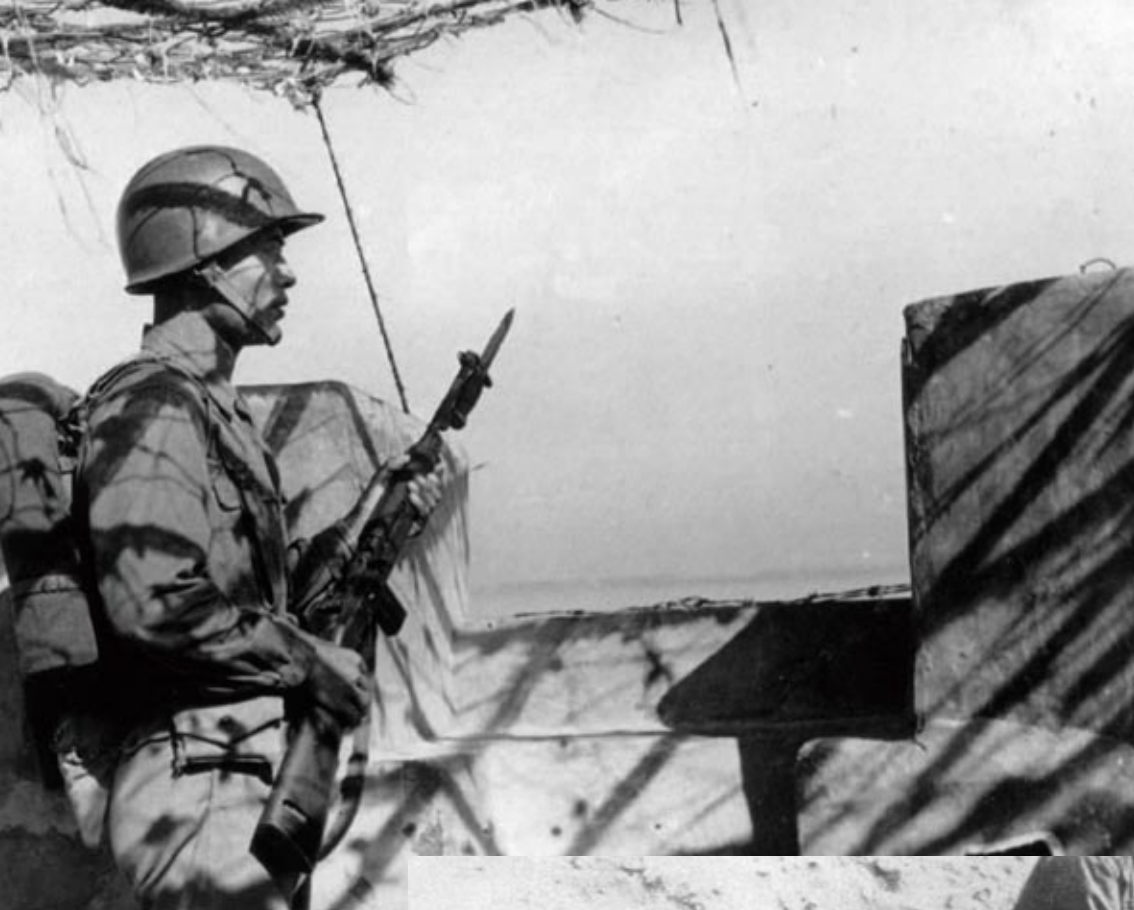
▲ 戍守金門的國軍戰士。