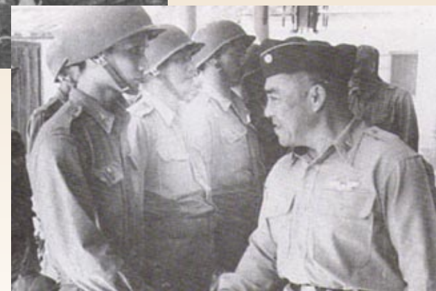
▲王叔銘參謀總長慰問八二三參戰官兵辛勞。