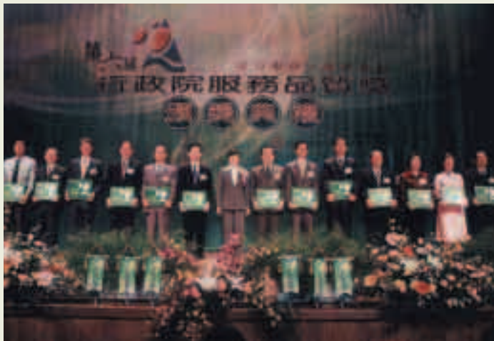
民國94年6月18日至臺北市中油大樓接受行政院副院長葉菊蘭女士頒獎實況

民國93年本院參加第6屆行政院「服務品質獎整體服務績效類評選」，經行政院研究發展考核委員會以會研字第0931883013號發佈本院榮獲第6屆行政院服務品質獎之「整體服務獎」。並由院長代表接受獎牌乙面、獎金15萬元整。