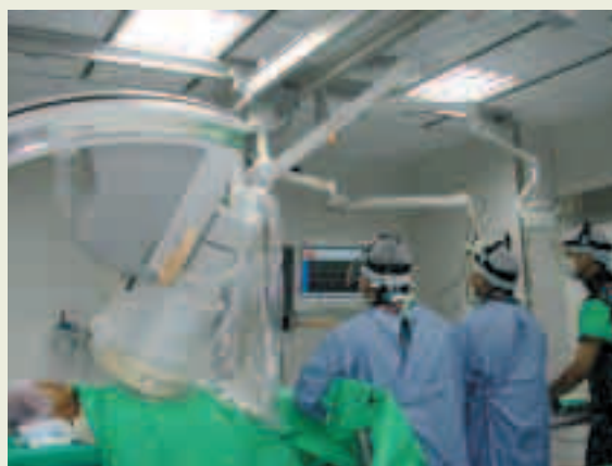
心導管臨床醫療作業情形

最新的心導管設備，提供精密正確的治療。本院心導管室於民國91年8月5日成立，以ROT（整建、營運、轉移）外包方式辦理，共節省公帑約五千萬餘元。醫療團隊採24小時待命救援，為12所榮院之首創，至94年11月施作案例已超過一千餘例。