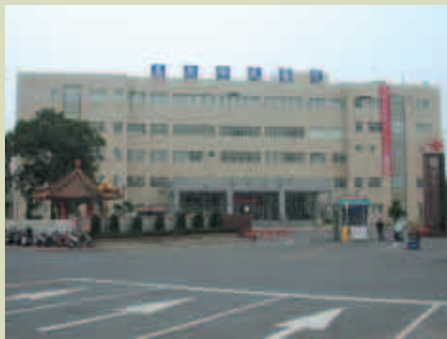
民國92年底完成之醫療綜合大樓 (93年元月以世賢路二段600號做為正門出入口)

A棟大樓面臨世賢路二段，視野廣闊，氣派雄偉，為五樓建築物。一樓大廳配置藥局、檢驗科、放射科及急診室，二樓為門診部，三樓為行政中心，五樓為現代化之開刀房，六樓為內外科加護病房。本大樓前方為醫院正門是車輛、人員主要進出口並設置車輛收費亭及柵欄取票機管理。