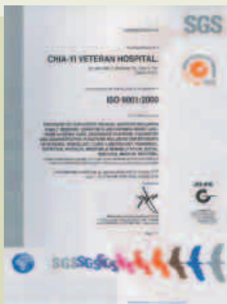
92年1月榮獲「老人照護ISO-9001」認證證書