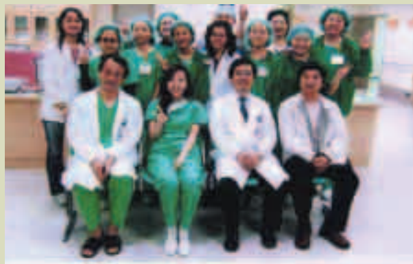
外科醫療團隊成員攝於新開刀房啓用日

新開刀房之使用空間加大，採無塵地板，所有氣體供應均為中央控制。也設置家屬等待區，以符合「以民為主，以客為尊」的現代服務要求。