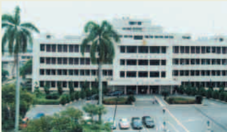
民國79年完成E棟大樓

本院成立於民國41年元旦，原為陸海空軍肺病療養院，44年改為陸軍第1肺病療養院，73年經行政院衛生署納入「全國醫療網計畫」，以原有院區更新改建，為榮民（眷）及地方民眾提供現代化之醫療環境。