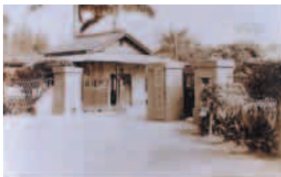
本院前身為陸軍慢性病醫院民國48年7月改隸輔導會

本院原E棟大樓3樓加護病房，於93年10月搬遷至新建急診綜合大樓6樓，並擴增為24床，94年1月18日亦將開刀房搬遷至新建急診綜合大樓5樓。