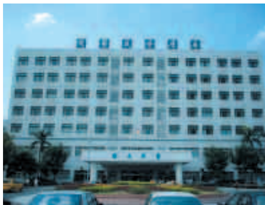
永康榮民醫院醫療大樓門診現貌

目前醫院整體發展目標均朝改善醫院環境，成為一個溫馨、精緻、優質之社區醫院，推動秉持「以客為尊、視病猶親」顧客為導向的經營理念，建立有系統有組織的專業形象，本院除執行政府全民健保政策外同時支援臺南、岡山、佳里等榮家及社區醫療服務，由於醫療設備逐次更新，人員不斷補充，榮民總醫院技術支援，已具有現代化醫院水準，正積極羅致專業人才，不斷擴增各項醫療設施，以配合國家政策及提升醫療服務品質，以嘉惠地區榮民與民眾。