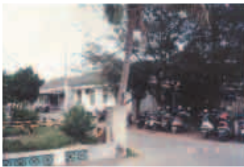
永康榮民醫院舊門診全貌

本院原址為臺南縣永康鄉網寮段四分子復興村427號，臺南縣市交界處地理位置適中，全院總面積5.6公頃，交通便利。本院於民國46年7月1日奉令成立「臺灣永康榮民醫院」之前為榮民榮譽之家，初期係由臺灣省衛生處代管，設有「醫務」、「輔導」、「總務」3個組及會計人事管理，總員額53人，48年5月1日奉命為輔導會南部重點治療醫院，52年4月1日機關名稱，改稱為「行政院國軍退除役官兵就業