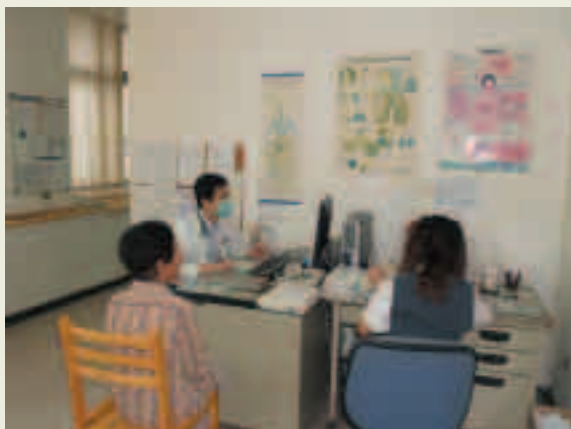
永康榮民醫院門診間醫師