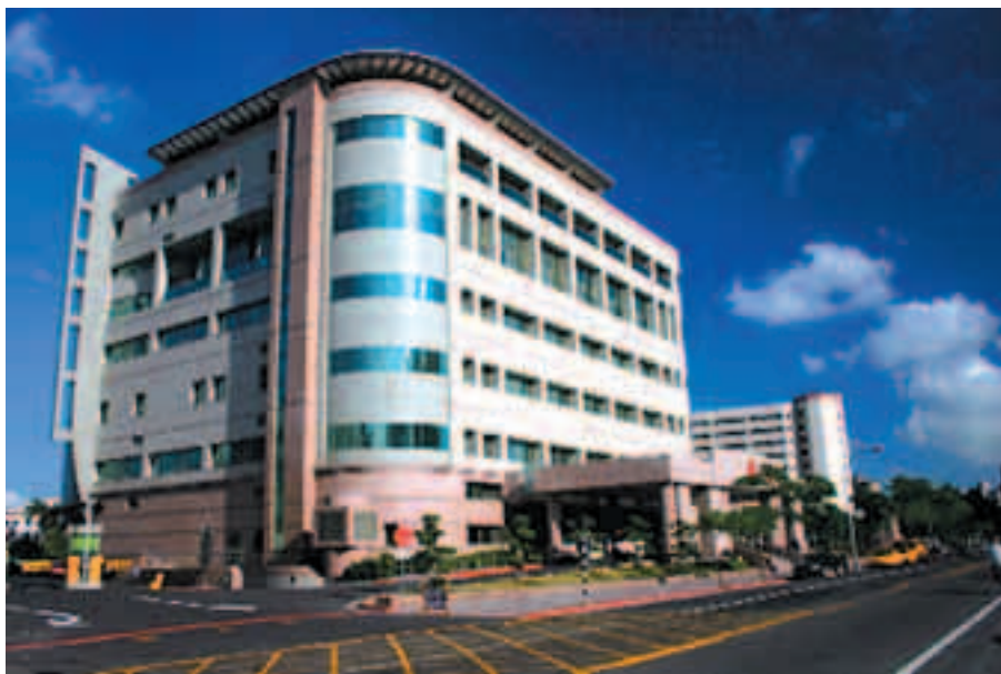
高雄榮總急診大樓

69年監察院內政小組，鑑於當時榮民總醫院正在興建臺中分院，造福中部榮民、榮眷及一般民眾，為加強南部地區民眾醫療照顧、促進醫學發展及提升醫學水準，乃建議將楠梓榮民醫院改建為更現代化榮總高雄分院，此為籌設榮總高雄