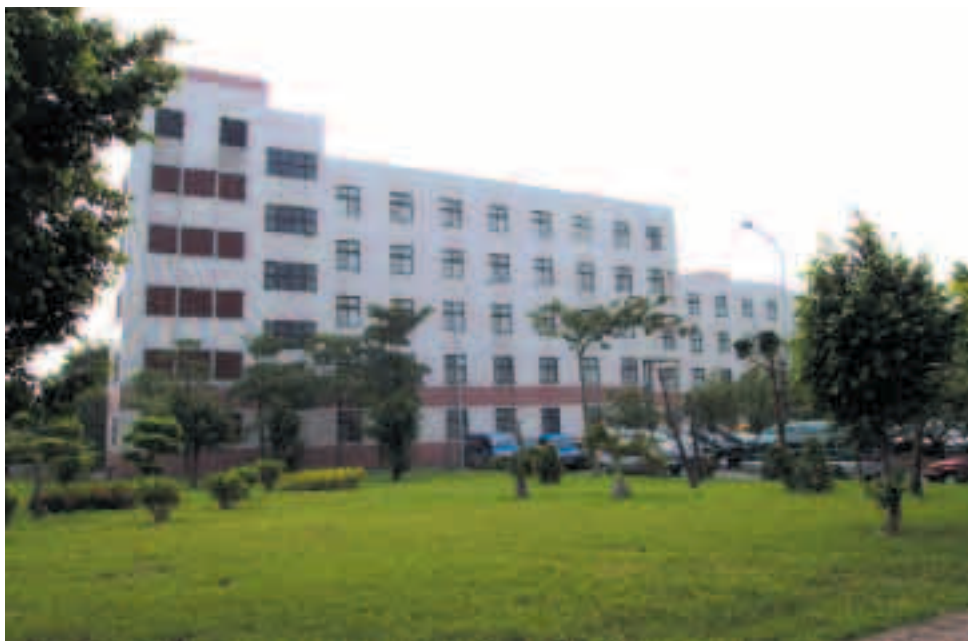
高雄榮總醫學研究大樓及臨床訓練中心

85年7月完成南臺灣首例以心導管放置螺旋線圈封閉存開性動脈導管病例。86年1月完成全國首例紅斑性狼瘡肺高壓症肺臟移植手術。86年4月2日舉行首例骨髓移植成功。86年6月