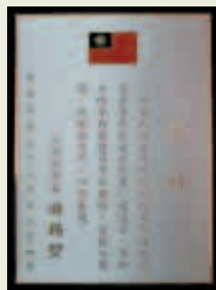
參與暨建議考核獎勵入選獎

加護中心連續於85、86、87年獲衛生署ICU評鑑為最優等。更於92年參加行政院參與暨建議考核獎勵，榮獲入選獎。