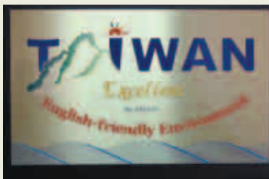
英語生活環境特優單位標章

在內、外部標示方面，高雄榮總已全面雙語化，醫院簡介亦採取中英雙語編印，要求各單位網頁全面區分中、英文網頁。同時為提高員工學習興趣，舉辦英語漫畫比賽、編印櫃臺英語會話手冊、辦理全民英檢輔導訓練班。