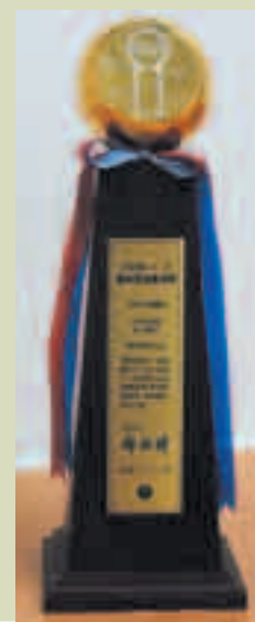
民國81年榮獲行政院頒發之獎座

在不斷創新下，本院全面採用電腦電話整合配線系統，以方便網路之管理；全面設計條碼之應用，簡化應用作業之設計和維護；運用電腦實施衛材交換車自動補給，方便護理人員提高醫護品質；整合個人電腦網路應用作業分擔電腦主機之工作；整合資材、藥品、薪資和收費報帳作業自動歸併於會計系統。另為確實掌握醫院之營運管理，率先推出多種掛號方式，如櫃臺掛號、自助掛號機、電話語音掛號及診間掛號等，以方便病患掛號。因此，於民國81年榮獲行政院頒發年度「全國十大傑出資訊應用獎」。