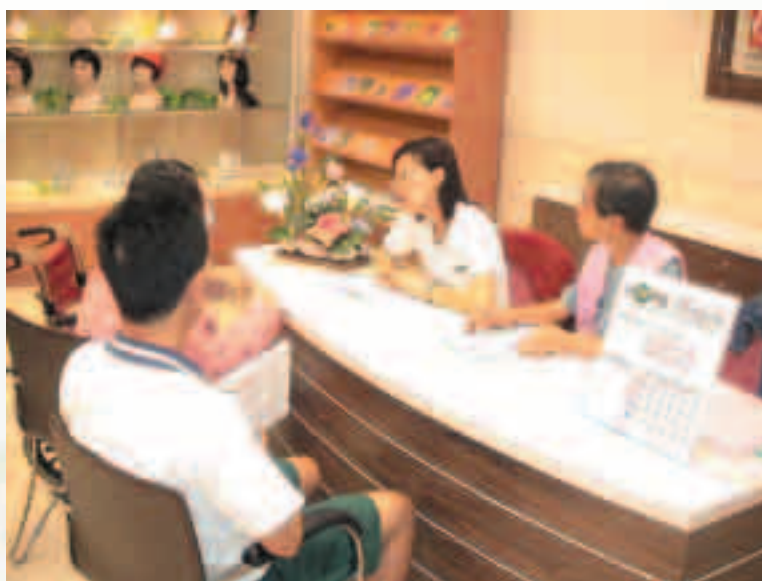
與中華民國癌症希望協會合作，成立希望小站，提供癌症病患諮詢、心理輔導、關懷服務以及衛教宣導活動及免費提供假髮頭巾。

高雄榮總創院初始，獲得臺北榮總、臺中榮總在人力上的支援，在醫療技術方面亦獲得相當的協助。79年7月11日與臺北榮總胸腔外科合作完成亞洲第1例單肺移植手術；79年12月9日完成眼角膜移植手術首例。80年4月17日完成國內首例『食道靜脈瘤結紮治療術』；同年8月及10月分別成功植入南臺灣第1例永久性起搏型及雙腔型人工心律調節器。81年8月完成首例腎臟移植手術，同年9月完成國內首例經頸靜脈肝內門靜脈體循環分流術。82年2月5日完成南臺灣首例心臟移植手術，奠定了高雄榮總器官移植基礎，同年7月完成後縱膈腔腫瘤胸腔鏡手術首例，12月完成首例子宮頸外孕症，以子宮內膜搔刮術合併化學治療及子宮頸動脈栓塞等保守性治療，得以保留病人子宮，此為國內罕見之病例，該病人已於84年順利懷孕產下1子。83年6月18日完成國內首例『全喉及下咽切除腫瘤後，利用自體空腸及血管吻合手術接補口咽及食道』，國外亦列為新報導手術之一。84年1月起成功使用頭頸胸固定器，經口顯微減壓術和椎板間骨融合術，治癒四十多例嚴重第1、2頸椎病變患者，為國內此項手術之先驅，2月診斷出國內35年來本土首例霍亂傳染病，8月完成全球第2例使用心導管電氣燒灼術成功治療伍爾夫、帕金森、懷特症候群併永久性房室交界再進入型頻脈。