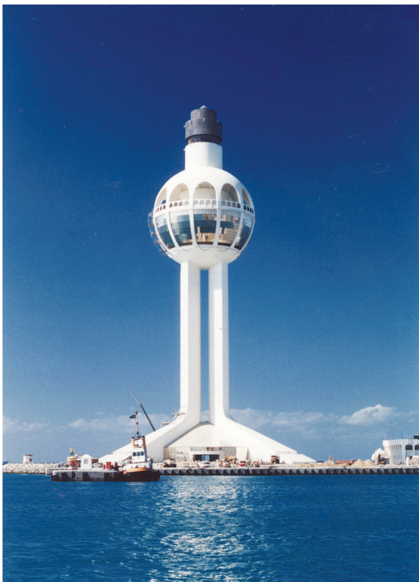
榮工在沙烏地吉達港從日商手中接辦完成的控制塔，成為吉達地區的地標。

因地質因素，開工以來災變頻傳的高雄捷運工程，由本公司參與施工的路段，均大致平安，潛盾機不但成功地穿過蘋果森林大廈樓底，且中山路與中正路交會的大圓環車站工程的施工，還成功的