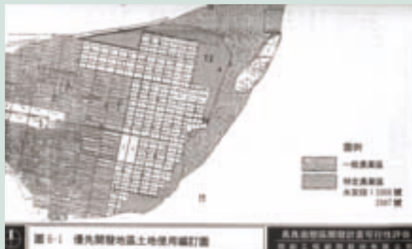
民國70年長良墾區水稻種植情形