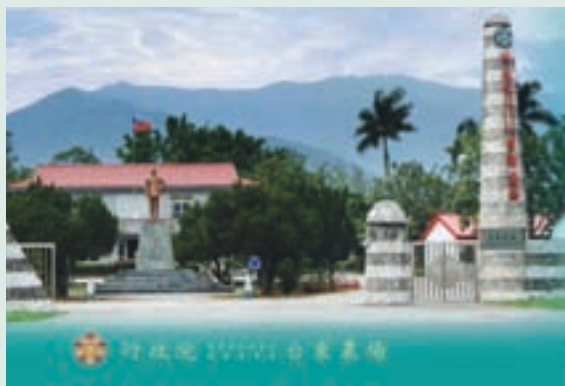
民國90年代台東農場大門