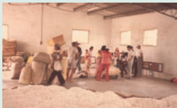
民國67年養蠶農民繳交蠶繭情形