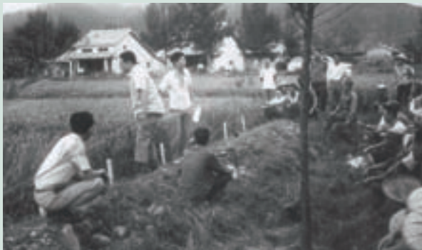
民國50年設立水稻種植研討班的田間臨畝實況