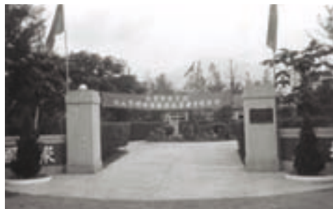
民國50年代台東農場大門

民國40、50年代政府推行精兵政策，為妥適安置大量退除役官兵並兼顧本省農業生產發展，乃依照退除役官兵體能狀況與各人意願，利用政府撥用之農地、山坡地、河床地、國有林班、水池及海埔新生地，先後創設農、林、漁業機構，以達人盡其才、地盡其利之目的。農場即在此因緣下成立於43年3月1日，初名「台東大同合作農場」，隸屬國防部，以接收國防部台東縣屬之兵工墾區及部隊公田土地計890餘公頃為基礎開始經營；墾區分部於池上、都蘭、八里、台東、美和等地，農場設直屬中隊（二），職員43人、場員360人，所有土地均為條件極差之河川荒地，非但荒草沒脛，且巨石遍佈，端賴我榮民弟兄不畏艱難，披荊斬棘，疊石平土，辛勤經營，始有今日之規模。