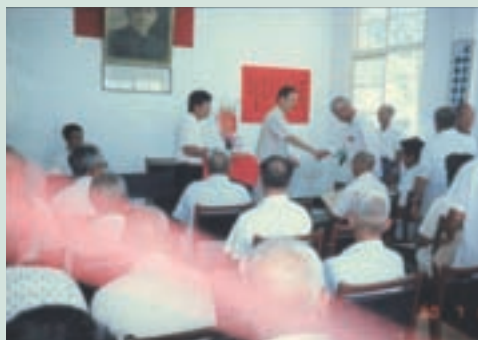
民國85年頒發農地放領土地權狀