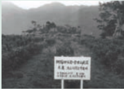
民國57年知本農場試種阿薩姆紅茶茶葉區