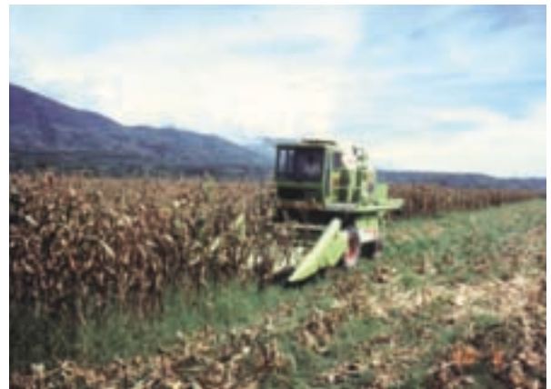
民國88年長良墾區以機械採收玉米情形