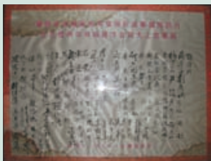
民國70年戰士授田簽名網