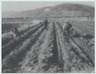
民國58年知本農場甘薯試種區