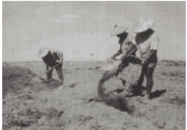
民國50年代長良墾區人力開墾情形

農場歷經半個世紀，由人力農耕時期，進而發展為機械農耕時期，而現階段為因應新的世紀來臨，配合國人生活品質的提升及休閒活動精緻化的要求，農場已逐漸採取農地委託經營及轉型為休閒農場，並朝多元化方向經營。