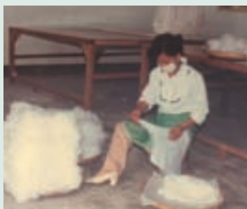
民國72年以人力剝乾絲綿情形