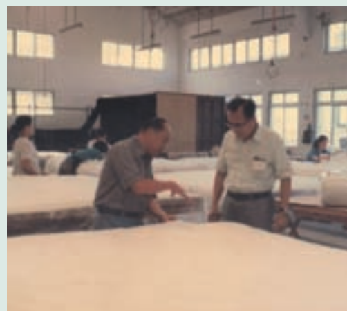
民國70年製作蠶絲被盛況

民國56年起在東河合作農場開始輔導場員種桑養蠶；58年復在關山自力墾區設立示範桑園；60年再於池上成立蠶種繁殖場，62年5月響應政府加速農村建設計畫，開發池上旱地50公頃種桑，由輔導會與台東興業食品公司合作成立欣欣蠶業公司，設置東部蠶業生產專業區，並在池上設立蠶絲加工廠；63年5月自日本進口繅絲機器；65年引進日本機械養蠶設備。從此輔導會在東部擁有繁殖桑苗、種桑養蠶、蠶種繁殖及蠶絲織綢等一貫作業生產線，為全省最大蠶業生產專業區，因而政府官員、民意代表、媒體記者等前來觀摩絡繹不絕，71年6月24日泰國皇室侍衛長尼蘭上將由鄭故主任委員為元將軍陪同，前來本場考察栽桑養蠶事業，68年至74年間為種桑養蠶之高峰期，78年以後因整體經濟型態急遽改變，輔導會因而決定將絲廠售予日商。