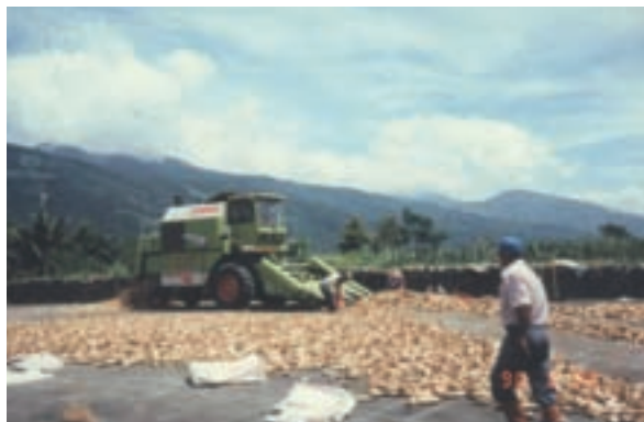
民國88年長良墾區機械玉米脫粒