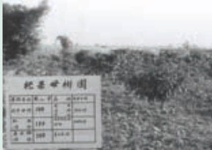
民國57年知本農場種植芒果新品種