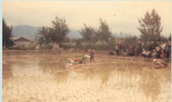
民國70年代農機講習時農機具操作耕種情形