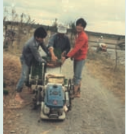
民國76年農機講習農民操作時農機具耕種情形

民國60年起為順應政府制定之新農業政策，並配合本農場改進計畫及適應榮民逐漸步入中年後體能之變化，重新檢討輔導農莊以三對等方式（補助、貸款、自籌各1/3之經費）自購中小型農用機具，當時以耕耘機、走行式插秧機、動力運搬車等為主；70年場部設立機耕中心，購有曳引機、水稻聯合收穫機、乘座式插秧機等中大型農機及水稻育苗中心培育機插秧苗，租金以低於市價供農莊場員代耕。