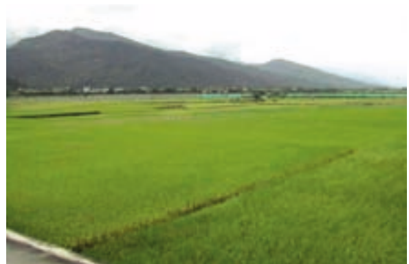
民國90年長良墾區種植有機水稻情形