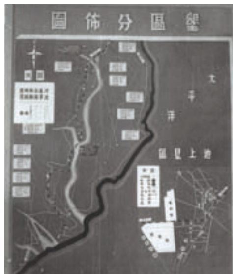
民國60年代池上墾區分佈圖