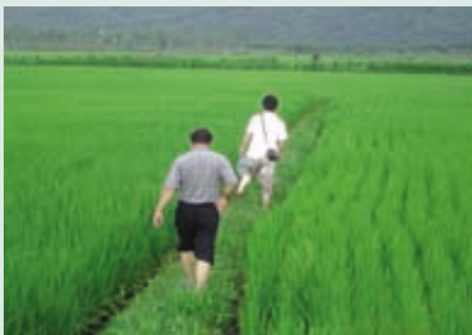
民國95年現耕水稻田之美景