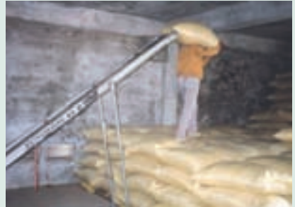
民國75年台東農場倉庫以人工方式搬運稻米

時光過得真快呀！轉眼間年華已老逝，現代的種稻技術又更加精良，你看當下的池上米已成為米中之王「總統米」，打響了我們池上鄉的名號，這真是我們池上鄉之光。