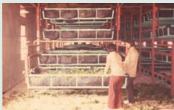
民國65年機械養蠶給桑葉情形

蠶寶寶的養育可是一點也不能馬虎，我們從蠶卵開始，細心呵護牠們孵化，由蠶卵變成蟻蠶時，須時時刻刻觀察其動靜，蟻蠶出來了，同學們便開始採集細嫩的桑葉，有如媽媽般小心將嫩葉切碎餵食蟻蠶，日復一日的看著蟻蠶長大成為肥肥胖胖蠶寶寶。期間我們全時看顧蠶寶寶的成長，每日凌晨兩點皆須給予餵食並記載蠶寶寶的成長過程，同學們開始互別苗頭，看看誰所養的蠶寶寶比較健壯，誰照顧得最好。經過4次眠期（蛻皮）到了五齡壯蠶後期時，金黃且剔透的熟蠶開始吐絲，來個三天三夜「作繭自縛」誰也不理誰的不認帳行為，續後我們便伸出輕快的魔手，將蠶繭剖腹蒐集大量的蠶蛹，依照所學知識挑選精英雌、雄蠶蛹，來個國際性（中國、日本、歐洲種）的我愛紅娘，紅娘愛我的友誼橋樑—進行蠶寶寶羽化後的配對大事，當