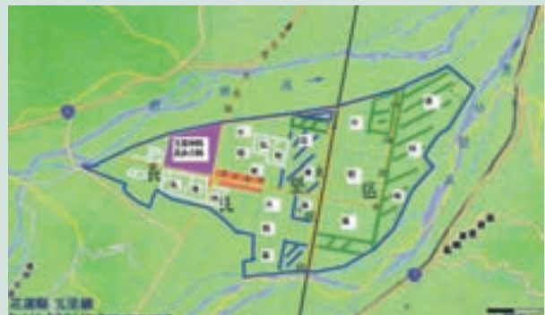
民國86年長良墾區水稻區規畫為渡假休閒區