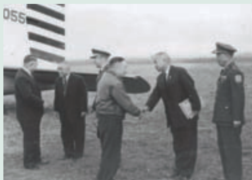
民國51年第3任同堂先生(左2)接待蔣主任委員經國先生(左4)蒞臨池上鄉台東農場視導

任場長任內積極改善榮民生活品質，連續於53、54、55年三年榮獲輔導會評比第一名，考成特優，獲先總統蔣公親自召見嘉許。58年督導關山墾區示範桑園及綠蘆筍試種育苗，成功存活率均在90%以上，榮獲記大功一次獎勵。