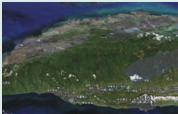
民國95年代台東農場墾區分佈圖