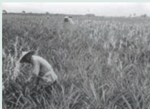
民國50年代池上墾區鳳梨種植情形

農場成立之初輔導榮民從事農、林、漁、牧等勞力密集工作，民國43年12月1日農場奉命改隸行政院國軍退除役官兵輔導委員會（以下簡稱輔導會），同時改名「池上大同合作農場」，當時依照安置人員之條件實施合耕合營或個別經營，並就尚未配用之土地，進行試驗研究及經營示範，以引導榮民農業經營更精進。50年2月1日農場復改隸台灣省政府合作事業管理處，52年4月1日再回隸輔導會。同年6月接收東部土地開發處撥交之大南墾區後，分設知本、大南2個輔導區，下轄55個生產小組，又於同年11月擴充安置再增加5個生產小組。