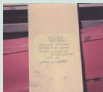
民國65年裝設全省第1套自動化養蠶機械