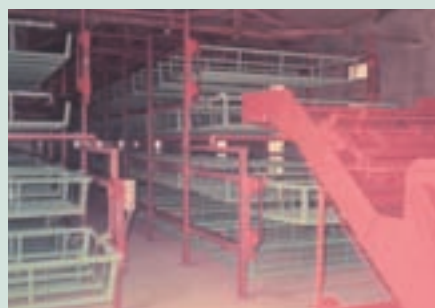
民國65年自日本進口全省第1套自動化養蠶機械