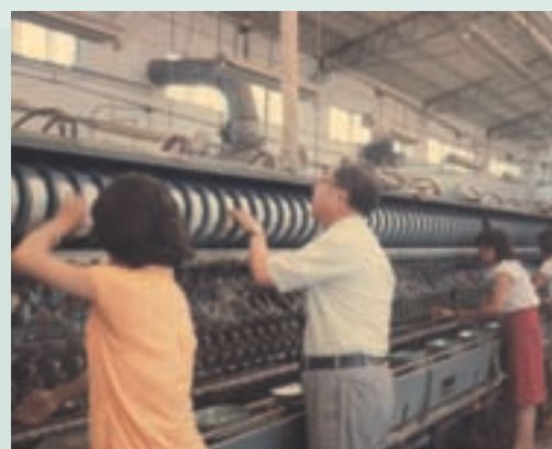
民國63年欣欣蠶業公司引進繅絲機器