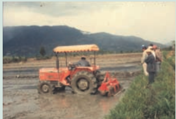
民國70年代曳引機於水田整平耕作