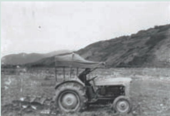
民國60年代曳引機掛板犁型翻土