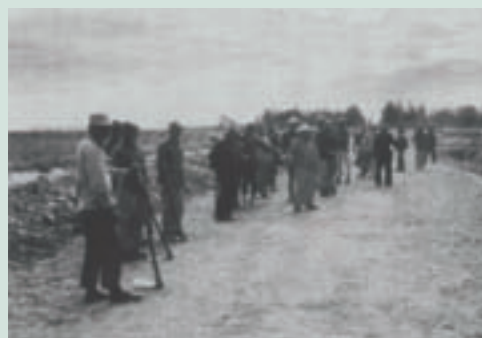
民國40年代榮民弟兄以人力集合下田耕作

本農場主動協助合營農戶，向財團法人國際美育自然生態基金會（MOA）申請水稻有機栽培驗證，分別於94年5月及9月間完成初次現地土壤樣品送驗，94年6月間完成栽培相關資材送驗作業，協助長良地區合營農戶向花蓮玉溪農會申設有機栽培水稻產銷班。94年11月底辦理稻穀及土壤品質檢測採樣，建置農產品生產履歷制度。截至目前為止實際從事有機稻米之生產共有7人，種植面積達53公頃餘，期能生產「安心」且「安全」之產品提供消費者食用，並落實輔導會輔導研發農特產品及照顧榮（農）民生活之德意。