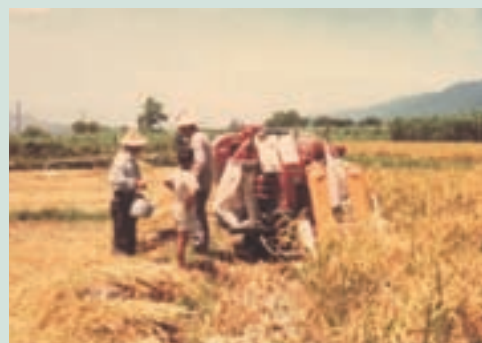
民國87年池上地區種植水稻機械收割情形