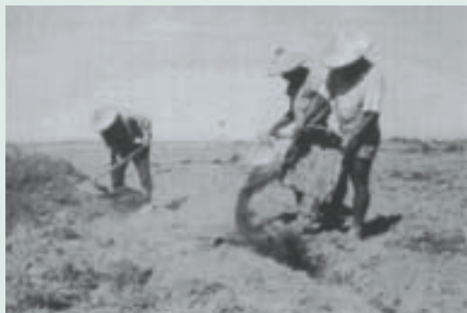
民國75年與同袍共同為改良農地攤平客土打拼

在農場裡，我從工友一職，憑藉著平日努力工作，獲得長官的肯定，晉升到技工之職位，直到退休。在農場服務的這段歲月裡，與場裡的技術員共同研究如何栽種品種優良、造型特殊之花卉樹木，更精心研究如何能種出甜美的桃子，以達到既可造景又可供民眾採果和觀光的多重價值。但是歲月不饒人，它不僅在我臉上留下痕跡，更在我身上烙上不可抹滅的烙印，讓我更覺力不從心，便毅然決然的卸下職務辦理退休。退休後的我，原本以為可以過著田園般的悠閒生活，無奈卻仍放不下原已習慣的務農生活，就只好在僅有的土地上種種水稻，一方面調劑身心讓自己變得更有活力，更藉此與後輩研究種植及培育的新方法，讓自己增加新知識，不致與社會脫節。