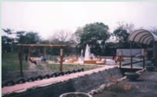
民國89年整建後增加之遊憩設施

為配合政府委外經營政策，92年公開招標甄求經營廠商，於93年11月1日委由墾丁假期股份有限公司所成立之特許公司南園休閒農場有限公司經營，經營期限為10年。