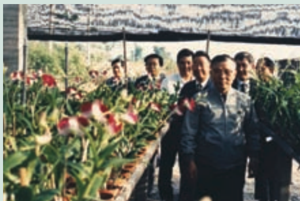
民國73年輔導會許前主委歷農先生視察秋石斛生長情形