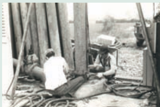
專業技術人員指導安裝灌溉水井設施

早年農場大部分的土地都是河川沖積所形成之荒蕪砂礫河床地，因砂石多、土壤少，水土保持困難。場員們從雙手搬石頭、修築灌溉排水溝渠做起，初期以畜力耕作，到後來的農作機械化，都在本會積極規劃及資助，以及農復會、水利局等其他各單位的經費補助與技術協助下，進行水