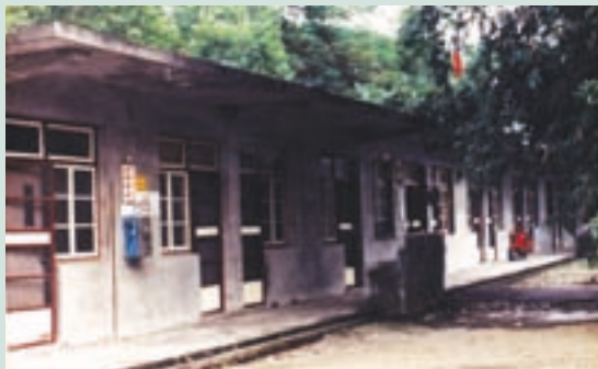
民國69年單身場員宿舍（鋼筋水泥宿舍）