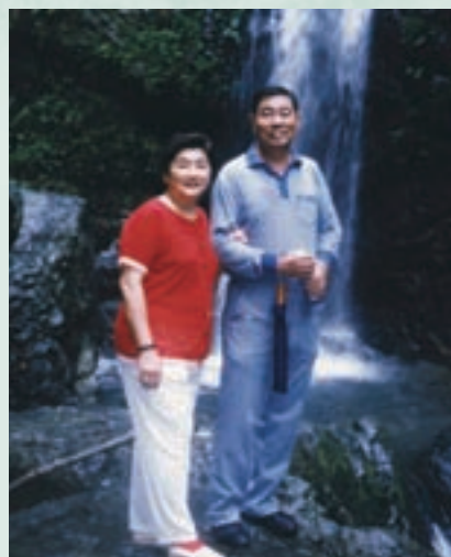
李場長偕夫人合影

李場長山東省沂水縣人，民國28年6月12日生，陸軍官校33期、陸軍參軍大學、革命實踐研究院，歷任參謀長、副師長、師長、副軍長、處長、場長。任內貫徹輔導會農場簡併、人員精簡政策；積極改善高雄分場休閒設施，改善景觀，開發多項休閒遊憩設施，大幅提升業績，促使觀光休閒事業向前大步邁進並爭取整體規劃，奠定日後營運良基；加強場員配墾地放領工作，突破瓶頸，解決困難，使放領工作加速進行。