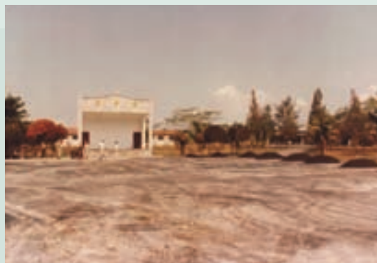
新建榮華堂廣場施工情形