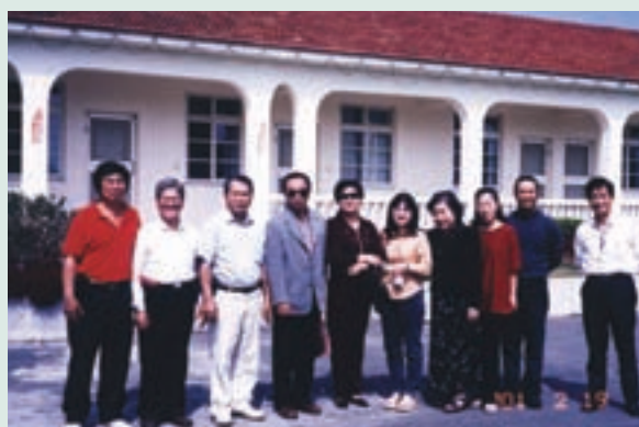
李副場長（右1）於高雄休閒農場接待武陵農場員工蒞場觀摩時合影