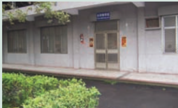
原場部會議室（現為綜合辦公室）

67年間辦理個別農墾戶64戶，編餘職員18戶，共計82戶，配耕土地總面積157.3951公頃。