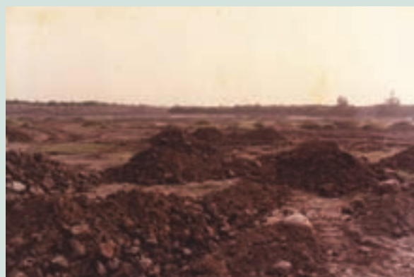
民國58年土地開墾後客土改良情形