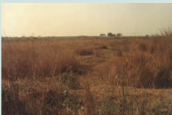
民國57年農場土地原均為荒蕪之砂礫河床地