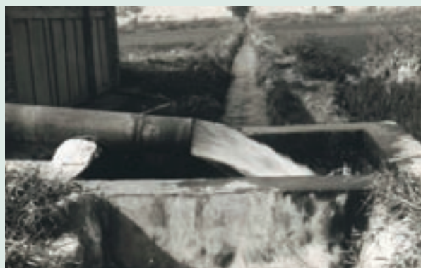
灌溉水井抽水情形