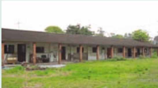
單身場員宿舍（磚造瓦屋）

66年度推行農業機械化，購買動力噴霧器1台、脫谷機1台、水稻收割機1台，並推廣機械代耕作業。