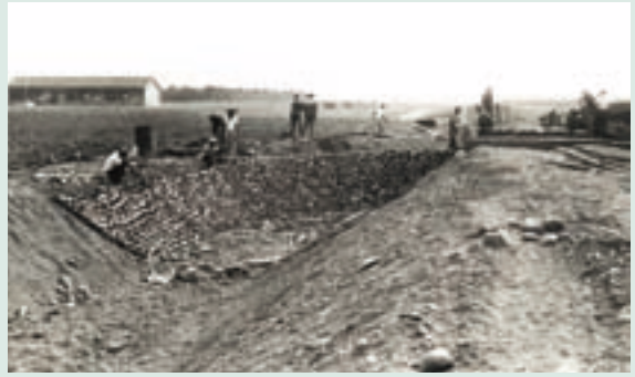
民國60年修築農路及灌溉排水溝施工情形

利設施的建設。民國57年10月至73年間土地改良484公頃，新鑿灌溉用深水井14口及農水路之配合興建，完成土地開墾、改良之艱鉅任務。在農場幹部們積極協助，長期辛勤耕耘的開墾下，使滿佈砂礫的土地轉變成有生產效益的良田，奠定農場經營發展之良好基礎。