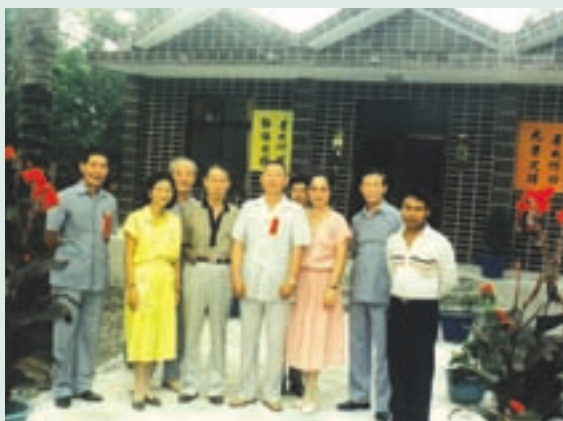
民國77年場史館新建完成啓用

本場奉命於87年7月16日簡併高雄農場，並辦理人員精簡，簡併後高雄分場由輔導會投資6,300餘萬元整建，以經營休閒農場為主，爾後農場正式邁入觀光休閒與農業生產兩大主體之經營。