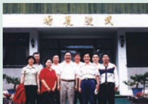
李副場長（右3）率員工赴武陵農場觀摩合影

「人生如戲，戲如人生」，李副場長表示：進入輔導會農場，即抱定服務的人生觀，服務三十餘年的公職生涯中，在輔導會農場，擔任服務的角色，在每個工作崗位上，均能全力以赴，戮力從公，內心時常自我吶喊著：「為輔導會農場工作，是一項榮幸，也是一份責任」，不斷自我激勵，希望在人生的舞台上所付出的苦心及努力，沒有辜負長官們的期望，如此才敢輕輕地說，沒有白白地虛度此生。