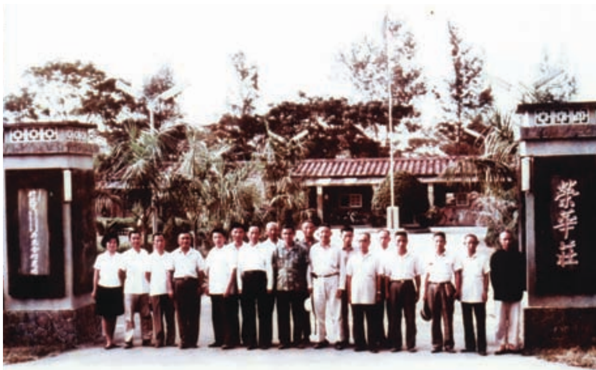
前主任委員經國先生命名場部為「榮華莊」

本場成立於民國43年11月1日，前身為國防部所屬隘寮、竹田大同合作農場，主要任務是「安置解甲歸田之退除役官兵，開墾荒地，從事農業生產，以期安居樂業，繁榮社會，裨益國家經濟建設之發展」。51年7月1日將「隘寮大同合作農場」及「竹田大同合作農場」合併，更名為「屏東大同合作農場」，第1任場長由葉藹青先生擔任，場本部設置於屏東縣長治鄉隘寮。51年11月蔣前主任委員經國先生巡視農場時，將場部所在地「隘寮」，命名為「榮華莊」。52年3月20日農場更名為「行政院國軍退除役官兵輔導委員會屏東合作農場」；並於58年11月1日正式定名為「行政院國軍退除役官兵輔導委員會屏東農場」沿用至今。場本部新建辦公室於59年1月8日落成啟用，設場至今已有51個年頭，並於87年7月奉命簡併高雄農場（高雄農場成立於44年3月場部設於高雄市楠梓區）。