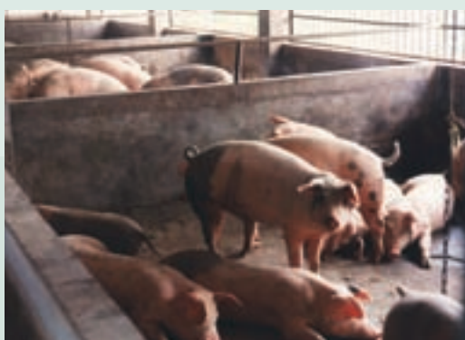
農漁牧綜合經營養豬情形