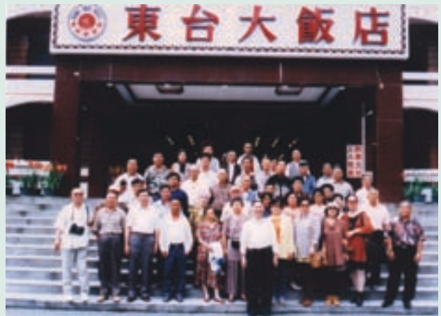
來場長（前中立）率員工自強活動

來場長河南省安陽縣人，民國30年6月29日生，空軍官校46期、德國基森大學博士畢業，歷任農業顧問、副場長、副處長、場長。任內有效開發利用閒置土地，積極擴大辦理直、合營事業，大幅提升營收，自給自足率由59%提升至71%，力行行政革新、勤政、速捷、確實及教導員工電腦，提升工作效率。