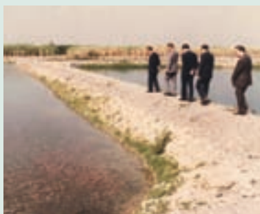
直營生產養殖尼羅紅魚情形