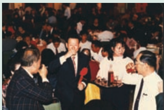
柏場長（左2）參加場員結婚喜宴

柏場長湖南省陽縣人，陸軍官校17期、陸軍參軍大學正10期、三軍聯大戰爭學院65將官班，歷任團長、師長、副司令。任內倡導突破生產造福榮民，開辦魚池9公頃養殖尼羅紅魚及泰國蝦、培植由泰國引進之石斛蘭花0.5公頃、葡萄5公頃、牧草100公頃等直營生產事業，興建場部及各農莊活動中心6處，裝設自來水設施，提供自來水飲用，倡導以場為家的管理觀念。