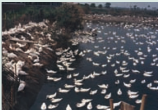
民國70年間推廣農漁牧綜合經營養鴨情形

70年間政府推廣漁牧綜合經營政策，輔導會為輔導榮民提高生產收益，經政策輔導本場成立漁牧綜合經營區，面積8.4公頃，興建豬舍14棟（每棟飼養種豬8頭、肉豬60頭），搭配每口6分地之魚池經營漁牧生產。