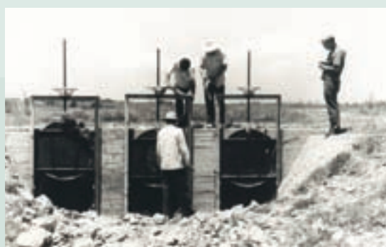
專家指導興建灌溉設施