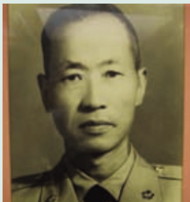
許場長著戎裝時英姿

許場長湖南省永興縣人，民國9年2月9日生，陸軍官校16期、陸軍參軍大學正6期、三軍聯大戰爭學院正15期，歷任團長、處長、師長。任內繼續推展農業機械化，更新農業機具。與農林廳種苗改良場合作種植採種玉米50公頃及直營種植銀合歡10公頃。