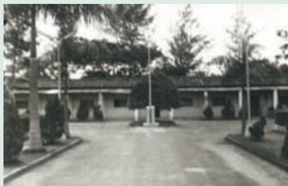
民國43年11月設立場部辦公室