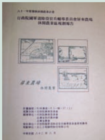
民國82年籌辦休閒農場整體規劃計畫書