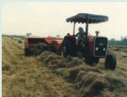
大面積牧草栽培機械採收情形