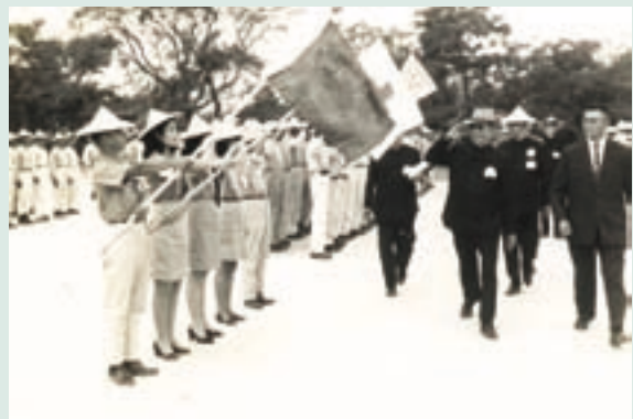
諶場長（右3）陪同輔導會長官視察永安演習