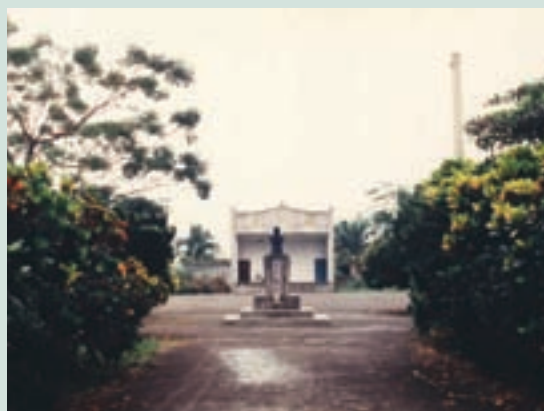
民國53年完工之榮華堂全貌