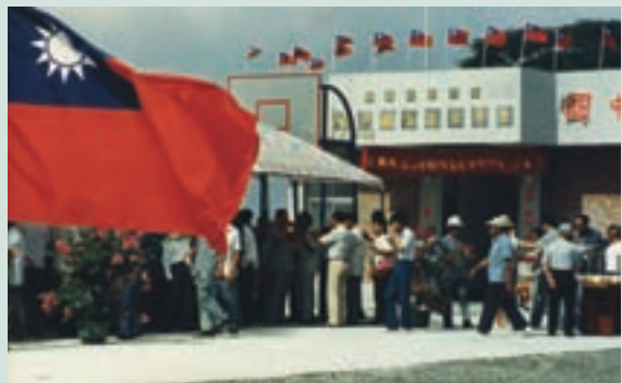
榮華社區活動中心於民國74年10月落成啓用

69年間擴大推展農業機械化，新購曳引機、插秧機、聯合收割機、烘乾機、噴射霧機、動力脫谷機各乙台，並成立農機代耕隊為場員服務，加速推動農業機械化。