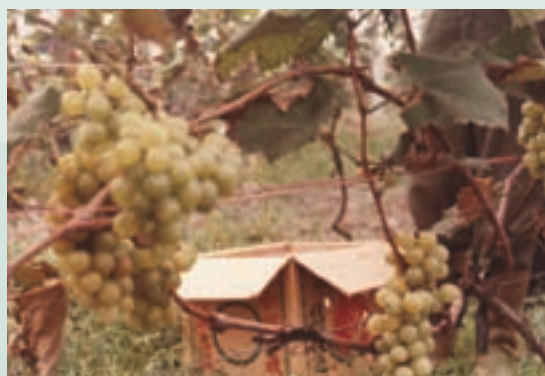
民國73年葡萄栽培結果情形

為加強直營生產，於72至73年間場部完成開闢魚池9公頃。種植葡萄5公頃、培植蘭花0.5公頃、牧草100公頃等，開始辦理直營生產，並探求技術經驗，有成效之項目推介場員作生產參考。當時直營生產以水產養殖成效較佳，推介場員輔導生產，餘3項成效未臻理想。