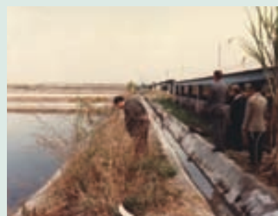
農漁牧綜合經營全貌

為加強直營生產，於72至73年間場部完成開闢魚池9公頃。種植葡萄5公頃、培植蘭花0.5公頃、牧草100公頃等，開始辦理直營生產，並探求技術經驗，有成效之項目推介場員作生產參考。當時直營生產以水產養殖成效較佳，推介場員輔導生產，餘3項成效未臻理想。