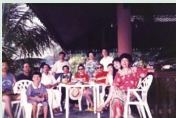
李副場長（左5）獲選民國84年模範公務人員接受行政院招待至馬來西亞遊玩時留影

屏東農場長達13年之久，值得提出成果分享的，包括協調爭取地方政府經費補助250萬元，建設汾陽社區排水溝，柏油路、路燈、社區活動中心設備等公共設施，在榮華莊爭取設置自來水，改善飲水衛生績效卓著。