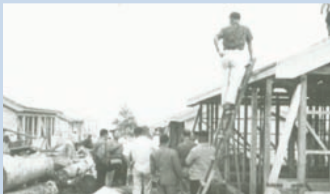
民國50年義民自力構建眷舍之情形（博望新村）