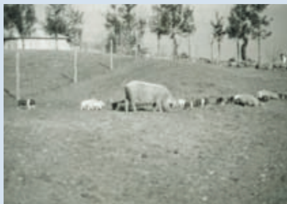
民國50年間豬隻於思源池邊放飼情形

農場始建，為改善義民生活，首推「豬隻培育計畫」，由農復會養豬專家指導，興建新式改良豬舍、浴池，為使豬隻有充分的運動，採放牧方式飼養，場部引進及培育優良仔豬及生產飼料，提供榮義民每家戶飼養之需，並推廣及於原住民，品系計有藍瑞斯、杜洛克、約克夏、漢布夏等，全盛時共養400餘頭，而仔豬也曾台中、南投、彰化等縣市建立良好信譽。民國57年間，為畜牧事業能朝專業化、精緻化及企劃化發展，遂決定停養，至59年度後完全停養。