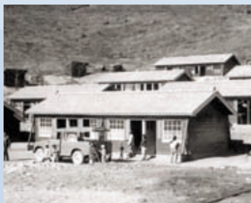
民國50年底壽亭新村興建完成，義民遷入定居