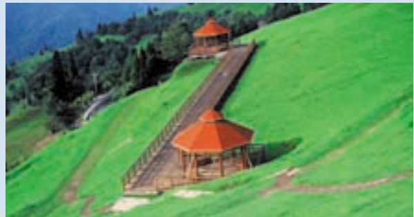
民國79年青青草原開始收費