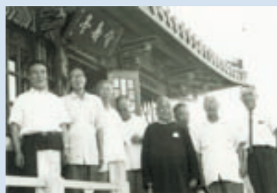
民國51年立法委員蒞場視察於介壽亭合影