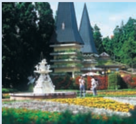
李場長民國86年推動小瑞士花園委外經營

江西豐城人，國立中興大學園藝系畢業，曾任技術員、副技師、技師、組長、副場長，任內整頓青青草原