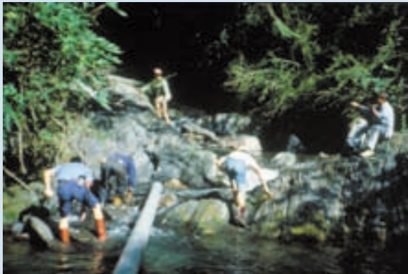
民國63年慈翁溪(瑞岩溪)水利工程水源頭施工情形

協助義民整建房舍為水泥磚造及增建定遠新村，並完成忠莊遷移，推動榮義民生活改善計畫，研製罐裝純正水蜜桃果醬一種增加榮、義民收益。