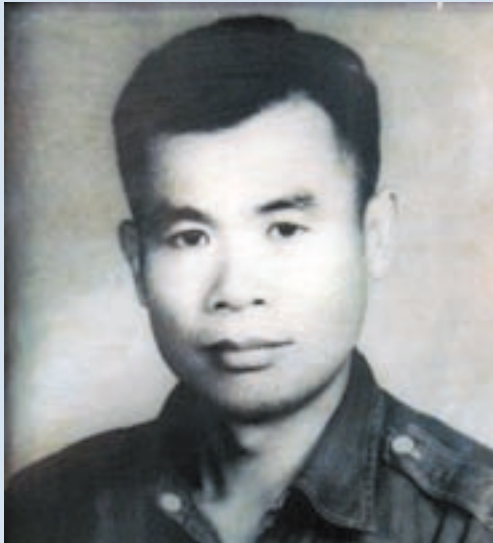
蒙老先生著軍裝英姿