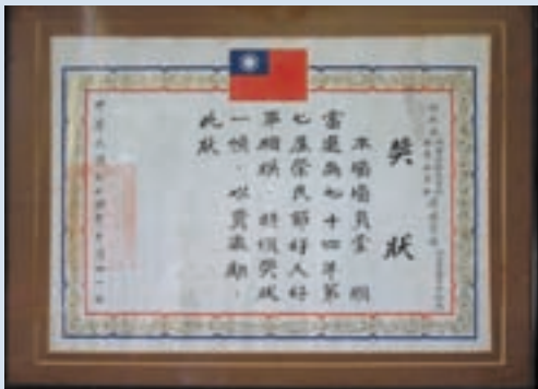
民國74年蒙老爹榮獲第7屆好人好事楷模