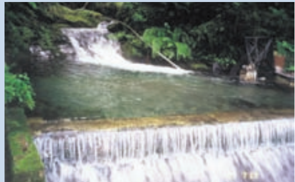
民國72年完工後之慈翁溪水源頭堰壩