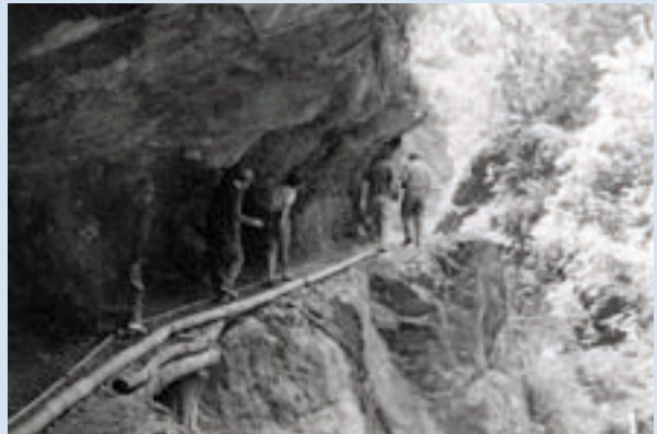
民國64年慈翁溪水利工程現勘情形