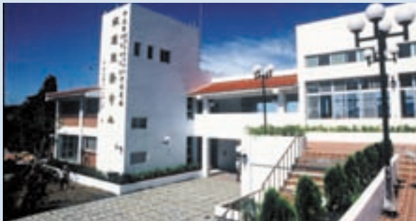
民國79完工之旅遊服務中心