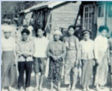
民國50年來自雲南少數民族（8族）婦女於壽亭新村合影村)

78年輔導會計劃將所屬之配耕土地放領給受配耕的場員，農場隨即成立作業小組，積極辦理榮義民場員的土地放領業務，歷時10年放領作業大致完成，榮、義民轉型成自耕農。