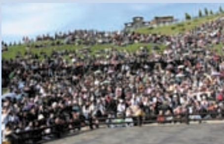
民國92年起農場年遊客量突破百萬