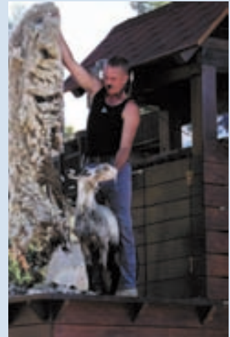
格蘭瓦歷斯表演羊咩咩脫衣秀

近年配合國土復育政策，積極推動生態旅遊，建置壽山園生態園區、生態解說志工、規劃生態導覽動線及遊程套餐，印製觀光摺頁及DVD簡介等，提供遊客更多元遊憩內涵與便捷、溫馨、豐富優質之旅遊感動，成為國內最佳休閒農場，締造百萬遊客到訪的佳績。