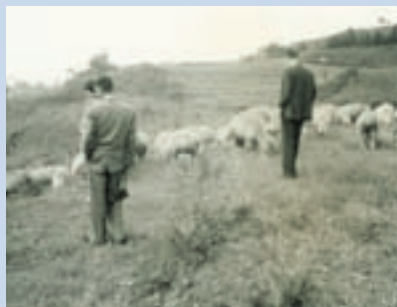
民國54年羊群於現賓館放牧之情形