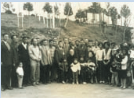
民國54年先總統 蔣公蒞場探訪與榮民、義民及眷屬合影

另為加強榮、義民健康照護，配合埔里榮民醫院支援醫療專車照顧場區榮義民，以提升場區榮義民之社會福利、衛生保健，爭取資源改善場員生活條件，擴大「志工服務」範疇，推行睦鄰運動、興建清境社區活動中心、協助場員各項資金貸款申請等，推動各村莊定期會議（榮團會、工作會報），推選各村村長以深入基層服務，協助各種災後重建補助及災害救助慰問金。