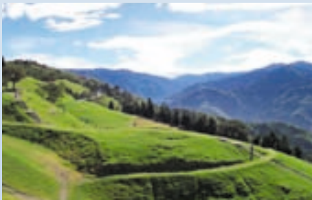
青青草原優美的景觀媲美瑞士風光