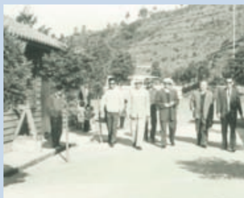
民國51年楊武場長陪雲南籍立法委員至博望新村關心義民生活狀況