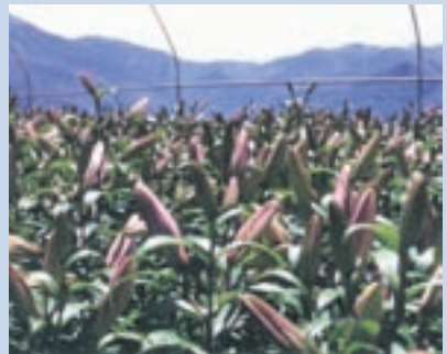
民國78年土地放領後義民於自有土地經營花卉