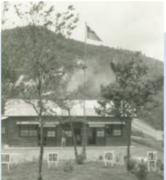
民國50年農場初成立沿用霧社牧場舊辦公室