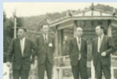
民國51年嚴前總統、經國先生、趙聚鈺主委及楊場長於瑞雪亭前