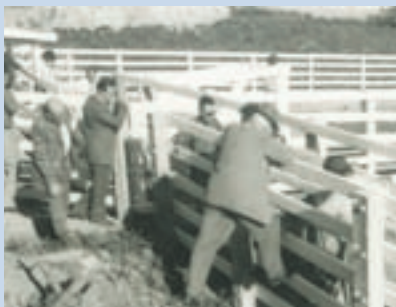
民國51年設置畜牧中心牛棚牛欄情形

69年自澳洲引進肉毛兩用之「柯利黛」種綿羊，幾經繁殖綿羊數量不斷增加，於71年開始規劃觀賞與遊客互動區，以滿足遊客抱羊拍照及仔羊人工哺乳之需，自此，農場羊隻漸由畜產經營轉為觀光遊憩經營發展，終成為本場重要觀光遊憩資源。