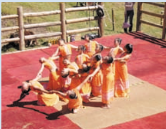
民國94年牛戀清境活動清境國小擺夷舞蹈表演

來到清境後，跟著義民們靠著雙手，開荒闢地、涉源取水，造就了今日清境的風華，儘管他們的身份曾經不明確，懸宕於承認與否認間，但是文化來自歷史，文化成形之後，歷史便會被彰顯，在行雲流水的手部翻轉與輕盈步伐下，子子孫孫在舉手投足間記住遠在雲南的故事。