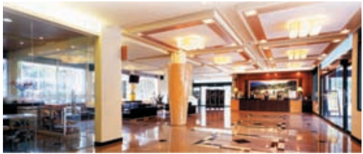
民國92年整修後之國民賓館大廳

78年辦理土地放領後，部分榮、義民第二代設立民宿，結合農場各項節慶辦理文化活動(如清境一夏)，營造清境成適合親子共遊之牧場體驗、觀景、避暑、賞楓、文化體驗之重要旅遊景點，並有觀光巴士導覽提供便捷、溫馨、豐富優質之旅遊。