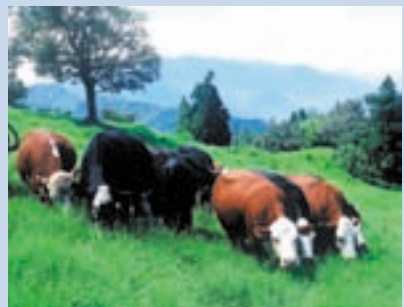
民國69年陸續購置繁殖之海弗、安格斯