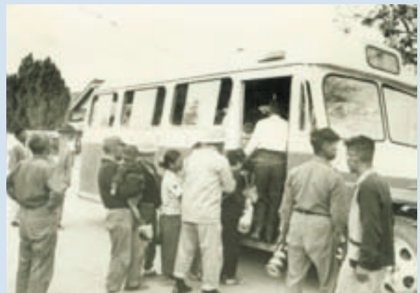
民國50年義民初來暫住埔里，自構眷舍完工後再由埔里接運上山之情形