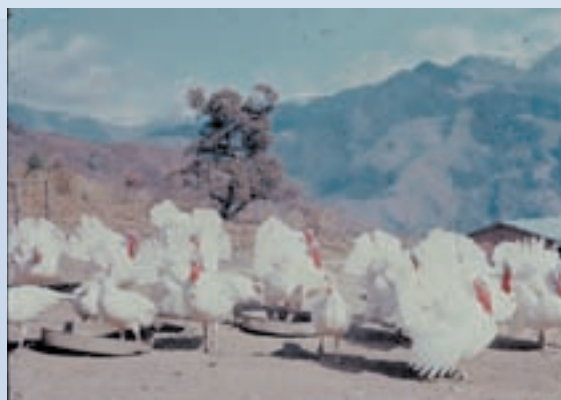
民國55年火雞飼養情形

另一項增加榮義民收益的是，輔導畜養美國白色小火雞，於民國53年間引進，亦採行粗放管理，且生長發育甚佳，頗具經濟效益，每年感恩節並提供數拾隻予駐台外國使館過節之需。