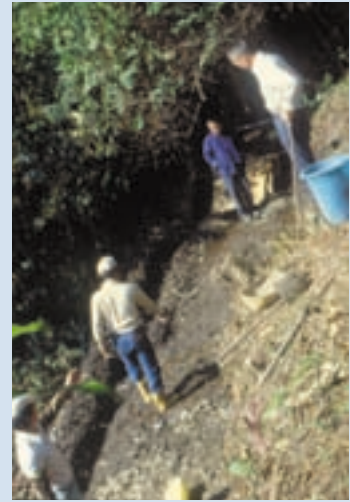
民國60年間以橫向截流方式取水情形

78年增設梅峰、松崗段，並與台大梅峰農場合資增設供水管乙條，81年底完工，為利水源管理，於83年間共組水利委員會管理。921震災後管線受損嚴重，且區內觀光用水日增，水源不足問題與日俱增，除數度函請省自來水公司興辦清境地區自來水外，並爭取921震災重建委員會於92年補助4000餘萬元進行整修及改善供引水系統，惟完工後功能未能發揮，繼93年敏督利颱風後再次嚴重受損，全區斷水，已由仁愛鄉公所辦理修復通水，並主導籌組管理委員會管理，為長遠之計，仍以自來水公司興辦自來水，始能徹底解決用水問題。