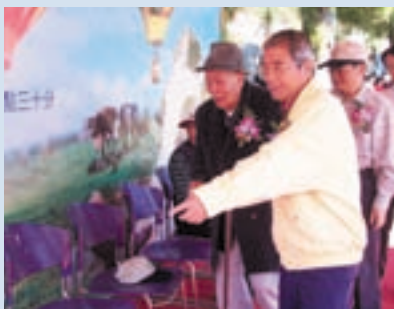
民國92年慶祝榮民節王場長(左2)邀請蒙顯老先生參與盛會