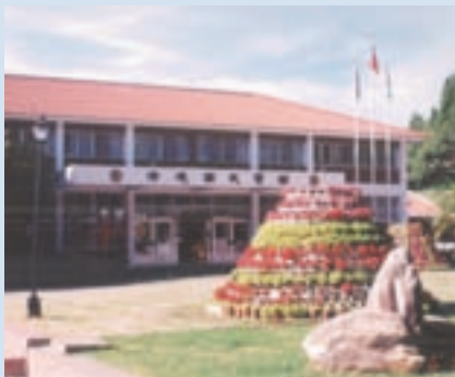
民國74年國民賓館落成開始營運

86年8月份試辦剪羊毛秀表演，87年正式開辦，自89年起已發展為本場主要休憩活動；休閒中心於92年委由統一企業、旅遊服務中心於94年委由乾坤食品公司經營，除提升服務層面與品質，亦增加經營效能。