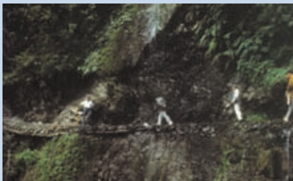
民國62年由原住民引領踏勘慈翁溪水源之情形