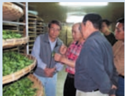
民國93年辦理茶文化體驗活動王場長(左1)親自體驗製茶過程