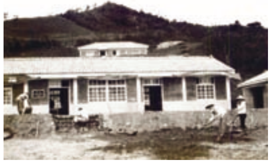
民國51年農場場部新建辦公室興建情形