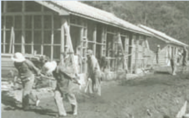
民國50年義民自力搭建眷屬房舍，以人力、鋤頭、圓鋤整地之情形（於博望新村）