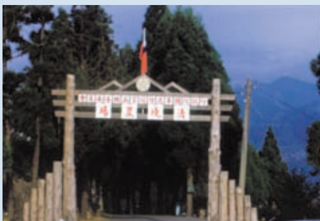
民國56年農場更名清境農場，新製入口排牌

56年，蔣故總統經國先生因感於此地「清新空氣任君取，境地優雅是仙居」，遂於同年10月1日指示輔導會更名為「行政院國軍退除役官兵輔導委員會清境農場」，沿用至今。