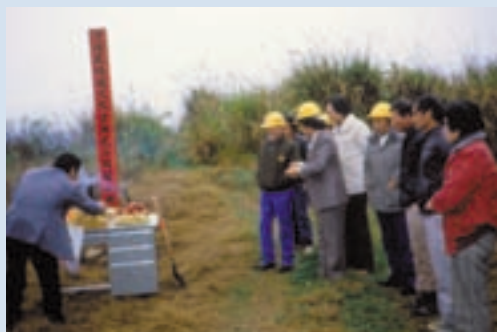
民國72年國民賓館奠基呂場長(左)主持破土典禮

山東青島人，任內完成農場組織編制，持續慈翁溪引水工程之興建，設立果菜專業區，並致力改良黃肉罐桃與板栗加工，成立水果門市部自力銷售本場果品，另