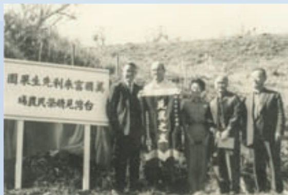
民國52年美國富來利（左2）先生果園立牌時與農場長合影

69年為增加榮義民收入，與渠等簽訂「直營果園間植蔬菜共同經營」協定，但因經營成效不佳，自70年代起漸次改採委託經營或技術合作。