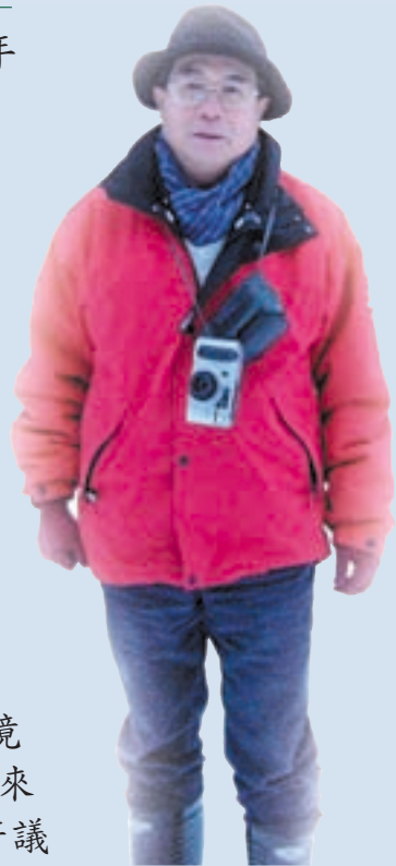
民國94年3月雪，攝於場部前

為提升旅遊品質，引進統一企業進駐，提供多元服務，締造營運另一高峰，民國92年榮獲行政院頒發「行政院服務品質獎—善用社會資源」，完成場區英語生活環境建置，94年獲行政院研考會評列為「優等」，完成國民賓館整修，改建草原太陽能表演台，整治園區內廢棄管線，還清境一個清淨空間，積極協商自來水公司興辦清境之自來水業務，刻由經濟部水利司及自來水公司評估研議中，辦理ROT促參案，獲行政院頒發「清境農場旅遊服務中心民間參與營運招商ROT案績效卓著」獎。