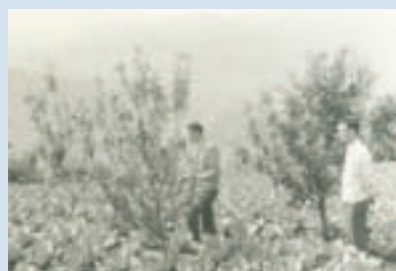
民國52年為增加榮義民營收，輔導於果園間植蔬菜之情形