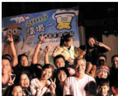
2006年清境一夏活動王場長（前右3）與遊客同歡