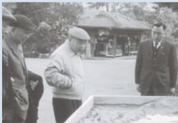
韓場長（右1）向經國先生簡報新人岡水利工程興建計畫模型

廣東寧陽人，原任苗栗合作農場場長，任職期間，原武嶺水庫興建計畫變更，改以蓄水池設計工程替代，完成場區內14-20鄰各村莊道路廣場柏油路面鋪設、與農業試驗所合作藥用植物試驗、與公賣局合作試種啤酒花，規劃新人岡水利工程興建計畫，引進虎頭蘭試種。