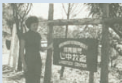
民國50年為發展畜牧事業成立之畜牧中心