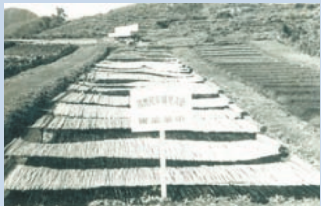
民國52年間設置之見晴榮民農場中藥苗圃