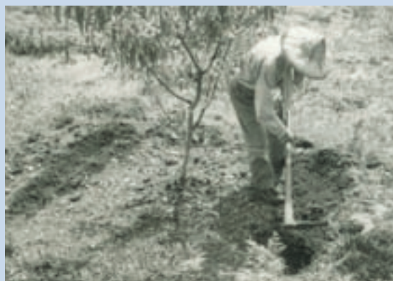
民國69年推動果樹間植蔬菜之情形