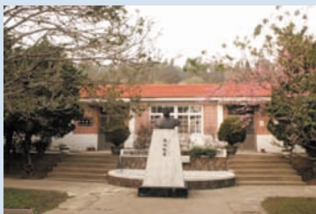
農場場部辦公室仍維持民國51年初建時之規模