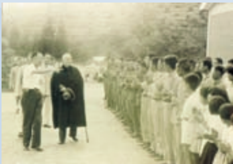
民國52年蔣公蒞場巡視榮、義民於場部列隊歡迎

輔導會主任委員、文教大隊以及各級長官也不定期來場訪問並關懷、慰問榮、義民之生活狀況與農墾情形，參與春節團拜、紀念蔣公逝世周年大會暨歷年亡故榮義民（榮民節）、婦女節、元旦升旗典禮等慶典活動，並於榮民節舉辦「榮民模範」「員工楷模」「優秀青少年榮民子女」選拔表揚活動。