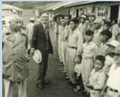
民國51年立法院雲南籍立法委員（左2）至壽亭慰問義民之情形