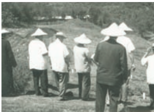
民國51年立法委員參訪參觀中藥試驗區之情形