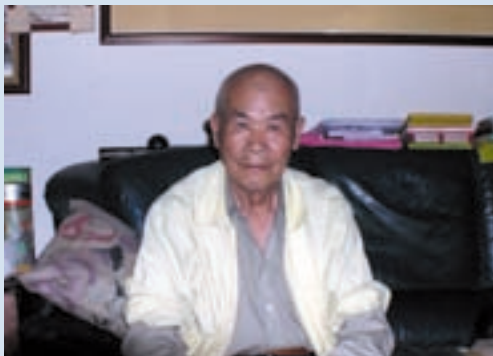
民國93年於壽亭新村住家留影鄉音無改鬢毛催