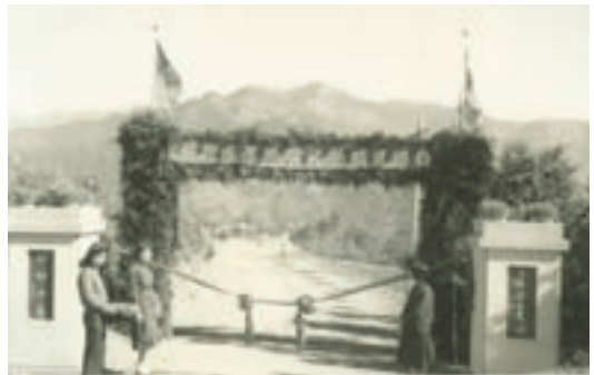
民國51年秋，台灣見晴榮民農場新場部行政區落成典禮