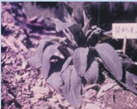
民國50年起進行試驗種植之毛地黃

前述中藥試驗，經多年觀察，部分雖品質符合，卻因產量較低，經濟價值較低，因此，試驗計畫於61年底全部結束，而原栽種之啤酒花則移植他處試種。