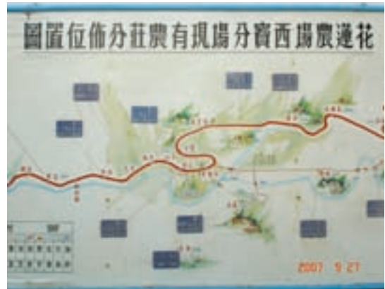
西寶分場早年農莊分佈位置圖。

民國46年9月間輔導會為供應東西橫貫公路築路員工新鮮蔬菜之需，於花蓮縣秀林鄉天祥地區成立西寶榮民農場，48年3月擴大梅園、蓮池、文山等墾區範圍及安置人數，51年再擴充竹村墾區，奉行政院正式核定成立西寶榮民農場，安置開闢中部東西橫貫公路參加築路之榮民，初期計在立霧、合流、綠水、文山、谷園、蘭苑、蓮池、竹村、松岡及洛韶等地點成立11個農莊，種植蔬菜、飼養禽畜，供應開路人員食用為主。場員在這些農莊開山闢地備極辛苦，山區交通不便，生活條件極端不佳，但我榮民袍澤不畏艱辛，將千萬年來之蠻荒地區，開闢為田園，並逐步建設成為人間仙境，58年2月1日撥入花蓮農場改稱西寶分場。