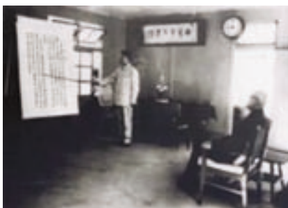
民國48年先總統 蔣公（右）視察西寶榮民農場，聽取邵場長子煌業務簡報之珍貴歷史照片