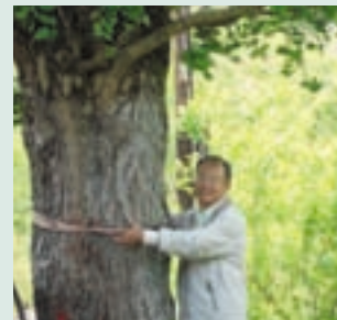
見證竹村發展史之百年台灣第一巨大珍貴銀杏樹