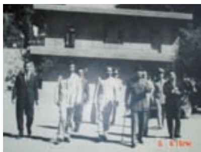
民國51年間老主任委員（右1）陪侍先總統蔣公巡視西寶榮民農場之珍貴歷史照片