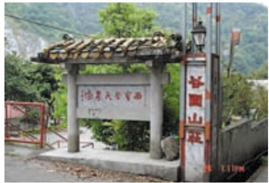
西寶分場谷園山莊之「西寶榮民農場」名銜，係民國48年由黨國大老書法名家于右任所書墨寶