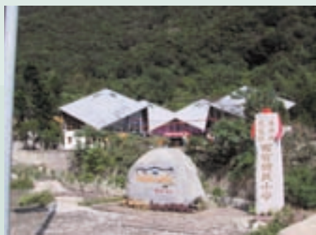
聞名中外森林實驗小學—西寶國小美麗的大門景觀

民國56年前老主任委員經國先生為協助西寶榮民、場員改善生活環境，每戶贈送60棵水蜜桃及二十世紀梨樹苗，總計有6,000棵樹苗及每1平台1具石磨供榮民種植大豆磨豆漿、玉米食用，來增加營養，增強體力。也由於經國先生的先知卓見，開啟竹村地區溫帶果樹：水蜜桃、蘋果、二十世紀梨及加州李等溫帶水果的盛名。竹村農民更在70年間在第4梯台推廣高經濟的高冷果菜如梅、青梗白菜、紫色甘藍、球莖甘藍、結球白菜、甜椒、四季豆、蠶豆種植及蔬菜種子採種等農業生產，這些產品品種優良，因種在高山寒冷區，不需噴洒農藥，所有產品鮮美都可生食，深受消費大眾歡迎，既能增加收入又能滿足老饕的嘴與胃，至今西寶農場水蜜桃與高山蔬菜之美名「榮民生產、品質保證」