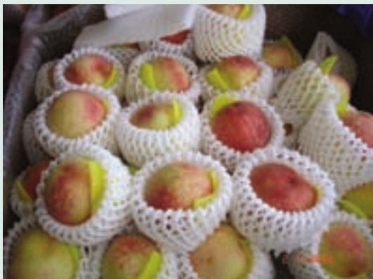
西寶農場場員種植碩大甜美的水蜜桃

20年的場員生活，稍縱即逝，回憶栽種水蜜桃的日子，全盛時期西寶地區種植面積超過百公頃。近年因為入山開