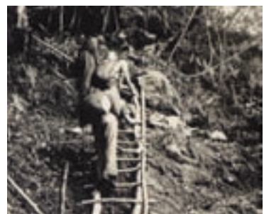
西寶農場場員早年運補糧食之艱辛作業情景