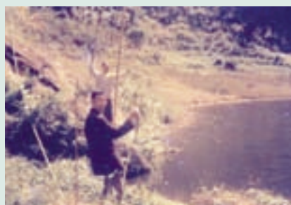
老主任委員經國先生譽為天下第一奇景－蓮花池，早年魚類資源豐富，可供應場員蛋白質食物來源