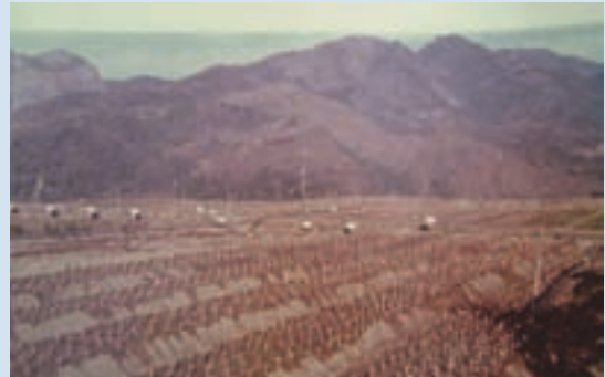
民國60年水庫興建前土地種植情形