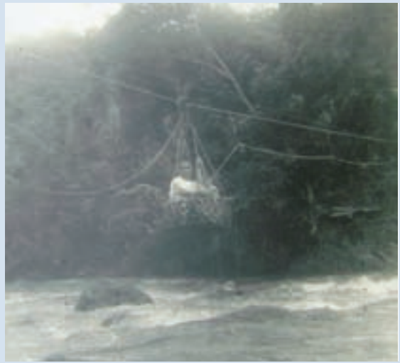
民國41年場員用吊籠過溪情形

民國41年成場時，唯一交通道路為日軍之戰備道，僅通人行。因山道崎嶇，交通困難，北由嘉義澧水入場，須翻山越嶺60幾公里，南由台南楠西入場，須涉水登山，計大小溪溝24處，全程約20公里，本場產品之輸出，日用品之輸入，均以人力取道楠西。42年至45年間，首任場長任同堂將軍號召全場榮民整修本場至楠西之道路，使可通牛車，接任之場長劉覺乙將軍再經2年努力，至47年，又將牛車道，整修為汽車便道，因之除每年雨季外，汽車均可以暢通，此路之修通對大埔鄉產品之輸出，日用品之輸入貢獻甚大，居民之生活得以改善。60年2月政府始完成碎石路面鋪設，同時興南客運開始行駛，現台三線已全部鋪設柏油路面。