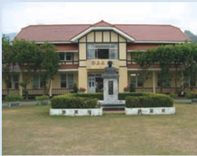
民國62年興建完成並於87年整修之現代辦公室