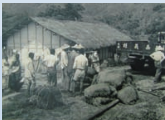
民國52年場部配發苧麻種（麻根）