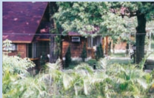
民國87年興建的「木屋」