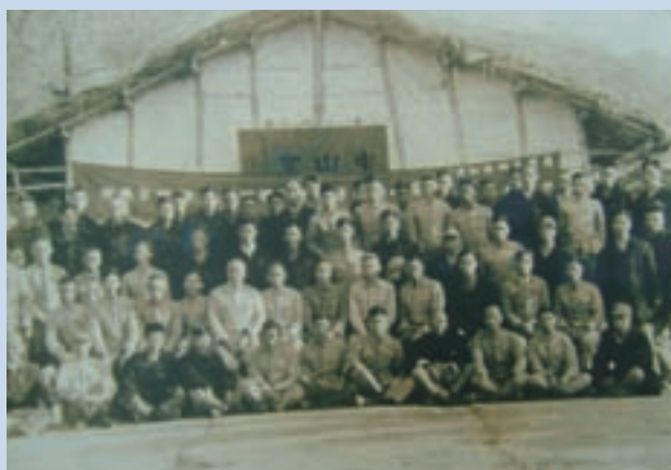
成場時（民國42年）之中山室