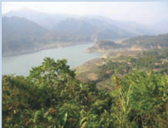
民國62年曾文水庫興建完成後的湖光山色景觀