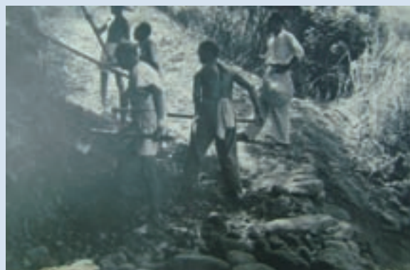
民國47年場員將牛車道整修為汽車便道情形