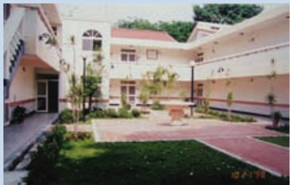
民國88年整修之國民賓館，內有52個房間供遊客住宿