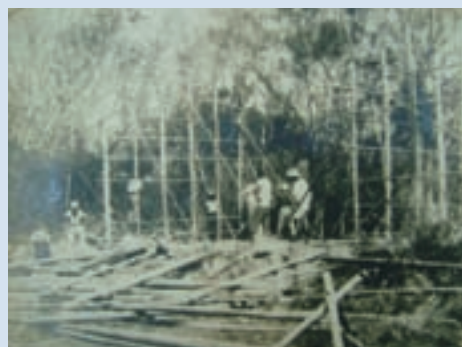
民國41年場員自建草屋情形