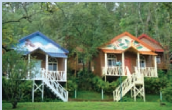
彩繪木屋 (四人房*25間)