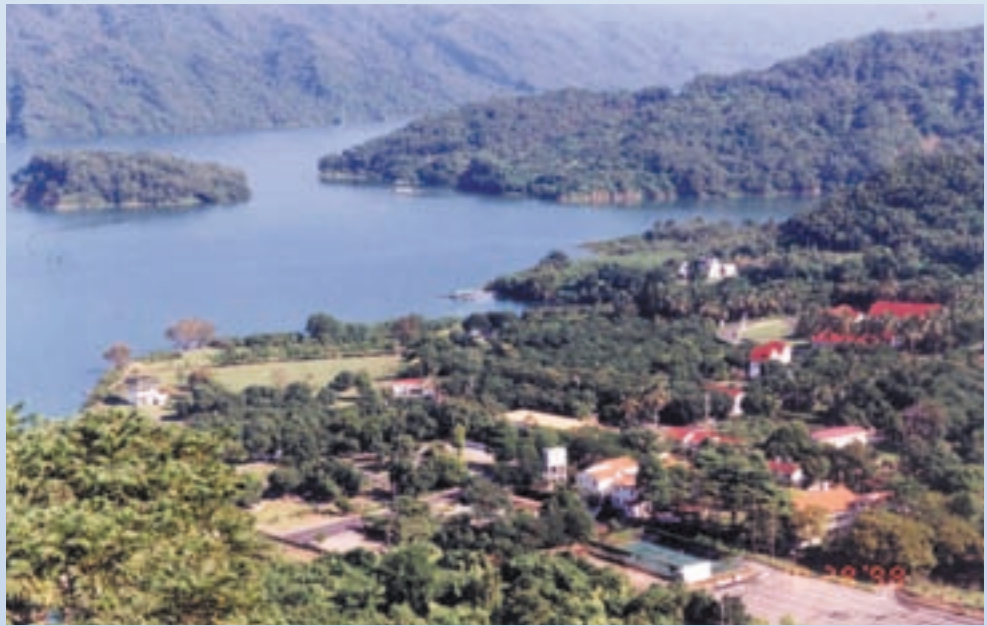
鳥瞰嘉義農場全景

曾文水庫於民國62年興建完成，68年同意曾文水庫管理局在本場興建「國民旅社」以促進觀光，本場亦於69年自行興建8家商店，配合觀光發展。75年12月本場以承租方式，收回「國民旅社」改為「國民賓館」自營，同年月由行政院國軍退除役官兵輔導委員會主任委員鄭為元上將邀請當時觀光局局長虞為先生蒞場勘察觀光計畫，於76年完成第1期觀光整體計畫，進行細部規劃設計，並於78年至84年間，由觀光局補助1億3,850萬元，省旅遊局補助5,833萬元，行政院退輔會補助1,019萬元，分期建設，完成基礎公共建設，從此奠定本場日後觀光發展基礎。85年有鑑于觀光事業之蓬勃發展，因應時代之需求，乃再次委由