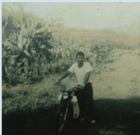
民國60年劉副技師與場部配給第一部機車

56年有一天，場長由台北回來，隔天即召開場務會報，說曾文水庫要開始施工，預定的淹沒區，應積極規劃遷莊，儘速準備相關計畫資料。同年8月，曾文水庫建設委員會邀集輔導會（含本場）及農政單位假台南農田水利會召開協商會議，後來拆遷補償也順利完成，場部往上搬遷，7個農莊實施遷莊併莊，水庫也於1973年完成，原來的辦公室、農莊房舍都淹沒在水庫內。目前的辦公室、職員宿舍、文康中心、總統行館及水庫邊涼亭，均為當時拆遷補償費建築而成。