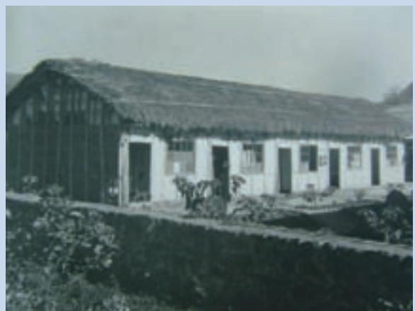
成場時（民國42年）之職員宿舍