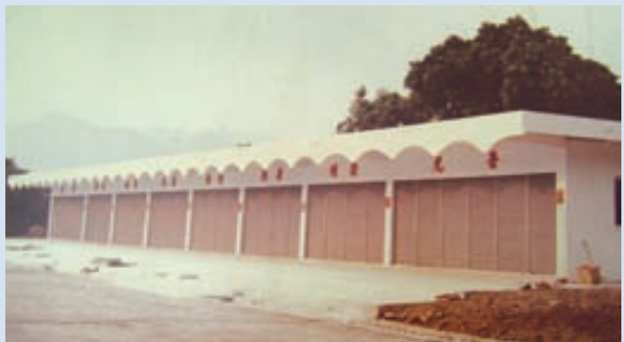
民國69年完工之八家商店外貌