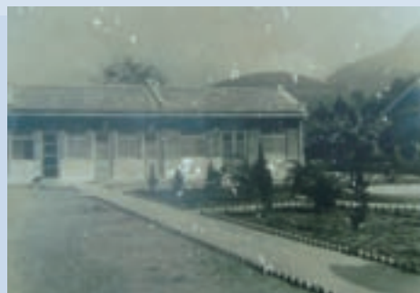
民國51年整理後之廚房餐廳