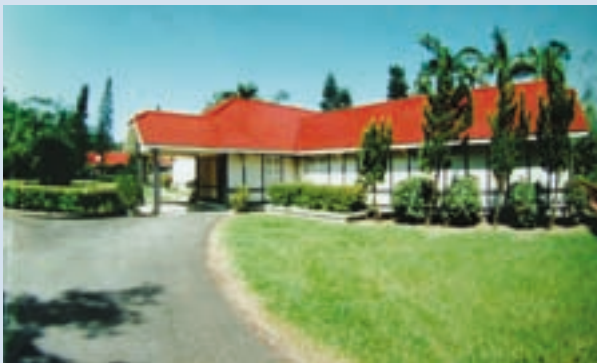
民國91年整修後之行館外觀

先總統 蔣公在世時，日理萬機，農場全體場員為感念 蔣公關愛榮民榮眷之仁厚德澤，於62年曾文水庫興建完成後，有感於水庫湖畔，山光水色，風景秀麗，頗適 蔣公運籌國事、沉思策謀或休閒，遂由時任輔導委員會主任委員之蔣經國先生多次履勘，選定現址而興建。行館內建正廳1間，偏廳3間，蔣公及夫人臥房各1間，隨扈人員房間4間，另有餐廳、廚房等，總面積531.3平方公尺（161坪），總經費115萬元。該行館歷經10個月興建完成，惜因 蔣公憂心國事，積勞成疾，終未能蒞臨，惟前總統 經國先生於63年任行政院長時，曾二度蒞臨巡視，另前總統 登輝先生於73年任副總統時亦一度蒞臨。