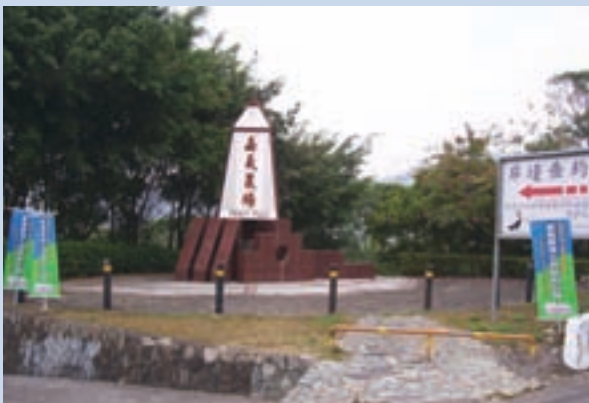
民國81年新建之嘉義農場路口地標位於台三線349公里處