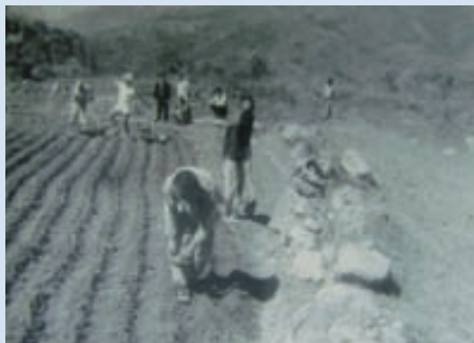
民國41年荒地開墾種植情形

(五) 59年，除維持種植木薯、麻竹及果樹外，為配合曾文水庫興建及日後集水區水土保持考量，逐漸廢除短期作物，逐年淘汰木薯，改種長期果樹，著手研訂本場重建4年計畫，以建立現代化觀光農場為目標。