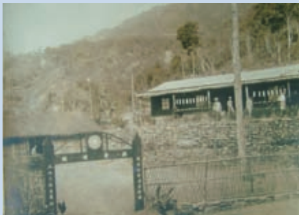
民國57年修建之場員第18農莊