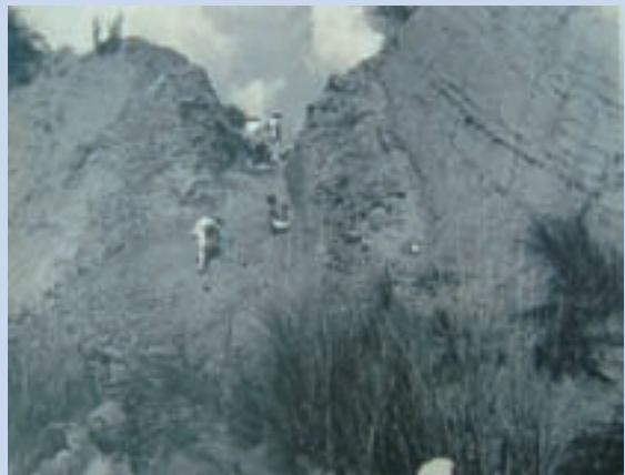
民國41年場員自力修築牛車道情形