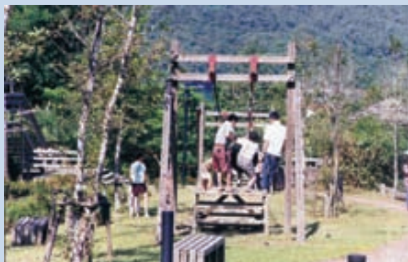
民國87年興建的「兒童遊戲場」