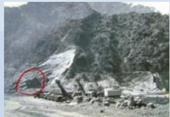
民國60年水庫施工情形（圈紅處為爆炸開鑿點）