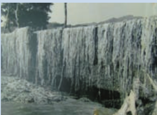
苧麻經過暴曬後製作麻繩之材料