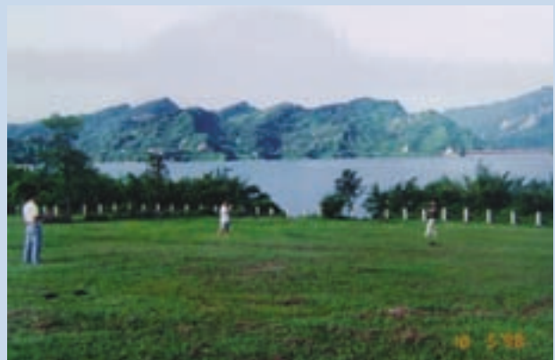
場區濱臨曾文水庫，山明水秀，景色宜人（攝於民國85年）