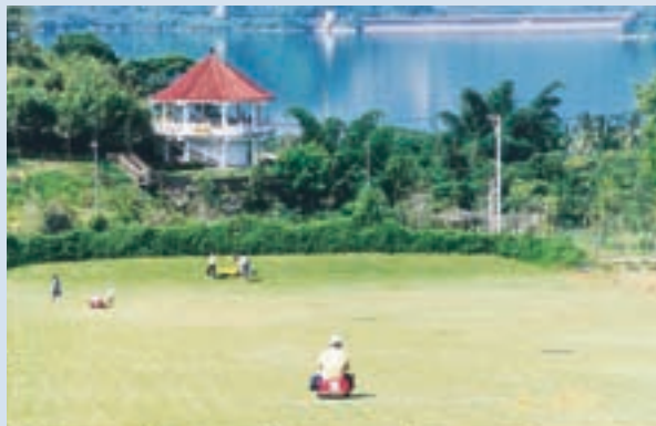
民國81年興建農場遊憩設施之滑草場