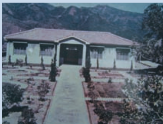
民國51年場員入場整建後之辦公室