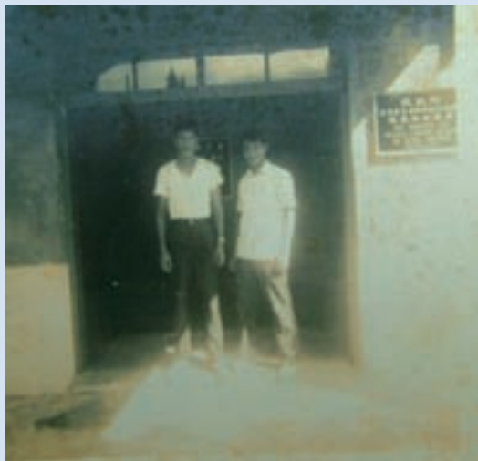
民國43年修繕後之辦公室

本場場區位於嘉義縣大埔鄉西興村糠榔埔（又名馬場，即日據時代日軍養馬的地方），民國41年11月16日奉國防部（41）茂藝字第0025號代電核定，於41年12月16日成立，定名為「嘉義大同合作農場」，隸屬於國防部，行政業務由國防部總政治部督導，場部於42年1月2日由嘉義遷至大埔村辦公，至43年1月13日馬廠房舍完成始進駐辦公。43年12月1日奉命改隸於行政院國軍退除役官兵輔導委員會管轄，45年9月1日本場奉命委由台灣省合作事業管理處經營，並受合管處管轄，仍隸屬於輔導委員會，唯其業務及行文系統，報由合管處核辦及核轉，本場更名為「台灣嘉義大同合作農場」。51年9月11日本場復奉命自51年7月1日起由輔導委員會直接管轄，業務由輔導委員會就業處督導，名稱改為「嘉義合作農場」。58年11月1日本場名稱奉改為「嘉義農場」取消合作二字，沿用至今。