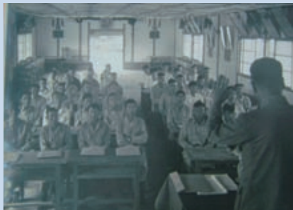
民國57年農莊幹部訓練情形