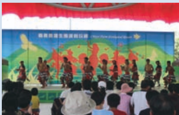
遊客觀賞原住民表演