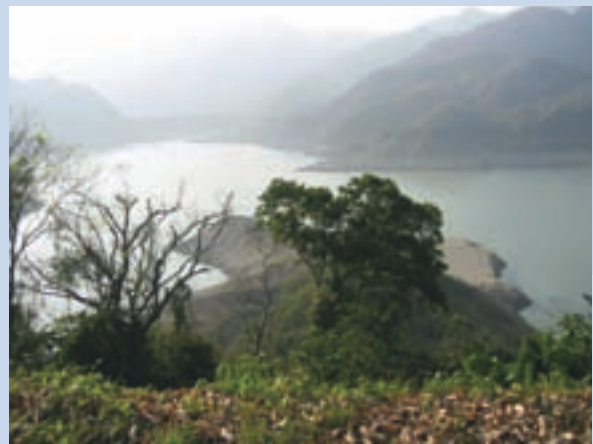
民國62年曾文水庫興建完成後的湖光山色景觀