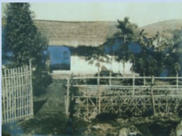
成場時（民國42年）之辦公室