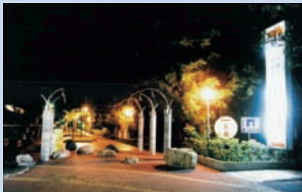
民國87年整修完成之嘉義農場幹道夜景