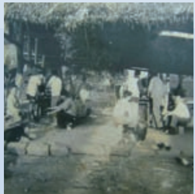
民國42年場員農耕休息時之情景