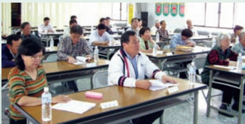
民國95年行政救濟實務講習實況。

為因應民國94年12月30日修正發布之國軍退除役官兵就養安置辦法將就養審核權限下授各榮服處、榮家後，各榮服處、榮家須立於處分機關之地位，辦理訴願、行政訴訟答辯等行政救濟事宜，屆時恐因承辦人員未嫻熟相關行政救濟事務，致影響人民權益及本會依法行政之形象。