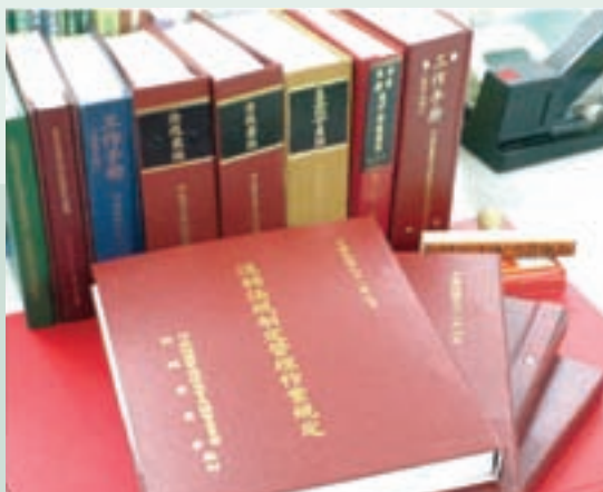
為因應行政程序法，法規委員會編訂退輔法規制定管理作業規定以供同仁參考。

行政程序法歷經學界與實務界的長期努力，自民國88年2月3日公布，90年1月1日施行迄今，行政機關透過公正、公開、參與等民主程序，一方面確定行政行為之形式合法性，使得憲法所保障人民之程序基本權得以實現，另一方面在兼顧行政效能下，增進人民對行政的信賴，以符合實質法治國原則。