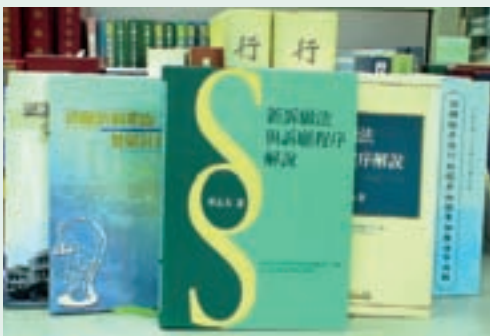
民國89年7月1日新訴願法之施行。

為因應法制作業之革新及依法行政之需要，有關本會業管之法規命令及行政規則，法制人員應主動參與並提供意見，以求研擬之法令適法、妥當、可行。有鑑於此，法規委員會自整合成立專責單位以來，遂步落實本會法規命令之研擬、審議(查)及彙整程序，使業管單位能依照程序發布法令，提昇法制品質，確保榮民權益。