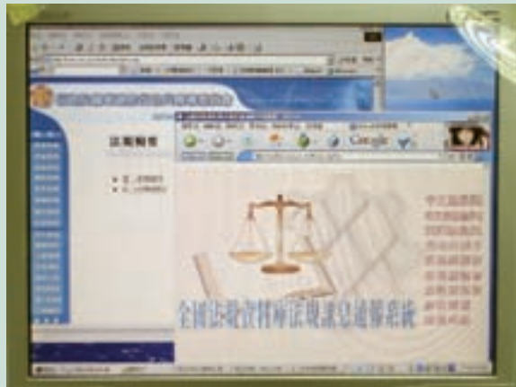
本會法規輯要網站及通報全國法規資料庫系統。

有關全國法規資料庫通報系統之作業部分，本會係由業管處室擇定專責人員負責辦理，每月法規異動結報之月報部分則由法規委員會負責。因月報係依據業管處室當月通報成果加以統計，如業管處室未依規定確實通報，法規委員會即難有正確之資料加以綜整，且因部分單位未依規定於法規發布3日內及行政規則發布或下達5日內辦理通報，以致本會法規異動通報及月報數目未臻確實。法務部全國法規資料庫工作小組於民國93年3月25日蒞會進行實地查核工作，針對本會法規通報工作提出查核意見。為檢討作業缺失，自93年5月1日起法規通報作業改由法規委員會主政，惠請業管處室發布或下達(含訂定、修正、廢止及停止適用)法規命令或行政規則時，均應將發布令、下達函連同法規或行政規則條文通知法規委員會，俾利辦理通報作業，至於每月法規異動結報之月報工作，亦由法規委員會會請各處室統計後辦理通報。