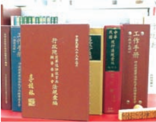
法規委員會負責本會相關法規案件之審查。

法規委員會前身為依民國61年7月24日(61)輔人字10769號令所訂定之本會法規審議委員會組織規程所成立之「法規審議委員會」，負責本會相關法規案件之審查並逐步落實相關法制工作，69年9月24日首次以委員會形式，召開法規審議會，由當時韋副秘書長德懋任法規審議委員會召集委員，審議之內容為國軍退除役官兵輔導條例第17條修正草案。