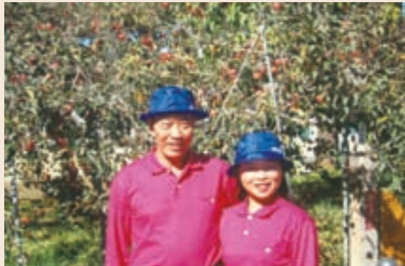
蔡專門委員伉儷攝於本會福壽山農場蘋果王果樹前。

蔡專門委員平日喜愛慢跑運動，最近曾參加2006年太魯閣國際馬拉松路跑賽，以1小時55分跑完21公里半程賽，展現無比的耐力。在本會任職期間，一向就是本著跑馬拉松的工作態度，辛勤的耕耘，無論是負責公務預算或基金預算，均能適時適切的支援本會服務榮民的四大主要工作－就學、就業、就養、就醫。其所累積的成果，就像上圖所示：福壽山農場的蘋果王－結果累累。