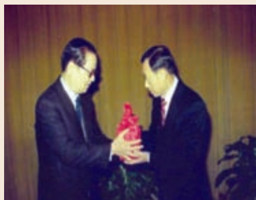
段會計長(圖右1)接受印信。

先生任職期間，積極爭取調整安養榮民生活給與由76年度每人每月2,878元至78年度調增為每人每月5,078元，值得一提的是每半年調整一次，77和78二個年度共調整四次，並配合政府開放大陸探親政策，籌募旅費5億餘元，協助二萬多位榮民達成返鄉探親心願。