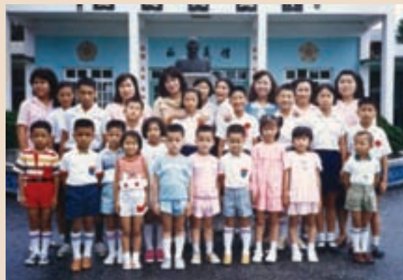
設於台東的「慈母育幼院」師生合影。

85年「兒童福利法」頒行，中央主管機關為內政部，慈母育幼院階段性任務完成而裁撤。期間歷經35年，培育無數院童，散布社會各角落，貢獻心力。正是：育幼慈暉，永照人寰。