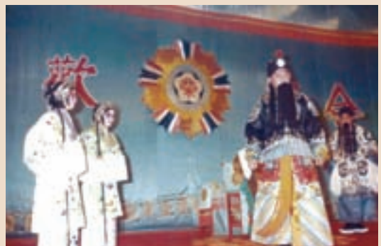
榮光國劇隊公演劇照。

70年代，台灣經濟起飛，電視機普及，提供國人更多元的聲光娛樂，「文化工作大隊」巡迴「寓教於樂」的舞台歌舞表演與電影放映功能式微。遂於61年12月1日文化工作大隊改組為「榮