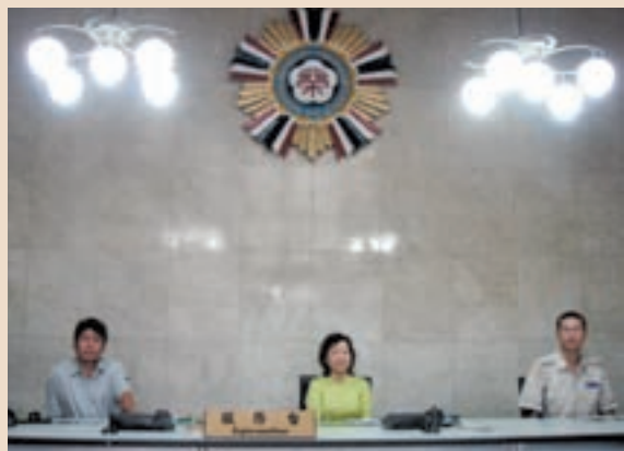
輔導會服務台受理榮民（眷）服務。

82年1月1日「立即處理組」裁撤，原編組人員隨同業務職掌調整，暫派「第一處立即處理組」服務，目前工作人員2人，賡續為洽公榮民（眷）服務。