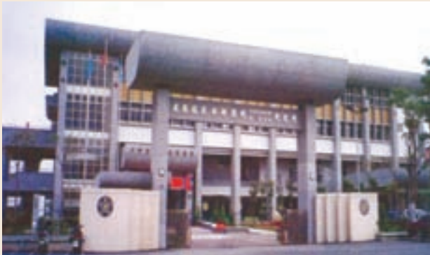
巍峨宏偉的桃園縣榮民服務處。

各縣市自謀生活榮民聯絡中心，係民國47年10月1日成立台北榮民服務處、台中（轄苗栗縣、台中縣市、彰化縣、南投縣、雲林縣、嘉義縣、澎湖縣等8縣市）、台南（轄台南市、台南縣、高雄市、高雄縣、屏東縣等5縣市）、花蓮（轄花蓮縣、台東縣等2縣）等4個聯絡組演變而成。