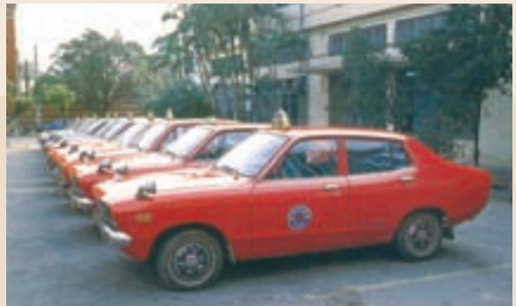
早期榮民計程車外貌。

目前榮車中心位於台北市榮民服務處，員工52人，均屬約僱，非公務人員，分處七個分中心：榮車中心採共同管理、個別性經營方式(車輛為榮民業者所自有)，自給自足，自負盈虧。