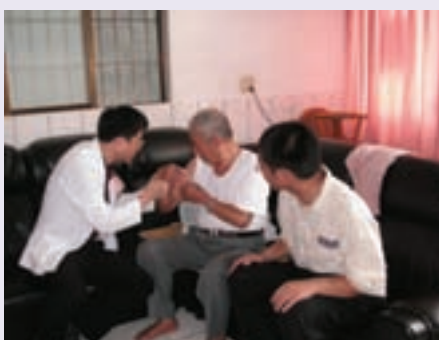
灣橋榮院實施居家護理實況之一 (95.4)