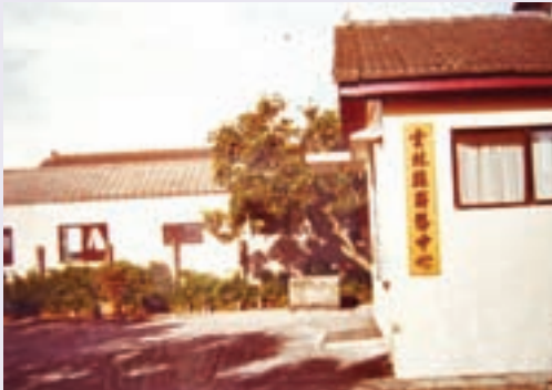
雲林縣聯絡中心－舊辦公室（75.6）