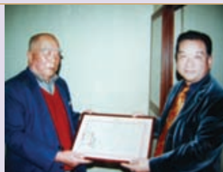
頒發榮民高魯惠服務績優獎狀（90.3）