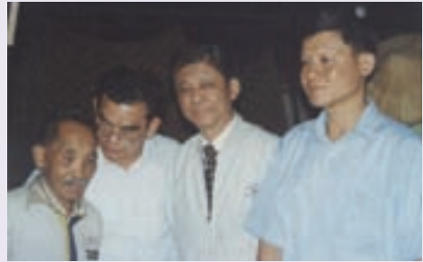
宮先生（右1）陪同第一處韋處長探視特需照顧榮民（90.6）

在榮服處任職期間，宮先生所欣喜的並非榮譽與獎勵，而是他實際上能夠在工作領域得到的「活到老，學到老」。服務機構是個考驗人性的大教室，亦是個修心養性的人生道場，他從中獲得許多生命的憬悟，也吸引他不斷認真探索生命的奧秘，不斷滿足自己的求知慾，他學的越多，越覺得自己的渺小；在他的身上，我們得到最好的印證「施比受更為有福」；宮先生更讓人嘆服的是他平易近人，努力不懈的精神，在他擔任服務處副處長期間，他仍然每天認真的思索著如何精進服務工作，他說：「我覺得榮民們像是一本本寫滿生活哲理的書，因為工作關係而接觸到各類有豐富生命歷史的人士，聽著他們敘述走過的軌跡，也許有著與我相同的經歷，卻也常常蘊藏原本不知的許多事務，而一段段不同的見聞，增長了自己更多的閱歷。」而這些也就成了宮先生工作動力的來源，宮先生以服務最樂的典範，再創生命的高峰，帶給人們如春風般的和煦與舒暢，一如春風，一如春風……。