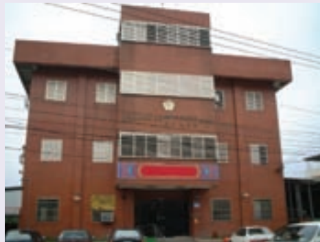
雲林縣榮民服務處－新辦公大樓（93.8）

民國47年輔導會有感於國軍袍澤捍衛疆土，為國一生戎馬沙場，退休後正值壯年，極需政府關懷照顧，遂於47年10月1日，假雲林榮家成立「中部地區自謀生活輔導組」，負責苗栗、南投、台中（縣）市、彰化、嘉義、雲林等7縣市榮民輔導服務工作。