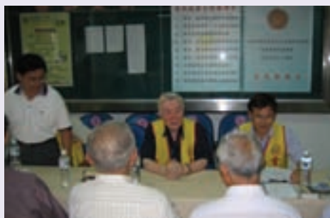
本處於成大醫院斗六分院設置之服務台（94.10）

因應雲林地區狹長地形及遵奉高主任委員服務理念，於台西、四湖、東勢等鎮，設置服務點，除便利偏遠地區榮民洽辦事務外，更代表服務處服務工作深入基層的決心。再因本縣無會屬榮民醫院，使轄區榮民無法享受與其他縣市同等的醫療資源，經過本處不記名電話調查榮民就醫狀況，以前國軍斗六醫院（現為成大斗六分院）就醫人數最多，為能有效服務榮民，遂與該院協調並獲熱忱支持，於該院設置服務台，提供榮民即時之服務。