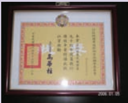
民國94年服務機構評比績優獎狀

依本處史績資料及資深的服務人員轉述：自民國68年以來，服務處在全體同仁辛勤努力之下，陸續獲頒各項督考獎項，當時在服務機構丁級類型評比成效，服務處一直居於翹楚。更難能可貴的是，除了有員工獲得中央機關美展評比第1外，更有榮譽亦得此殊榮；常於月會上，看到歷任首長滿意的微笑，這也無形中成為服務處光榮的史績紀錄。