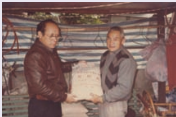
圖為賀先生為榮民（眷）爭取救濟物資，親自發送及與榮民合影留念（78.12）

好景不常，賀先生晚年因身體狀況日漸衰退，89年更因操勞過度，中風臥病在床，家人原已不報任何痊癒的希望，但老天爺總會庇佑好人的！也許是不忍賀先生尚未享受天倫之樂及含飴弄孫的日子，以及妻賢子孝、積德庇蔭的緣故，在家人無微不至的照顧下，賀先生如同奇蹟般的復原。這證明了古人常講的一句話：「舉頭三尺有神明」，千萬不要「勿以惡小而為之，勿以善小而不為」，好心終究會得好報。