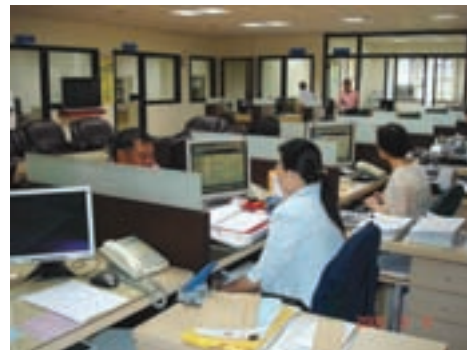
辦公處所改善後現況（95.6）

隨著榮民人數增加，服務需求提高，復於49年7月1日更名為「雲林縣自謀生活退除役榮民聯絡中心」，仍兼辦南投縣業務，51年8月23日續更名為「雲林縣自謀生活退除役官兵聯絡中心」，繼續兼辦南投縣業務；期後再因榮民人數及服務需求及兼顧7縣市服務品質，於57年8月26日第3次更名為「雲林縣聯絡中心」，76年8月16日最後一次更名「雲林縣榮民服務處」迄今。