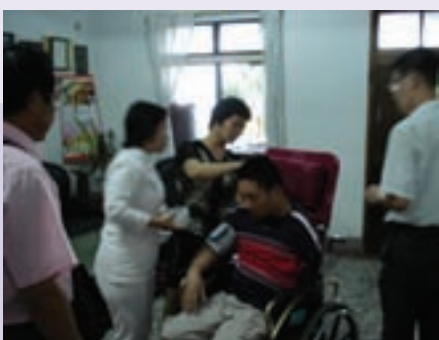
灣橋榮院實施居家護理實況之二 (95.7)

積極協調雲林縣老人福利保護協會、雲林縣長期照護協會及灣橋榮民醫院提供本轄特需及較需照顧榮民，「免費送餐」、「居家訪視」、「居家服務」、「居家護理」等服務照顧工作，並每周二、四於成大醫院斗六分院設置服務台，服務來院門診、就醫之榮民(眷)，獲得榮民高度的肯定與嘉許。