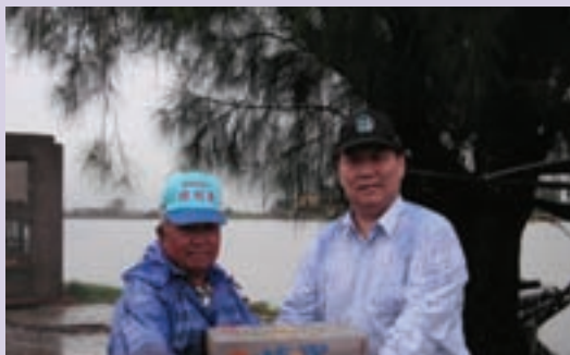
民國95年6月9日水災盧處長親自救災與賑災之一