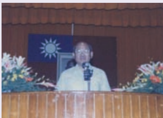
於榮民節大會報告防騙心得（86.10）

也許，老天疼憨人；也許，蔡先生就是老天派下來的守護神；他的精神讓我們看到一位不老、不凋、不懈的榮民榜樣，將會永遠留在後代子孫的心頭，留名青史。