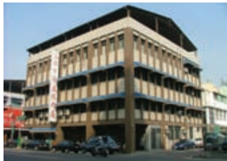
高雄市榮民服務處辦公大樓自強二路門面 (94.11)

惟鑑於近年來輔導照顧工作受「人口結構高齡」、「社會福利多元」、「家庭功能式微」、「兩岸關係侷限」等因素影響，整合高雄地區會屬機構運作模式日趨重要，同仁均以積極之態度，攜手齊心協力再創新局，以彰顯永續服務照顧之功能。