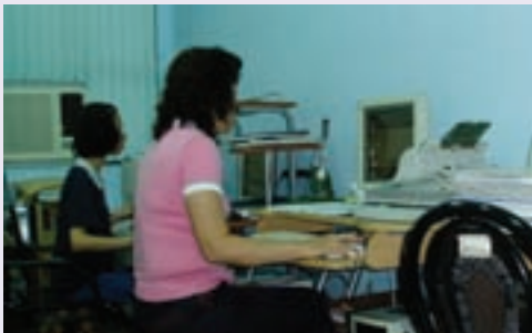
文書室執行檔案回溯及公文電傳作業 (91.3)

輔導會對落腳高雄市榮民眷之服務照顧需求極為關切。早在民國47年9月24日即成立「高雄地區輔導組」，當時業務由「楠梓榮民醫院」兼辦，辦公處所則先後設置於楠梓榮民醫院、鼓山三路108之34號、河北二路154號、鼓山一路139號、七賢一路17號、十全一路367號等處址。