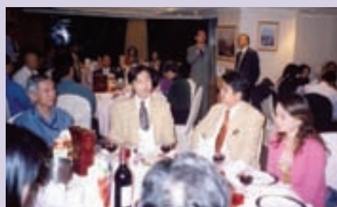
楠梓加工區陳副處長出席就業餐敘，代表貴賓致詞（95.9）

95年度「榮民生涯輔導與就業媒合活動實施計畫」報准增開具競爭力之教育班次，將有限人力經費作充分發揮。由於地方政府、工商團體之配合，整體就業輔導績效均能勉力達成，以94年度為例，完訓榮民眷635位，推介榮民眷就業415位，達成率為102%，超越會訂目標，經評比就業總成績居22個服務機構之首。