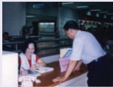
駐榮總服務台接待榮民，受理就醫相關問題 (93.6)

復於94年7月獲軍方支持，配合在左營國軍醫院設置服務台。經累計年度派出輪值服務員工、志工逾六百餘人次，服務接待含榮民眷及一般民眾合計22,380人次，對象涵蓋南部各縣市，成效顯著，普獲榮民、榮眷正面肯定及認同，除現場說明給予解決外，餘均取回本處交承辦人員簽處，並將辦理結果回覆當事人。