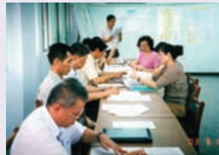
蕭前專員（左4）認真與同仁研討會議資料（91.5）

蕭前專員於78年8月31日進入本會楠梓榮民醫院擔任輔導員職務，83年5月1日奉調本處擔任輔導員，並於85年7月調升專員，於94年7月16日因人生另有規劃，自請退休獲准。蕭前專員在本處任職期間工作主動積極，即使擔任多重業務角色，但其所投入之心血，並未因而有所差異，諸如辦理春節榮民聯歡活動、兼辦人事、總務負責採購、修繕工程等工作，均不遺餘力榮獲獎勵，是不可多得的優秀公務員。蕭前專員尤其自律自重，是位完美主義者，常有己達達人夢想，服務期間最值得記憶的是他完全出於自發性，於90年6月間，開始成立兒童美語班，並由自己親自教學，這種十年樹木、百年樹人的偉大情懷，確實難能可貴，誠屬蔚為風氣之先，從今爾後，應可做為各榮民服務處及會屬機構學習的典範人物。