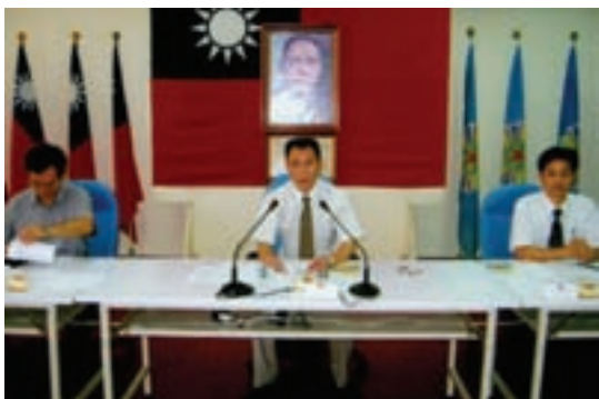
張處長指導舉辦榮民分區座談會（95.8）