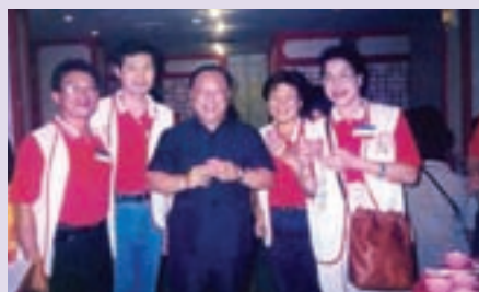
張處長（中）與志工合影（85.6）

84年6月為因應本會調整政策：「外住就養榮民原由榮家負責，調整改由各榮服處服務照顧。」在張處長精心規劃下，將全市11個行政區依本市榮民分佈狀況，劃分為7個責任區、29個服務區，並編成1096個生活互助小組，以運用綿密之體系及榮欣志工人力，迎接新的任務與挑戰，其才幹與績效普獲肯定。86年7月外調本會「魚殖管理處」處長，任內躬親督導產銷，開拓周邊產業，全面提升業務績效，惟以推行「民營化」政策之故，復於單位裁撤後，調任花蓮自費安養中心主任，迄94年退休。