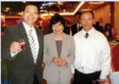
章處長（右）偕葉代市長出席歲末圍爐（95.1）

回顧大高雄迄今仍為國防戰略要域、國際海空交通樞紐、南台工商經貿重鎮，官兵退伍後多數就地創業落戶，歷年來設籍高雄市之榮民，集自律守紀、勤奮、節儉之習性，經本處歷任首長領導之團隊輔導安置，與在地同胞共同促進「港都城市繁榮」，協力創造「國家經濟奇蹟」和諧經營，已充分達成本會設置之任務與目標。