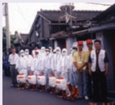
眷村全面防疫消毒—抗SARS總動員（92.5）

93年4月24日SARS防疫狀況提升為A級，SARS防疫機制再度啟動，本處再度編組，服務人員進駐小港機場，針對入境榮民協助執行健康管理、安置、隔離等檢疫防疫工作，直至疫情獲得全面控制。