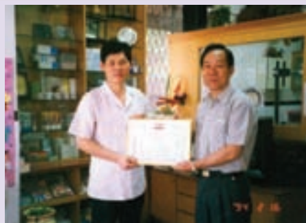
高處長（右）頒狀感謝支援義診醫師（94.2）

高處長學養豐富、經歷完整、任事負責，不論服務軍旅或調任本會職務，均因績效卓著，深得各級長官肯定及部屬之愛戴。高處長任本職期間，積極改善硬體設施，營造良好之工作環境，並嚴格要求依法行政，尤以單身亡故榮民善後事宜必一絲不苟，89年1月1起建立檔案管理，落實文卷歸檔，勤訪基層足跡遍及高市每個角落，充分瞭解榮民眷之需求，及時協助解決，深獲榮民眷之讚揚。92年12月2日榮調「楠梓榮民自費安養中心」主任，94年即通過ISO服務品質驗證，領導與才能展現無遺。