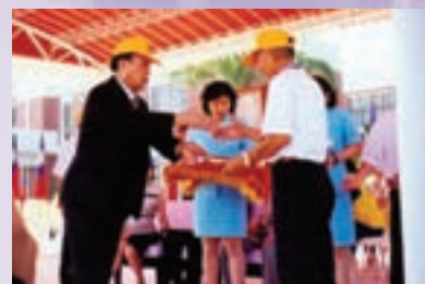
宋處長（左）於榮民節表揚模範榮民（87.10）

宋處長就任新職後，即訂定培養團隊精神等多項工作重點，作為努力方向，並與全體員工共勉，積極為榮民袍澤爭取權益與應有尊榮。任職期間，以工作紀律提升員工同仁良好績效，以熱誠服務凝聚榮民榮眷向心，87年因辦理互助組長新春聯誼獲服務機構評比為優等單位，88年1月宋處長榮調「岡山榮家」主任並於90年退休。