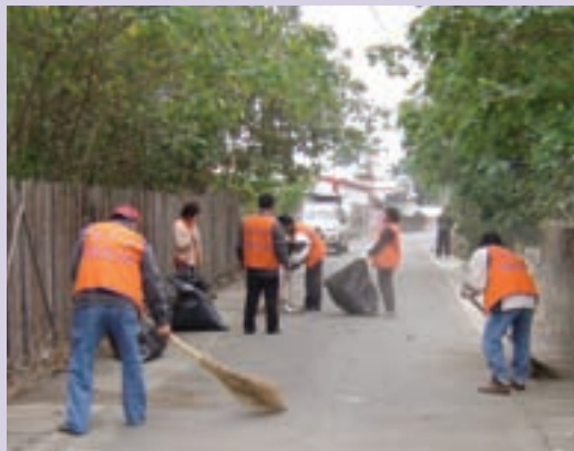
榮欣志工協助居家打掃環境 (95.3)

有效運用熱心服務之榮民（眷）人力資源，參與志願服務工作，照顧獨居年長榮民及遺眷。本處目前已編成3個志工中隊，招募志工77人，平日除協助所屬責任（服務）區就近探視特（較）需照顧榮民外，並不定期赴榮民住處協助整理環境及居家服務。為做好敦親睦鄰，建立和諧關係，並配合馬蘭榮家與台東榮民醫院，成立「馬蘭健康社區」以落實推展社區服務工作，頗受好評。