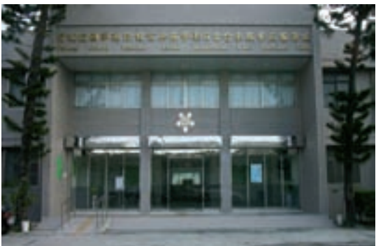
台東縣榮民服務處現今辦公大樓（95.10）