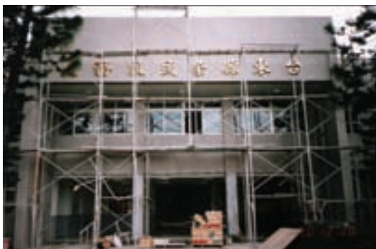
台東縣榮民服務處辦公大樓整修（90）