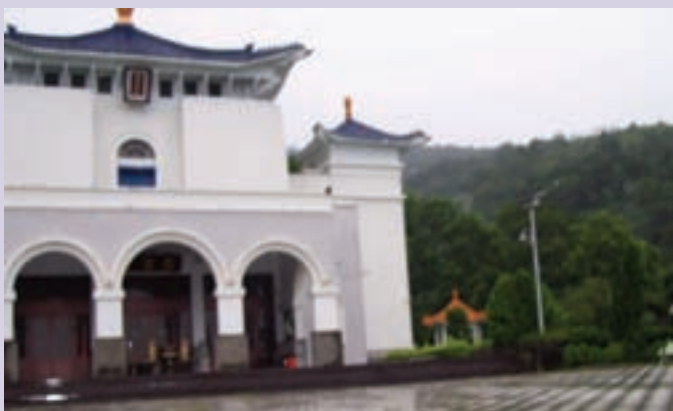
台東縣軍人公墓現地景觀（94.6）

依輔導會指示，本處協調辦理本會太平、岡山、台北、屏東等四個榮家，早年「亡故榮民骨灰」遷厝事宜，委由台東縣政府發包中心，於民國94年6月8日完成骨灰櫃發包作業，總工程價款為新台幣一仟萬元整。 全案工程已於94年8月16日完工，依規定驗收，本處為遷厝作業協調單位，計於94年9月至10月間，完成太平榮家607具、岡山榮家536具、台北榮家1226具、屏東榮家1914具骨灰（罐）遷厝至「台東縣軍人公墓」永久安厝，順利完成遷厝任務。