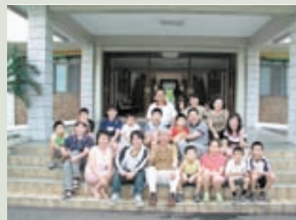
民國95年譚主任（前排中）與參加「親子活動」員工子女合影