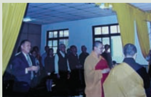
王主任（左1）參加榮家佛堂開光啓用