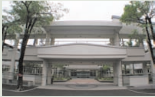
博愛堂整修後之外貌