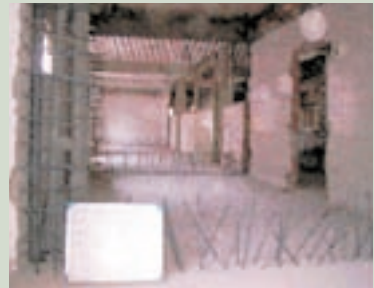
仁愛堂二樓剪力牆植筋

本榮家養護堂因受「921大地震」之影響，部份樑、柱、牆壁發生裂痕，十分危險，為顧及養護榮民及工作人員之安全，民國92年依計畫實施「仁愛堂及復健中心耐震補強工程」，工程於93年3月17日公開招標，由「統冠營造股份有限公司」以2,456萬元整得標，3月23日開工，履約期210個日曆天，由設計、監造建築師及本家督導委員監督施工下，同年10月18日完工，12月1日驗收合格，有效提昇養護榮民居住安全。