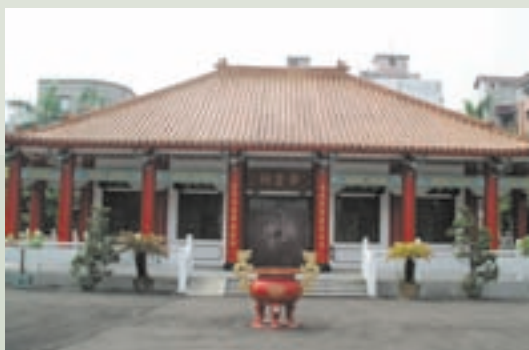
20年前所蓋之榮靈祠

為使榮民勳業永垂不朽，及本榮家歷年亡故榮民有所奉祀，民國73年計畫興建「榮靈祠」，幾經籌措，於75年5月1日開工，同年10月31日落成啟用，榮靈祠本體採宮殿式建築，配以涼亭、花園、石桌、石椅、棋台，美輪美奐，古色古香，不僅亡故榮民靈位可以奉祀，且可供榮民憑弔袍澤、老友，安撫榮民心靈，亦兼具美化家區環境，擴大榮民休閒空間，本榮家每年定期祭祀，表達慎終追遠之美意。