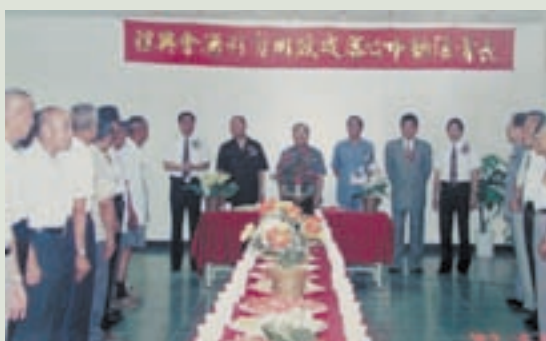
民國86年王主任（中立者）主持長青活動中心開幕啓用