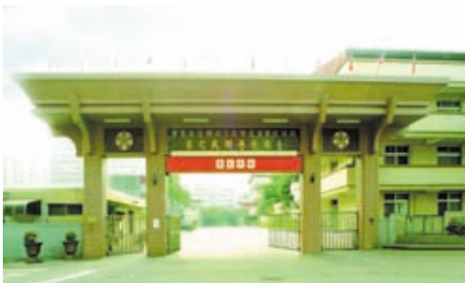
民國74年新建之崇明路大門