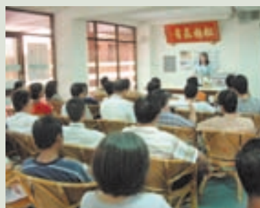
為照顧服務員作訓練講授（站立者）