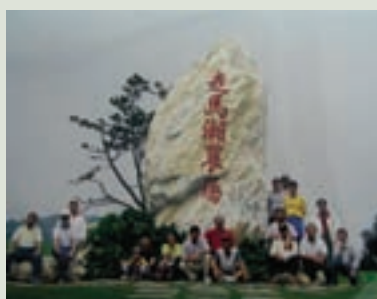
梁主任（前排左2）率榮民赴走馬瀨旅遊