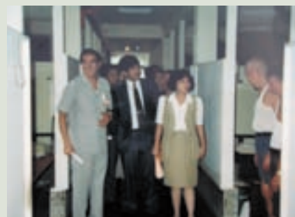
張主任（左1）陪同行政院研考會巡視榮民宿舍