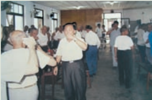
民國81年徐主任（左2）參加榮民慶生餐會