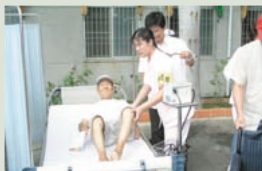
參與災害防救演練擔任緊急救護工作（左2）