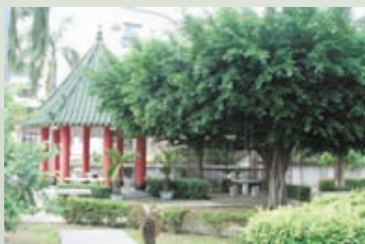
榮靈祠周邊之美麗花園