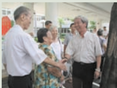
民國95年譚主任（右）慰問日間照顧長者

任內重要工作：95年9月5日完成榮靈祠整修工程，95年12月27日完成博愛堂及廚房屋頂防漏工程，95年12月27日完成亡故榮民土葬墓園工程，95年12月31日完成醫療器材（電動按摩椅）採購10張發各堂榮民使用，95年4月25日安養堂榮民餐廳完成冷氣機安裝7台，96年5月11日完成養護堂榮舍安裝冷氣機15台。