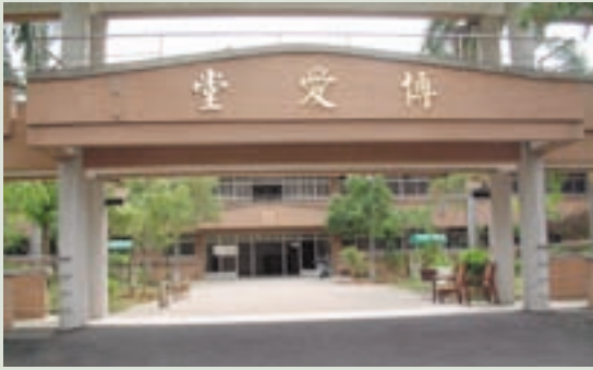
博愛堂整修前之外貌