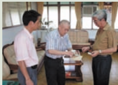
依法辦理亡故榮民遺產繼承發還作業 (中立者)

在家排行老大，另有一弟二妹，因嚮往軍旅生活，也為減輕家中負擔，高中畢業後投考陸軍官校第35期，畢業後服務軍旅10年，深感年青一輩需具備簡單軍事常識，故轉任軍訓教官，從事教職。服務12年後，78年機緣轉任公務人員，進入台南榮家服務，迄今已有15年之久，80年因罹患迴腸動脈阻塞及出血性腦中風而導致雙腳膝蓋以下截肢，靠義肢行動。為了不要成為家人的累贅，只有以堅強的意志力來適應生活起居，在工作上以敬業樂群，奮發向上的心情來協助榮民長輩達成他們落葉歸根，長期居住大陸的心願。以認真負責的態度來維護榮民先進的權益。