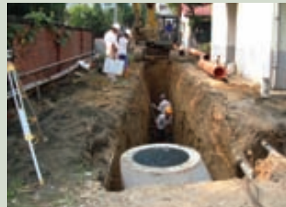
污水處理場污水管路開挖埋設