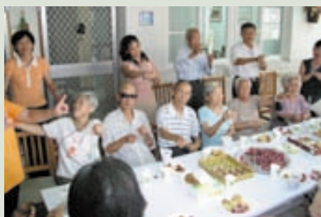
與日間照顧長者同樂（左5）