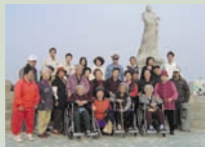
張主任(後排右4)帶領日照長者戶外教學