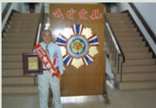
當選台南市民國93年身心障礙就業楷模