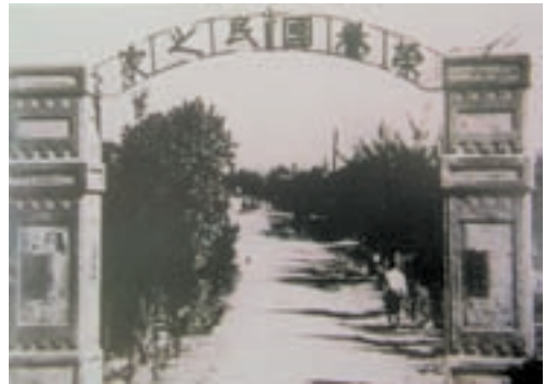
民國42年成立時「榮譽街」大門

83年12月1日精簡人事室、會計室為人事管理員及會計員，裁撤政風室，業務改為兼辦，84年4月1日調整榮民服務照顧方式，外住榮民改由各縣、市榮服處照顧、服務，89年遵奉政府事務勞力委外規定，警衛委由民間保全公司負責，伙食委由食品公司炊爨作業，92年1月1日輔導會為落實政府員額精簡政策，全面凍結工友職缺，出缺不補，預算員額調整為職員39員，工友100員（含技工10員），以落實榮民服務照顧工作。