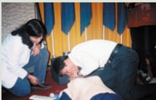
教導員工心肺復甦術（左1）