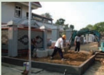
污水處理場門前景觀工程施工

88年4月28日完成公開甄選「污水處理場及衛生下水道工程」建築師，由羅燦博建築師獲得設計、監造資格，民國90年4月13日公開招標，由「昇邦營造股份有限公司」以5,170萬元得標，編組施工督導小組，每日監督施工，填寫監工日誌陳核，並依工程進度，分段查驗施工項目及進度，合格後支付工程款項，90年12月24日完工驗收，家區排放水已符合國家環保衛生要求。