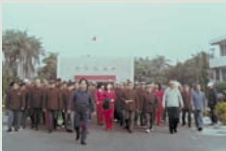
夏主任（前行者）率榮民出發健行