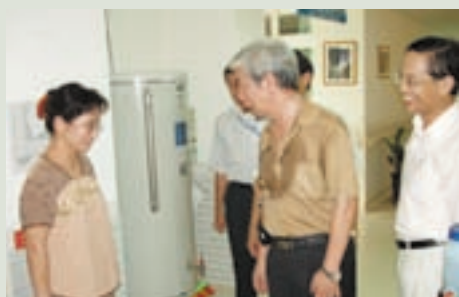
向譚主任簡報日間照顧情形（左）