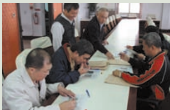
主辦大陸長居榮民手指紋驗證作業（左前立者）

古人說「活到老，學到老」為達成終身學習的理念，增進工作的專業能力，忍受肢體的不便、心情上的壓力，參加長榮大學「社工學士學分班」的進修，利用公餘之暇，參加救國團社會教育「人際關係」班研習，期能對工作上有所幫助，並加入「基督教頌恩教會」志工服務，期望以平安喜樂的見證，來影響周遭的朋友，讓他們真正體會到「健康常在，障而無礙」的真諦，也將耶穌基督博愛的精神，發揚光大，以愛心、耐心、熱心的工作態度為榮民服務，使這些少小離家，無依無靠之先進前輩，安享晚年。