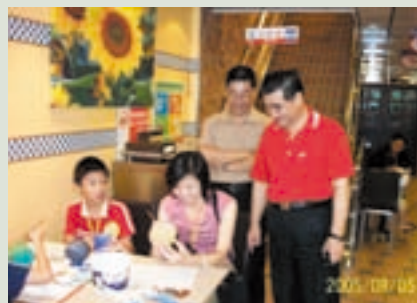
參加榮家親子活動（左立者）

及防疫工作，92年SARS高峰期間，積極主辦防疫工作，訂定榮家各項防疫計畫，並籌措管理各項防疫物資設備，經常不辭辛勞犧牲假期，辦理防疫工作，使全家區均未有任何疫情發生，因防疫表現優良，除記功獎勵外，並經輔導會核頒獎狀以茲鼓勵。榮家服務期間工作任勞任怨認真負責，推動各項業務計畫縝密，積極主動，使各項績效良好，雖然到榮家僅約五年，與其他資深人員相比毫不遜色，深獲長官肯定與激賞，獲單位薦報行政院93年度模範公務人選選拔，殊屬不易。目前工作中總覺得專業學養尚有不足之處，93年考取雲林科技大學「環境與工業安全」研究所攻讀碩士班。目前正積極學習之中。未來將貢獻所學服務榮民、社會、國家。