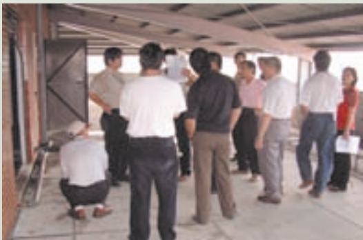
養護堂熱水沐浴鍋爐管路更新

本榮家成立迄今已50餘年，家區給水管路均已老舊，經常發生漏水、堵塞及水質不佳等情形出現，造成榮民生活品質降低，形成資源浪費，基此陳報改善計畫，於民國93年12月15日開始實施建築師甄選，由「莊惠名建築師事務所」取得規劃、設計、監造資格。94年初開始規劃、設計、提報，不斷修改計畫內容後，終獲審查通過，同年5月13日依政府採購法完成工程發包，由「和山水電工程有限公司」以1,797萬元得標，同月26日開工，94年10月29日完工，施工期間接受輔導會工程稽核小組實施查核，成績84分名列甲等，完工驗收後對水質改善，榮民用水，效益甚大。