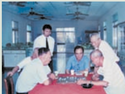
張主任（中坐者）觀看榮民象棋比賽