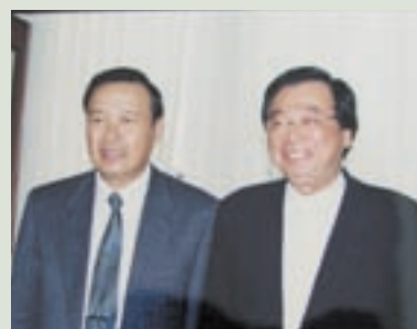
梁主任（左1）接待台南市市長—張燦鎣蒞家訪問