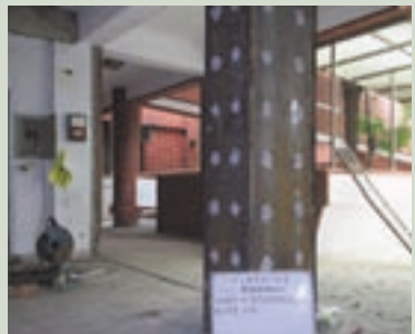
仁愛堂二樓柱鋼板補強封口