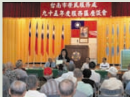
宣導日間照顧及自費夫妻進住事宜