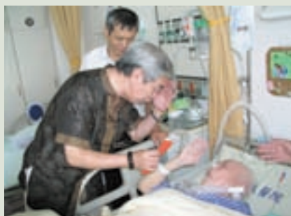
民國95年秋節譚主任（左）慰問住院榮民

對全體員工要求甚高，經常教導大家要把榮家當成自己的家一樣去愛護，把榮民當成自己的家人（長輩）一樣去照顧。發揮「愛心」、「耐心」、「熱心」之工作態度，不斷檢討精進，提升服務品質，滿足榮民需要，以使就養榮民能在溫馨、安適、且有尊嚴的環境中，頤養天年。並學習「慈濟—歡喜做、甘願受之精神」去服務、照顧榮民。