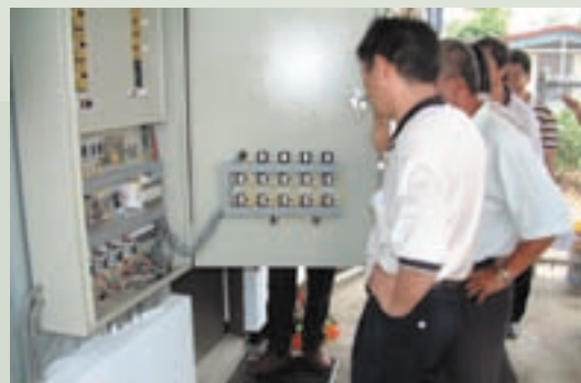
給水管路更新，配電盤驗收