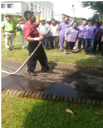
消防講習及消防演練