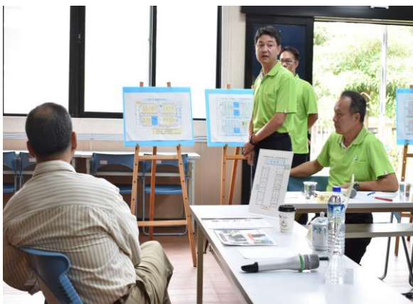
主任委員聽取本家房舍設施改善簡報