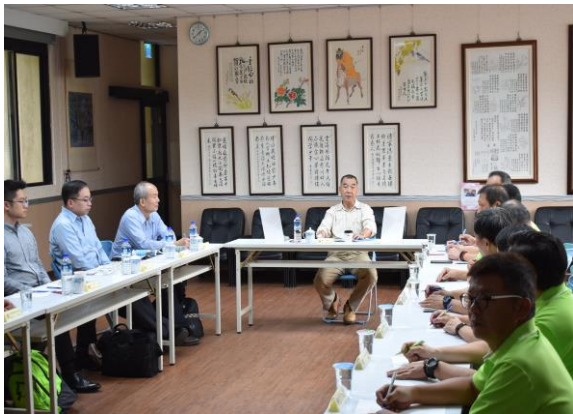
主任委員關懷本家住民及工作狀況

輔導會邱國正主任委員由就養養護處長林夏富陪同，於 10 月 26 日下午至本家視導，首先至同心館聽取工作簡報，後巡視榮家房舍設施改善情形，瞭解榮家配合長照政策規劃現有空間，活化整建增加入住住民，以因應高齡化社會需求。也瞭解關心榮民前輩生活狀況，囑咐各級幹部對住民加強照顧，並感謝榮家同仁在服務照顧長輩上的付出。