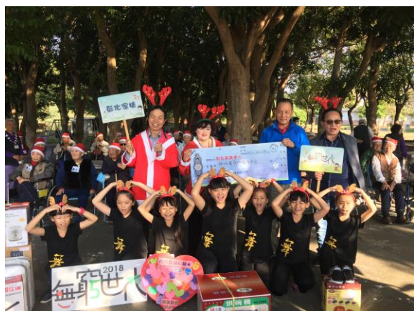
主任主持捐贈儀式

本家長輩及職員工們募集 15 萬餘元，購買聖誕禮物於 12 月 19 日送給彰化家扶中心，為孩子準備禮物圓夢，這活動已連續九年。今年於本家「養心園」舉辦聖誕圓夢趴踢禮物捐贈儀式，戴上聖誕帽的爺爺奶奶們，感受到聖誕節的喜悅及溫馨氣氛，開心跟著家扶兒童們一起跳舞，參加音樂遊戲，與家扶兒童們渡過開心的聖誕趴踢。