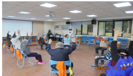
彼拉提斯團體運動課程