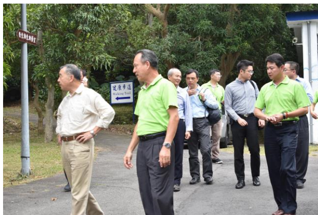
主任委員視導家區設施情形