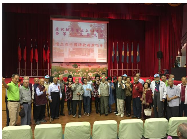
大百合演唱國語懷念金曲