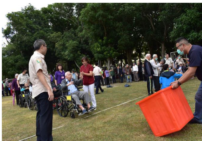
「養心園」趣味才藝闖關遊戲