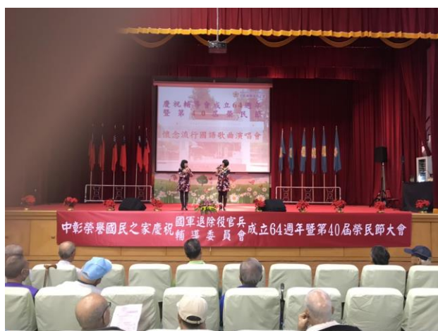
大百合演唱國語懷念金曲