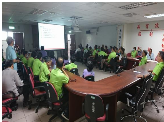
消防設備改善工程竣工教育訓練