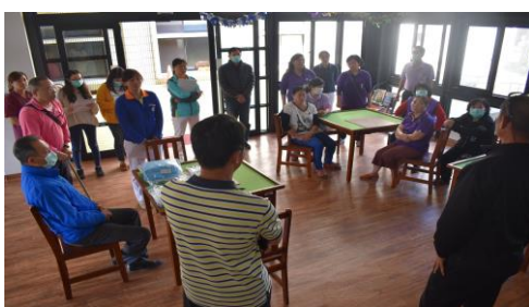
「疥瘡防治」在職教育訓練