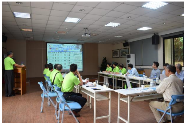
主任委員聽取本家工作簡報