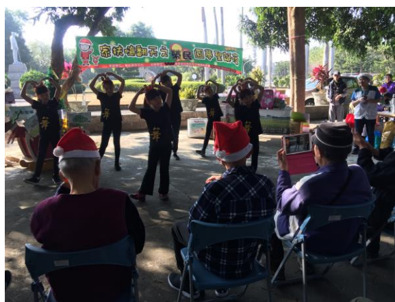
家扶兒童舞蹈表演與住民同歡