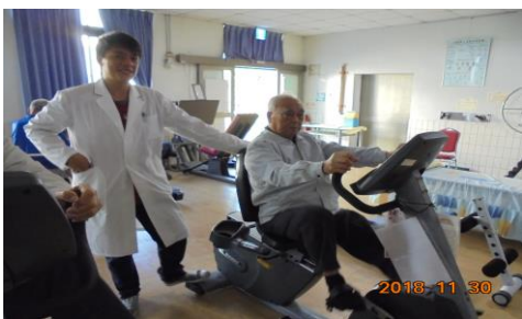
預防及延緩失能與失智之復健運動