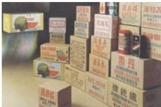
包裝菸酒紙箱產品