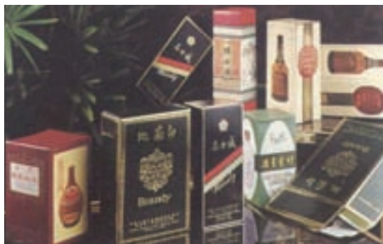
台灣菸酒公賣局訂製之各式酒品包裝盒