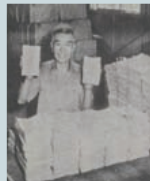
手工包裝草紙（衛生紙）（民國50年）