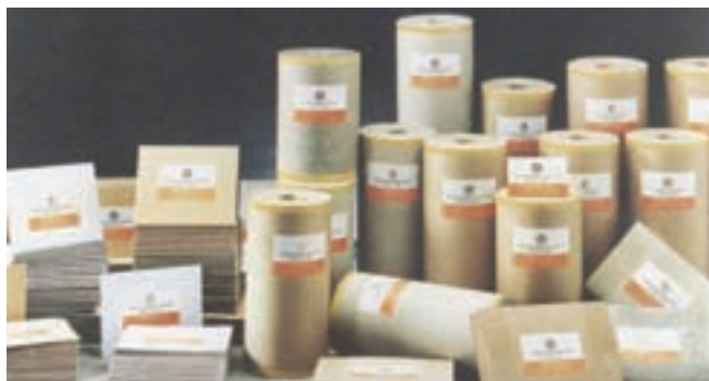
各式高級牛皮紙板等產品