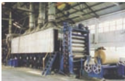
多烘缸六圓網抄紙機