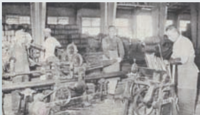
破竹機作業情形 (民國53年)