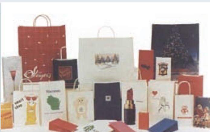
生產之各式百貨服飾業之購物袋

於民國85年仍因受制於公務機構法令約束、市場競爭激烈、紙漿原料高漲、人事成本較同業高等因素，營運無法自給自足，為避免持續虧損，奉核定予以結束營業。