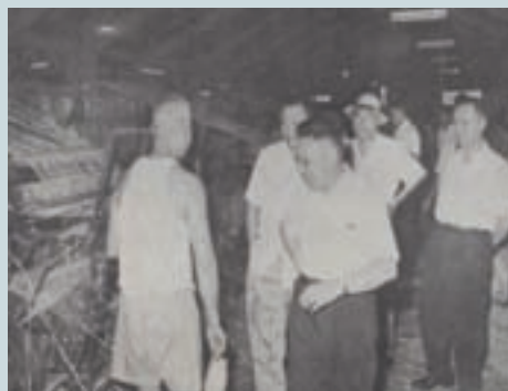
蔣經國主委（中）及趙聚鈺副主委（右1）視察草袋工場（民國50年）