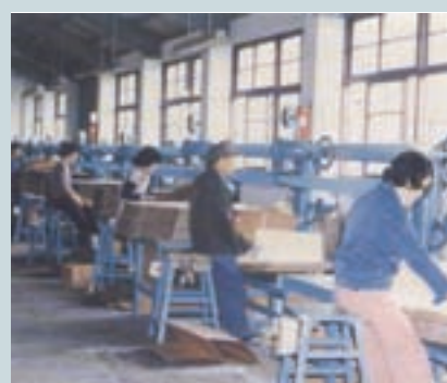
紙箱製造作業 (民國68年)