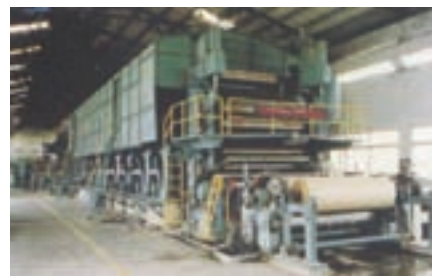
多烘缸長網抄紙機