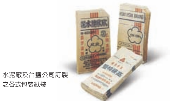
水泥廠及台鹽公司訂製之各式包裝紙袋