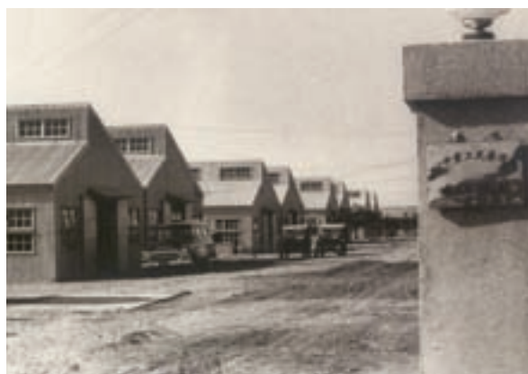
「臺灣榮民工業中心彰化榮民工廠」大門廠景