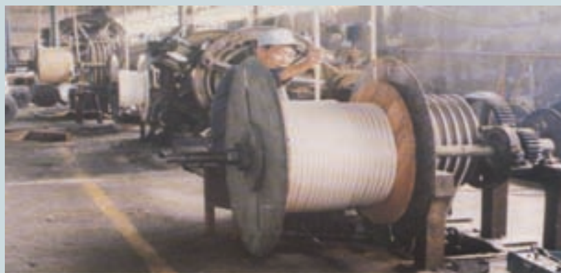
尼龍繩網紮作業(民國68年)