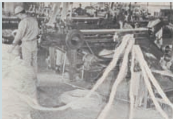
製麻繩作業（民國53年）