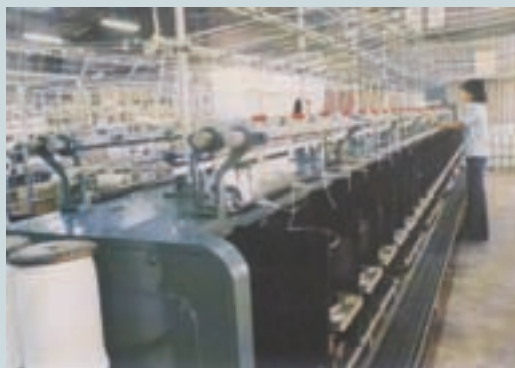
全自動化編繩機械設備（民國68年）

於民國74年興建品管專用大樓1棟，增購200噸巨型拉力試驗機1套，於3月間完成安裝試車啟用。由於品質管制制度健全，檢驗設備完善，產品品質精良，繩索類產品獲經濟部中央標準局核定准予使用「正」字標記，計有（一）多種規格耐綸繩索（二）聚乙烯繩索（三）各種規格聚丙烯繩索（四）各種聚酯繩索。繩索類產品當時獲得「正」字標記之廠商，僅該廠1家，這除了是對該廠繩索類產品的品質肯定，更有助於產品之行銷和市場競爭力的提昇。