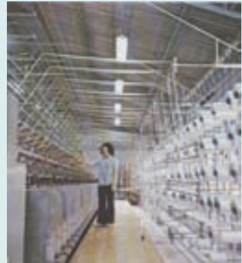
繩纜全自動化設備(民國68年)