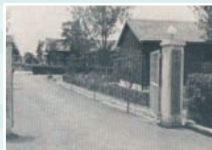
岡山蔴品製造廠門景（民國53年）