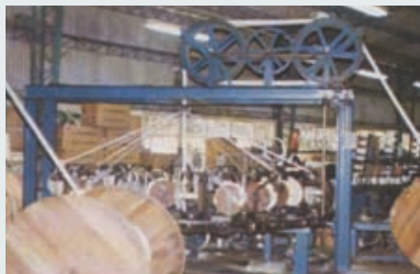
研製「尼龍雙編繩」所用之自動化機械設備

術；該廠乃參考海軍提供之尼龍雙編繩樣品，並收集美國SOM-SON公司資料，設計、繪圖交廠商承製機器設備2台。該廠隨即積極研究、實驗，經多次改進，民國69年終於試製成功。是項雙編繩的拉力強，堅牢度優，使用又方便，經海軍單位訂購，交艦艇試用；因效果甚佳，而獲國防部列入試驗訂貨品項。