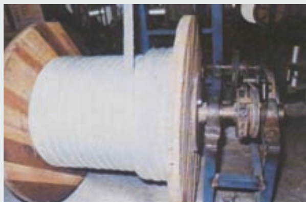
研製成功之「尼龍雙編繩」