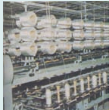
尼龍繩機具設備(民國67年)