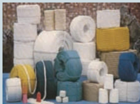
各種植物及化學纖維繩纜、縫線、編織繩帶等