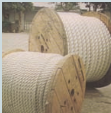
尼龍繩成品(民國68年)

59年，海軍減少訂購馬尼拉麻繩；為適應國防及市場需要，該廠緊急修訂生產策略，增產各種尼龍繩纜及工業用之漁網線與淺水泥線（工業用線、漁網線、船用碰墊與安全網等混合人纖製品），毅然更新設備，增建尼龍繩工廠，前者內銷公營事業機構，後者則外銷東南亞及南韓、日本。於60年開始生產尼龍繩，由於品質優良，頗受國內外客戶所歡迎。61年更擴增設備，發展合成纖維繩纜，並不斷研究推出新產品，推出無接頭之全規格工業用筏，及遠洋漁業使用之鮪釣繩，並將原有紡製麻筏機器23台，由該廠改裝為合成纖維多功能機械，逐步淘汰麻製品，產製高級合成纖維產品。