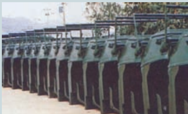
軍用2½T卡車駕駛座艙

另開發完成軍用卡車水箱製造能量，依照規定須承擔18磅壓力，在過去被視為國內工廠無法製造，經該廠努力研究克服了技術上的困難，終能於58年製造成功，不僅符合美軍規格，且經測試可耐28磅的壓力，使美軍顧問團人員甚為驚奇。