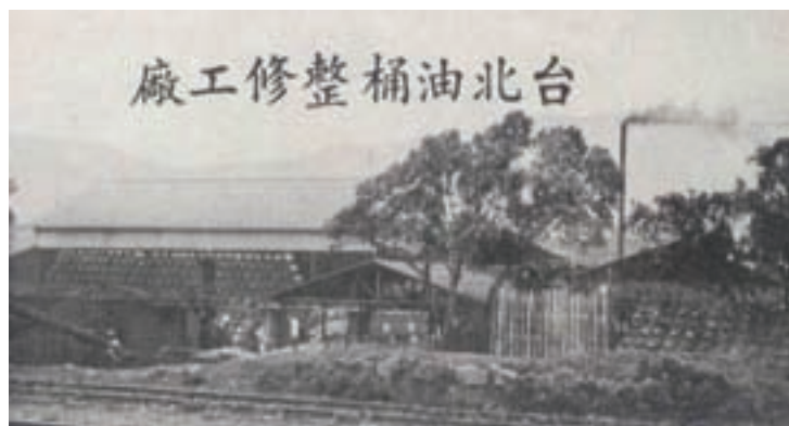
台北市南港之台北油桶整修工廠外景（民國53年）