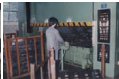
生產汽車大樑壓製作業