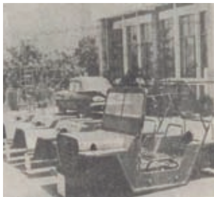
軍方訂製之1/4T指揮車車身