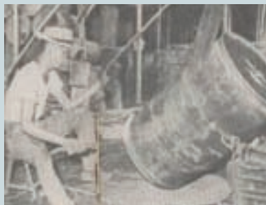
油桶焊補漏孔作業 (民國51年)