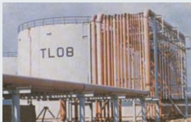
中油公司高雄煉油廠管線工程