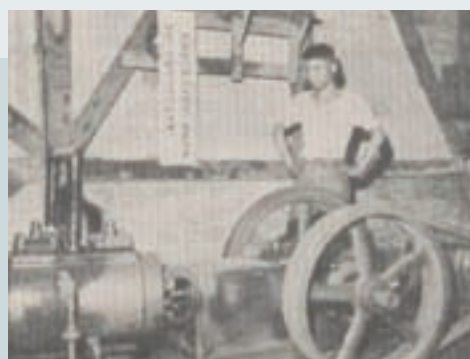
使用之空氣壓縮機 (民國51年)