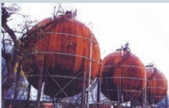
建造中之1,000公秉天然氣球槽外觀