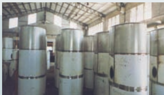
不銹鋼油灌車之筒身焊接