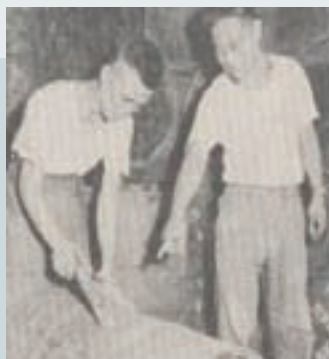
油桶表處加工作業 (民國51年)