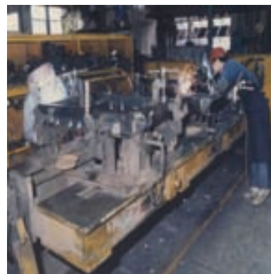
汽車大樑焊接作業