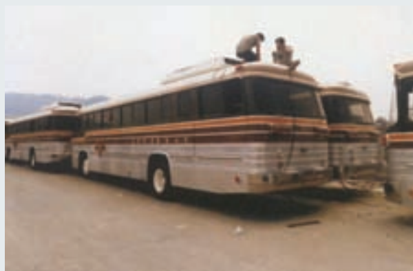
打造之省公路局「中興號」車身