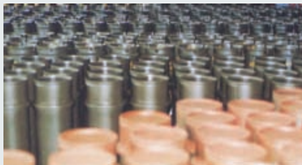
軍用火砲發射藥筒