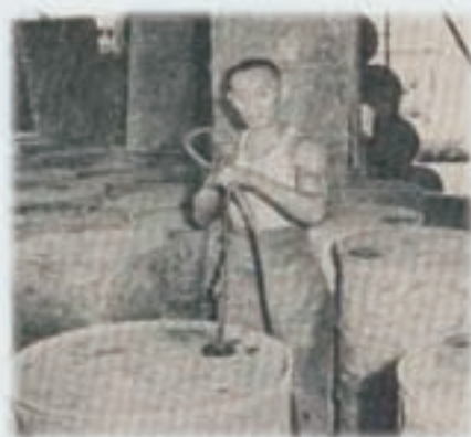
油桶內噴注防銹油作業（民國51年）

台北縣新店市新廠於民國56年12月20日動工，58年1月完成遷廠，並於71年1月在高雄市楠梓區設立分廠，承攬南部地區鋼鐵有關工程，該廠遷至新廠後即充實機具設備，培育技術人員，擴大人員安置，開發新產品，60至89年間主要營運發展過程如下：