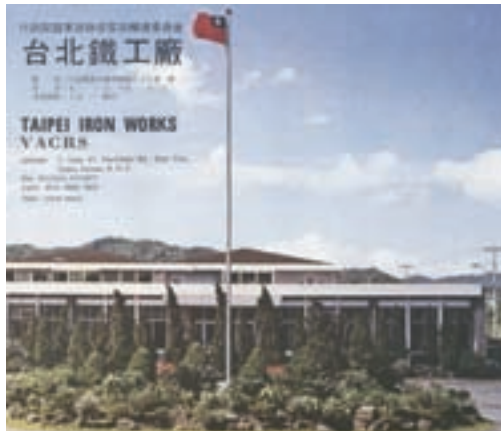
新店廠區行政大樓前國旗飄揚