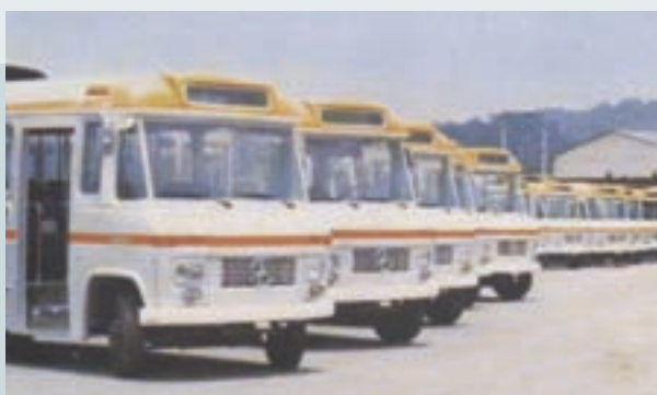
打造之台北市中型公車車身