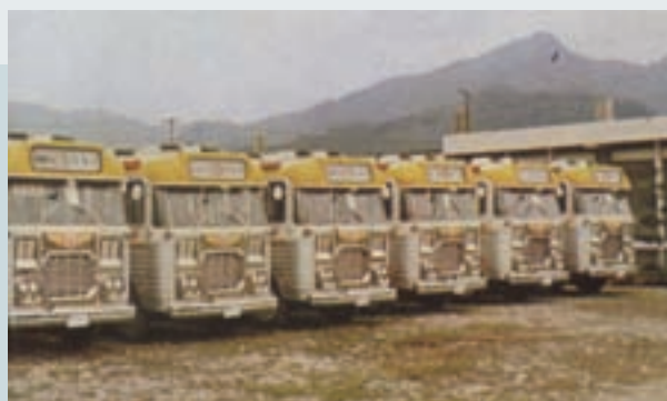
打造之台北市公車車身