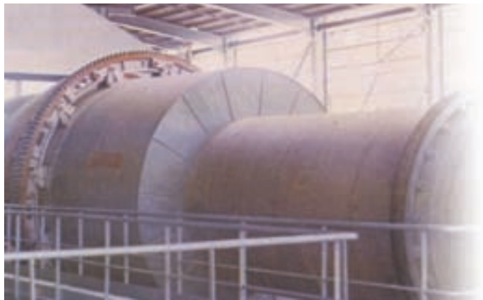
中國磷業公司磷酸鈉冷卻工程