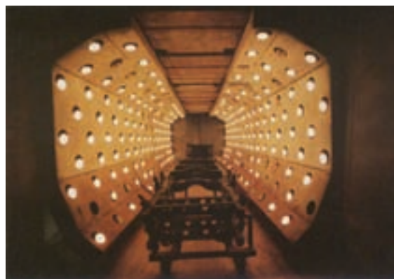
汽車大樑表面處理—紫外線烘乾製程