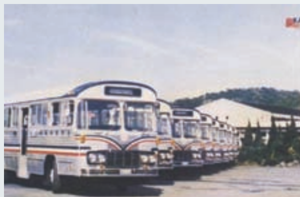
打造之省公路局客運車車身