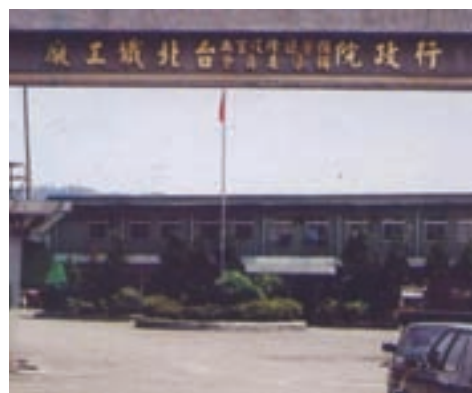
台北縣新店市之台北工廠門景