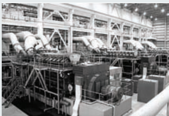
澎湖尖山發電廠1至4號發電機