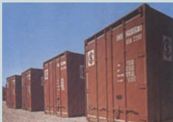
製作之20呎鋼質貨櫃