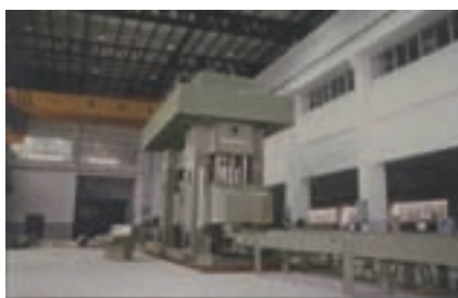
汽車大樑生產線之重型壓機設備