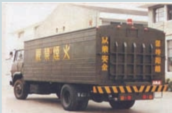
硝化甘油運輸車車身