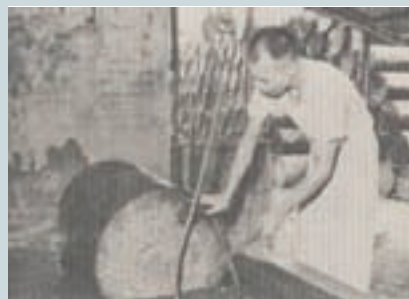
油筒試漏作業 (民國51年)