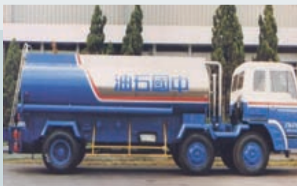
油灌安裝於中國石油公司油灌車