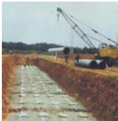
瓦斯地下管線工程排放管施工