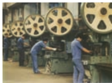
機械加工之沖床作業