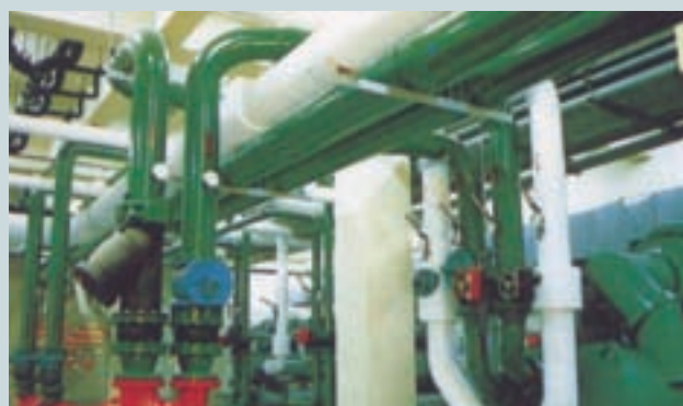
承攬冷凍空調工程之機器設備