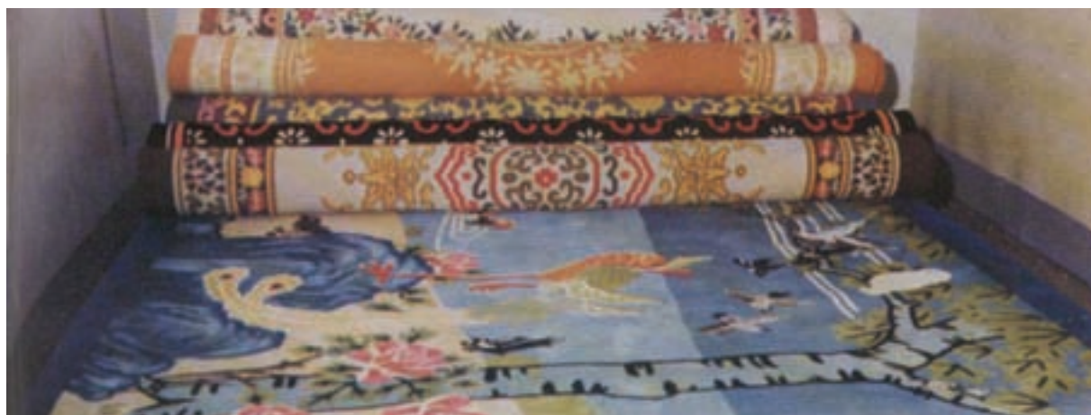
色調高雅之地毯成品