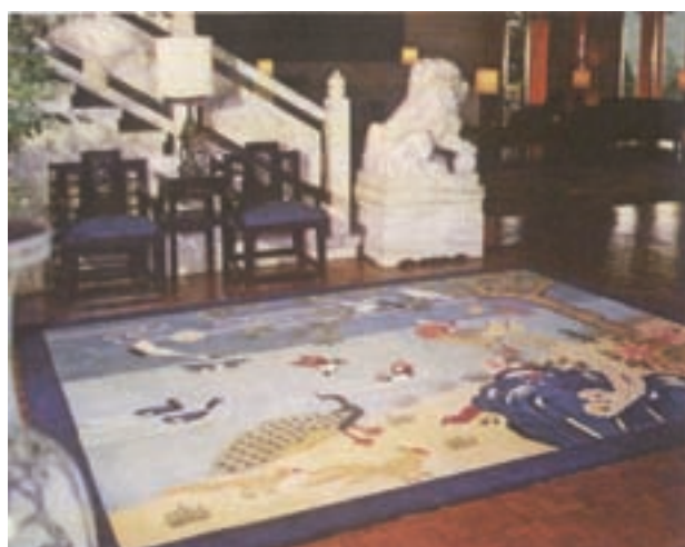
圓山飯店大廳用之地毯