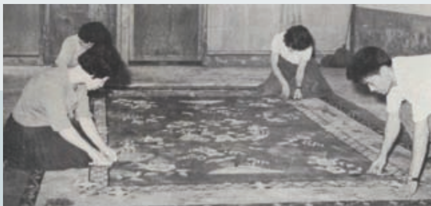
榮民子女學習剪修地毯（民國53年）

本會於民國47年成立山崎榮民就業講習所，鑒於地毯編織之手工藝適合榮民習作，於是於該講習所試辦該項手工藝訓練，結業榮民轉入各民營工廠就業，頗有績效，乃決心自行籌辦地毯工廠以安置榮民。適時有中國物產公司結束在台業務，願將所經營之自由地毯工廠出讓，本會乃於53年1月1日正式接管，改稱中壢地毯工廠。