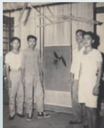
學習製毯手工藝的榮民子弟