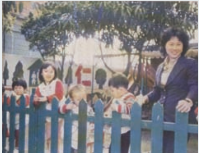
附設的「榮壇」托兒所園景（民國70年）

退休後，過著含飴弄孫的休閒生活，兼從事有機茶葉事業，由於本身身體力行，迄今雖已年近70歲，但實際看上去仍滿頭黑髮、精神奕奕。