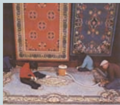
花色艷麗的編織地毯半成品修剪作業