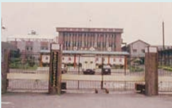
榮民製毯工廠廠區大門