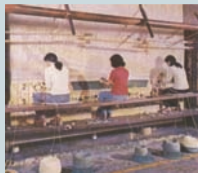
編織手工地毯作業