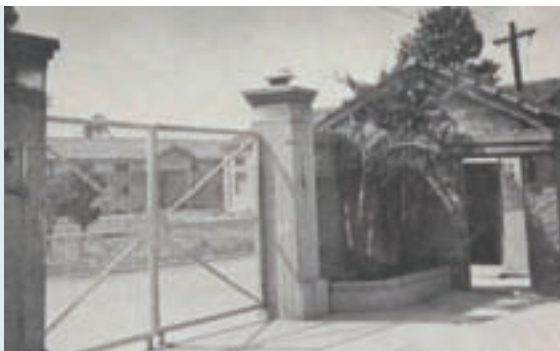
中壢地毯工廠大門（民國53年）