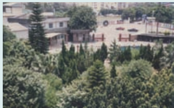
由行政大樓向大門外之景觀