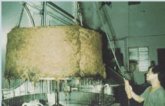
毛毯原料之羊毛染色作業