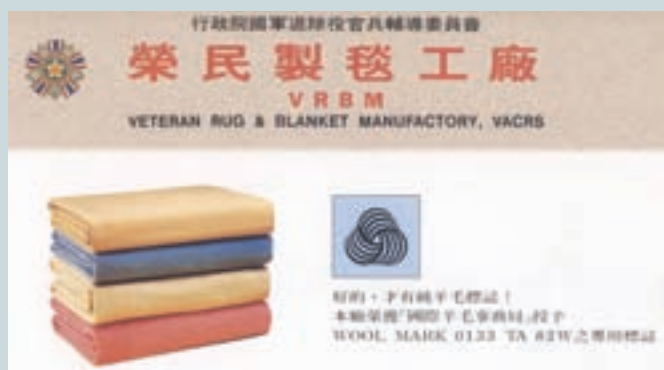
純羊毛標誌的毛毯型錄

該廠生產之天津地毯等地毯產品，具有中國傳統精美編織藝術的風格，蜚聲中外，甚獲好評，惟大陸產品以廉價傾銷，加上國內進口地毯日多，市場自然萎縮，因此於民國70年增建新廠房及辦公用大樓一棟，自義大利整廠輸入現代化的毛毯生產設備，採紡織、染、整一貫作業，因產品品質優良，國際羊毛局授予專用標誌，經濟部商品檢驗局亦核准該廠是自行檢驗出口的優良外銷廠家。