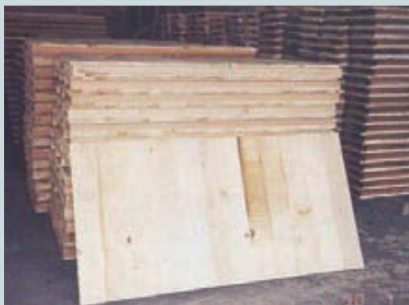
利用零廢木料生產之模板建材