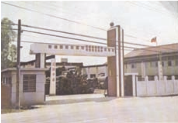
位於豐原市中正路舊廠門景