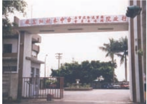
位於豐原市豐勢路新廠門景