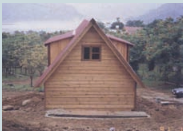
嘉義農場休閒木屋