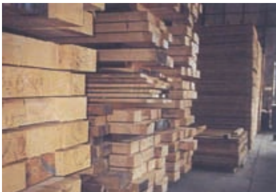
由原木鋸成之木材