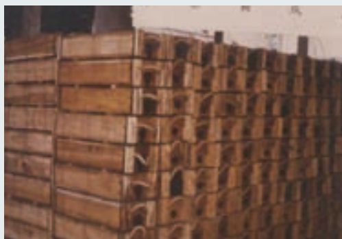
軍方訂製之彈藥箱

價方式取得，約佔軍方市場總銷售90%，惟自83年後改採公開招標，業務大量流失；民間市場則以木材乾燥、防腐加工等為主。