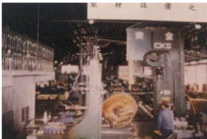
原木剖材機製材作業