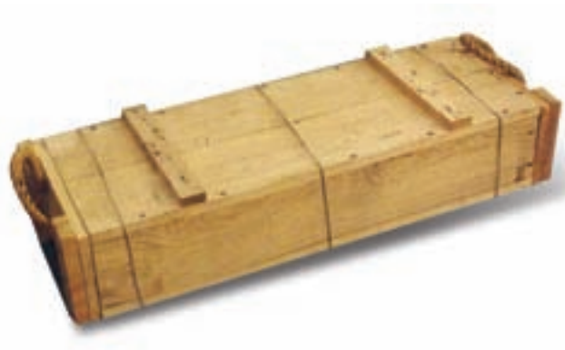
軍方訂製之彈藥木箱