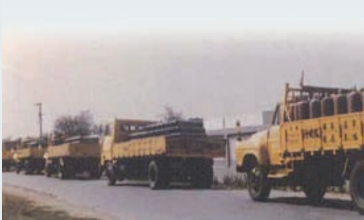
生產之氣體鋼瓶出貨情形

民國64年9月1日為該廠成立十周年紀念日，回顧該廠成立之初，僅有員工三十餘人，全年營業總額，尚未足300萬元。10年來由於政策正確，歷任廠長領導有方，以及全體員工合作努力，先後在台南、樹林設立新式乙炔工場，增加生產項目，並積