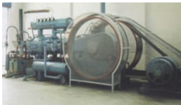
製造氧氣之空氣壓縮機