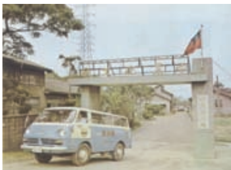
中農化工廠台北景美廠區之門景