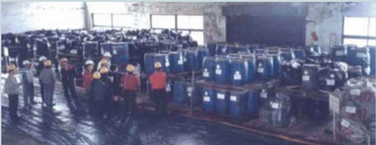
待處理廢農藥存置於符合環保規定之容器及場地