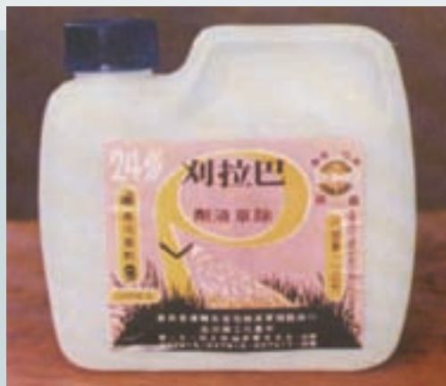
巴拉刈除草乳劑農藥