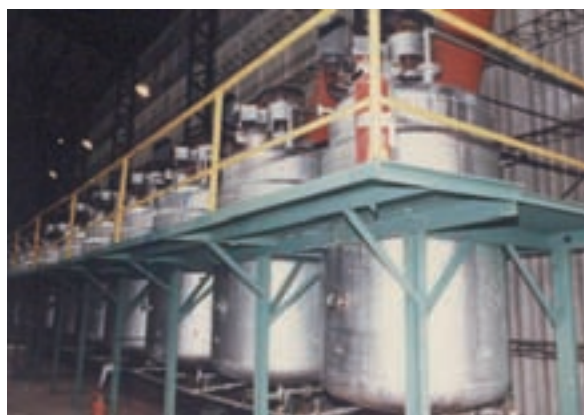
巴拉刈農藥生產設備