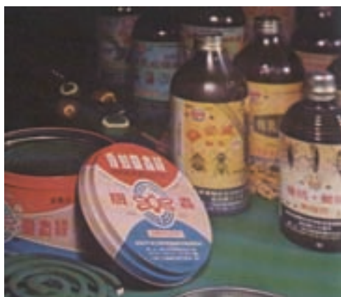
殺虫靈蚊香等環境衛生藥劑