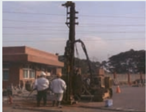
鑽井取地下水檢驗

民國87年9月委託專業公司進行全廠土壤及地下水調查，並提出「榮化廠結束營業事業廢棄物清除處理計畫書」，復於90年9月報桃園縣環保局「K區整治計畫」及「土壤及地下水補充調查計畫」，於91年12月完成執行。92年2月再向桃園縣環保局提報「全廠土壤整治計畫」，並委請榮工公司代為處理，外包專業公司於95年完成該廠污染土壤整治工作，於96年再持續辦理地下水監測等環境管理一年。