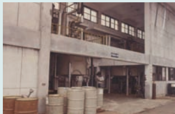
有機磷產品廠房設備