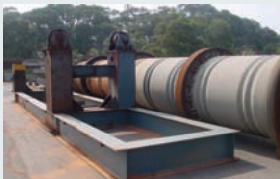
焚燒污染土壤之旋轉爐