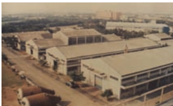
成藥工場廠房鳥瞰