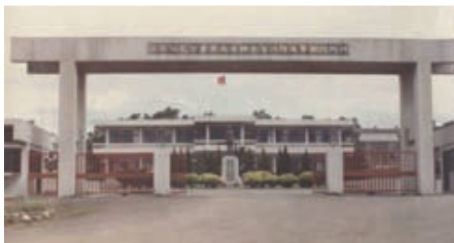
榮民化工廠於桃園楊梅幼獅工業區之門景