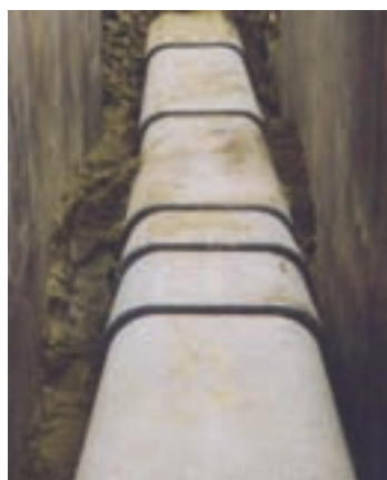
堆設預鑄電纜管之工地現場