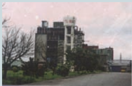
生產四氯異苯腈農藥之廠房