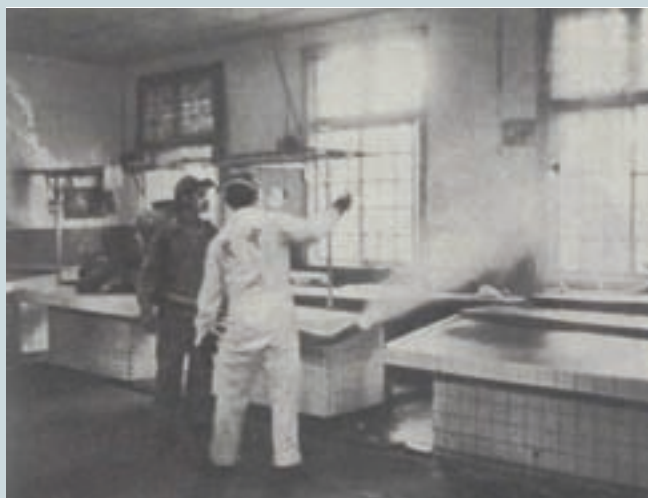
中農化工廠至台北市各市場義務消毒

該廠訓練榮民弟兄從事化學工業技術的製造、研發，並編組員工成立噴洒消毒工作小組，採取機動作業，小組人員平時參與產銷工作，可隨時接受客戶之委託，辦理環境除蟲消毒工作，歷年曾接受甚多政府機構及民間之委託，是1支名副其實的「環保隊伍」；例如曾受台北市政府委託辦理46個市場及公共場所的消毒，獲該府衛生局之頒獎表揚，配合政府機構、民間企業及地方社區改善環境衛生，不惜成本提供完善服務的事蹟不勝枚舉。