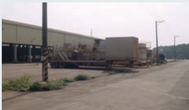
土壤整治機具設備