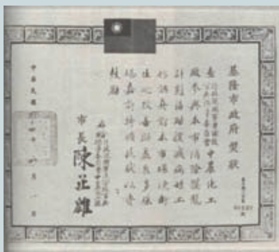
基隆市頒發協助消除髒亂計畫之獎狀