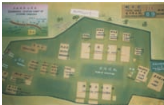
榮民化工廠廠區佈置圖