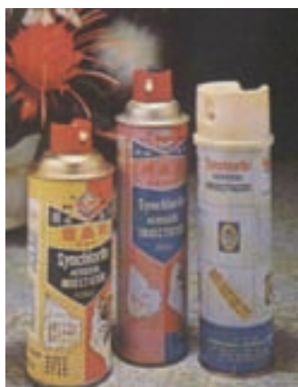
罐裝殺虫靈等環境衛生藥劑