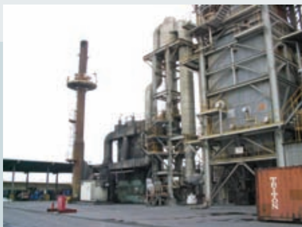
事業廢棄物運送至水美公司觀音廠之焚化處理設備