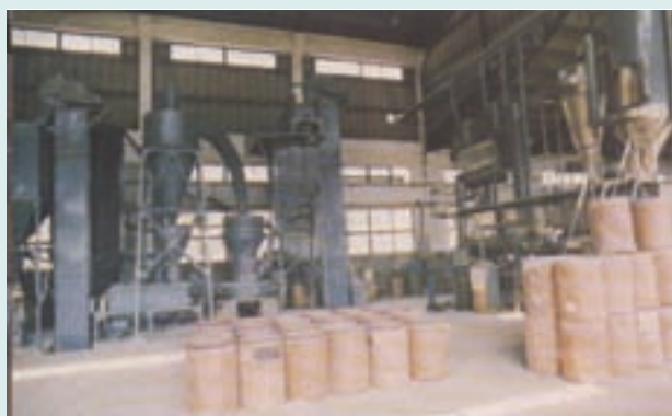
粉劑工場磨粉設備