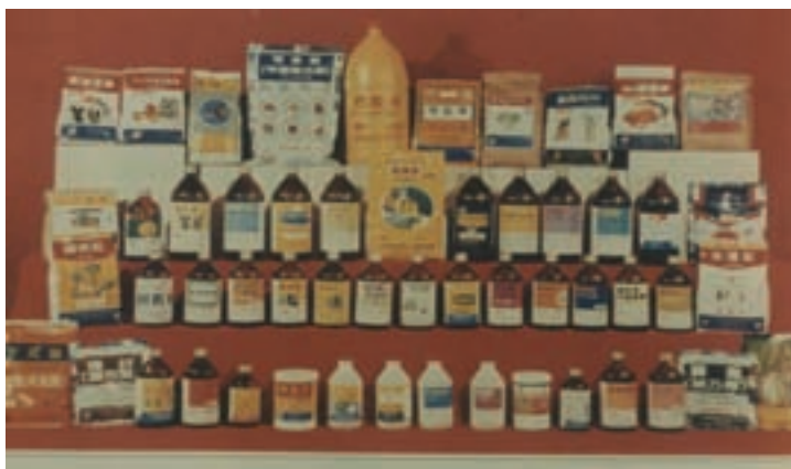
農藥成品、農藥原體、環衛藥、劑界面活性劑等產品