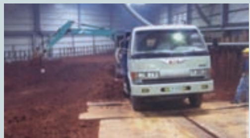
整治之土壤先隔離再開挖及運送焚燒處理