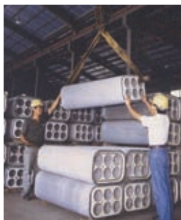
與民間合作生產之電纜導管