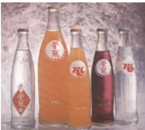
產品—榮冠奎寧、橘子、香檳、葡萄、蘇打水