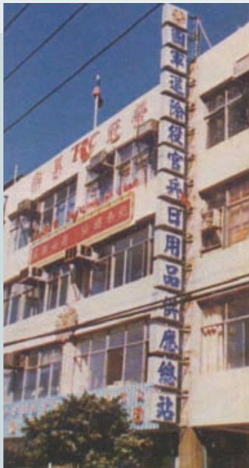
台北市日用品供應總站有「榮冠果樂」廣告標誌