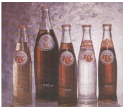
產品—榮冠蘋果、果樂、檸檬、汽水、沙士