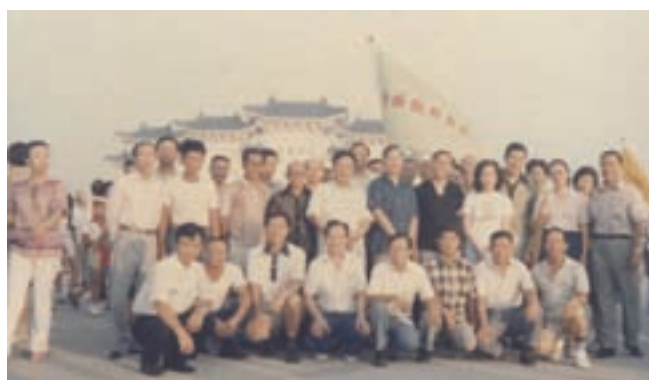
員工至中正紀念堂參加活動合影