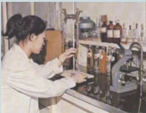
化驗室原物料及成品品質檢查