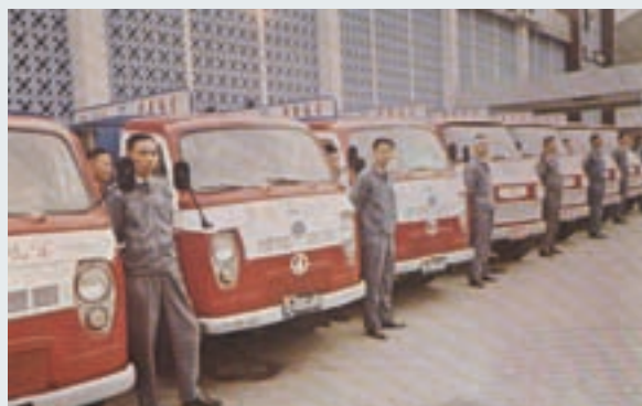
運銷各地之運貨車車隊