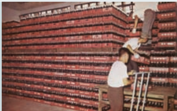
待運銷的飲料成品