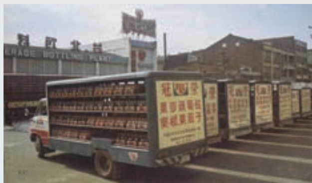
供應市場之飲料運送車