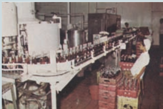
果樂生產成品目視檢驗