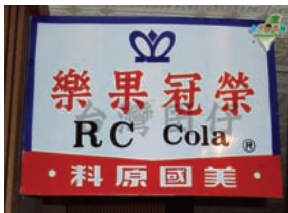
全省市場銷售場所使用之鐵招牌