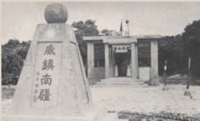
位於南島島上之鎮南廳（民國53年）

58年試辦虱目魚及海參之採撈業務。60年利用東沙群島，新創植桑養蠶事業，試辦成效良好，計劃積極推廣，於5年內完成。63年為便利東沙海人草儲品安全，經重建海人草倉庫1座，不但容量擴大，而且對防風、防雨、通風之結構設計成績良好，對產品儲存儲運甚有裨益。