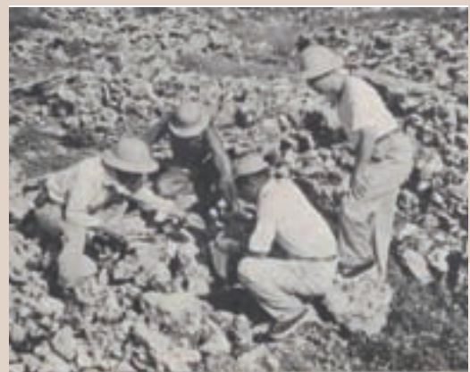
南海開發小組之磷礦勘測（民國53年）