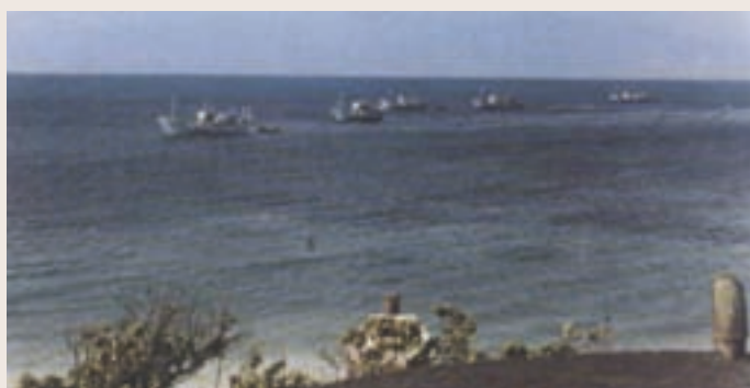
南海資源開發所採撈海人草船隊（民國68年）