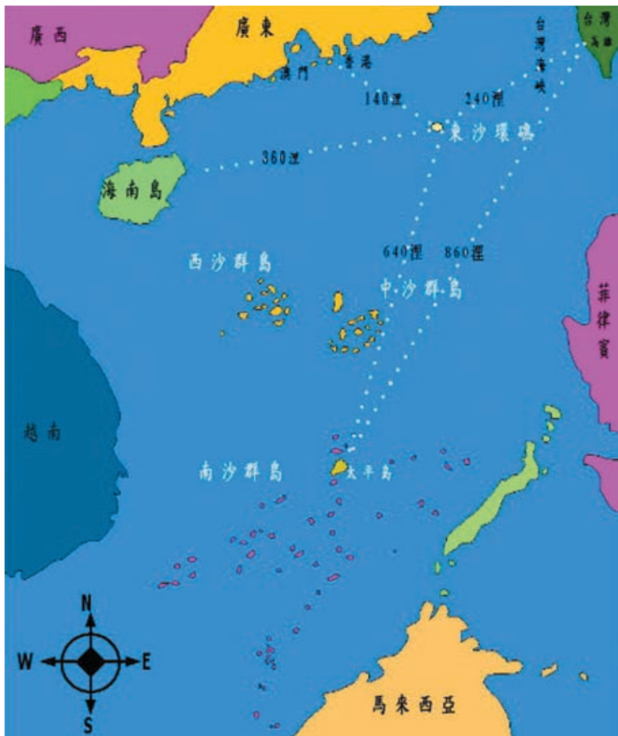
東沙與南沙群島地理位置圖