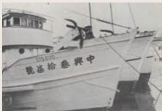
南海開發小組之漁船（民國53年）