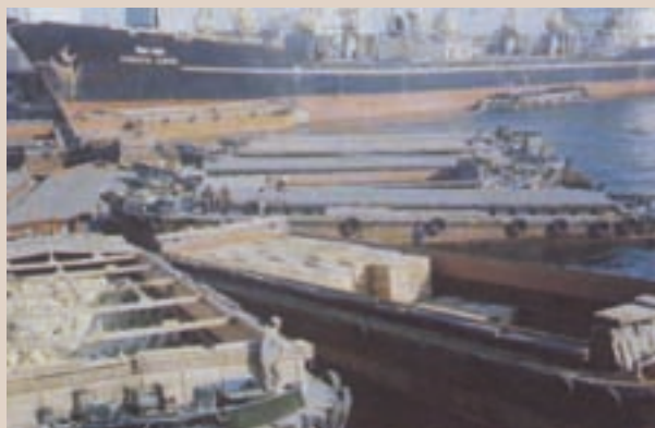
開採之磷礦裝船運銷日本（民國68年）

南沙群島的磷礦開採為該所成立初期的主要業務之一。民國60年該所改良磷礦採取方法，完成採運設施，並獲台糖、台肥兩公司收購，於年度內大量產銷。63年為便利磷礦產的運輸，擴建駁運棧台1座，以增強駁運效能，後來開採之產量增加，外銷日本。