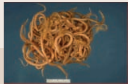
吃驅蟲藥排出之蛔蟲（尺規4公分）

1.成蟲在小腸中產卵→2.隨排泄物落在泥土中發育成胚胎卵→3.卵內有小幼蟲→4.胚胎卵被吞食（譬如由施肥的蔬菜）→5.到達小腸孵出幼蟲→6.鑽進腸壁（經循環系統進入肝臟，再流經心臟），到達肺部，再由血管進入肺泡，經生長及蛻皮後→7.沿氣道到達喉頭，藉著吞嚥，幼蟲再經消化道到達小腸，在此發育為成蟲。