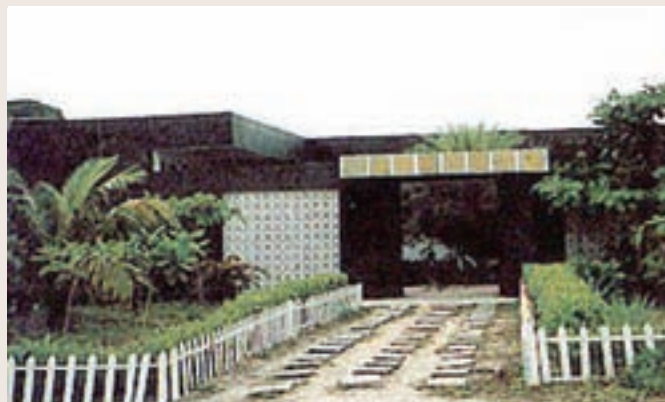
東沙島漁民服務站

該所在東、南沙島嶼開採的項目均與民生有密切關係，如海人草供提煉西藥原料「海人酸」，製成驅蟲藥劑，磷礦用作肥料等，均為與民興利的具體貢獻，對開發國家的資源，亦提供了貢獻。