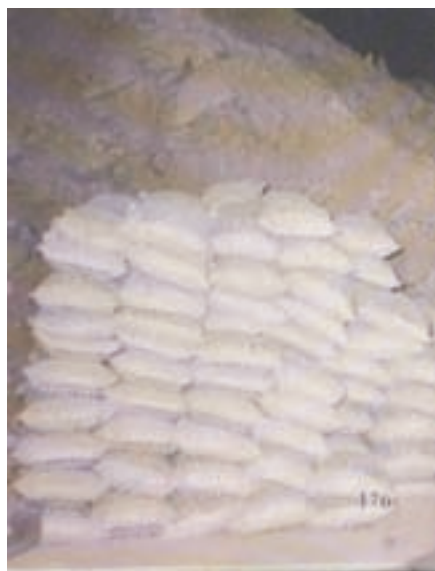
南海資源開發所開採之磷礦