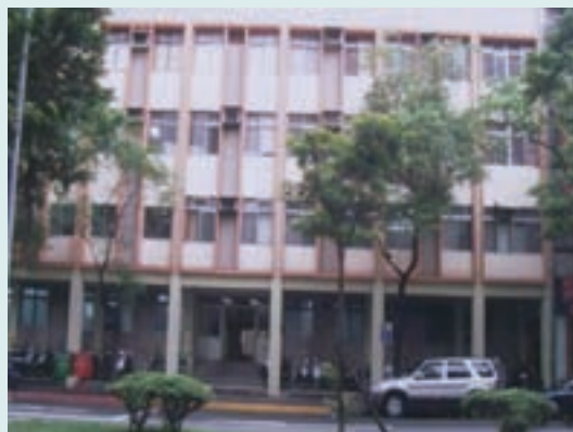
中心辦公室大門（新址）