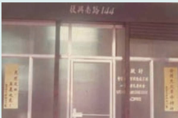
中心辦公室大門（舊址）