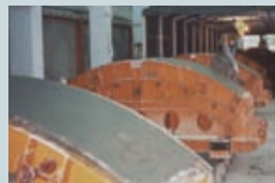
生產之台北捷運工程隧道環片