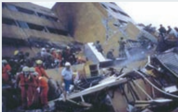
救災行動：瓦礫中搜尋生還者

可見倒塌或傾斜的建築物，尤其民宅損失最嚴重，災民幾無法遮風避雨，故不但要搶救生命，更要積極整頓災區。