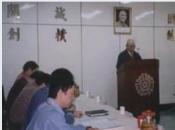
單英副主任（右1）於工作會報發言

單副主任在65年10月即輔導就業，在台北榮民勞務中心傳遞隊擔任清潔工的工作，後來傳遞隊改為投送隊，負責大台北地區公共電話清潔工作，每天清晨4點鐘就要外出擦拭工作區域（台北市信義路以北光復南路以東至北五堵）內的公共電話，並必需在上班前工作完畢回中心報到聽候調度，風雨無阻，然薪資只四仟餘元，無法溫飽一家五口，下班後開計程車以為補助，如此勤奮8年，於74年調昇為副管理員，負責隊部輔導、人事及公共電話清潔督導業務，後續升為