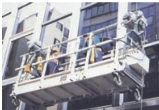
大樓外窗清潔作業