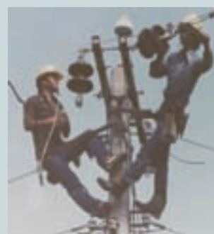
承攬台電公司電力線路架設工程