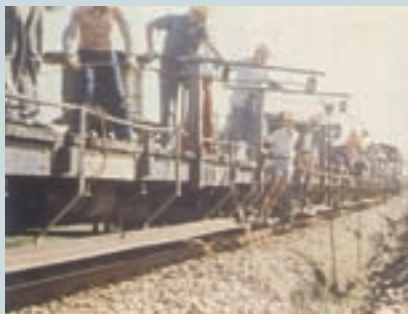
十大建設鐵路電氣化工程電力線鋪設（1）