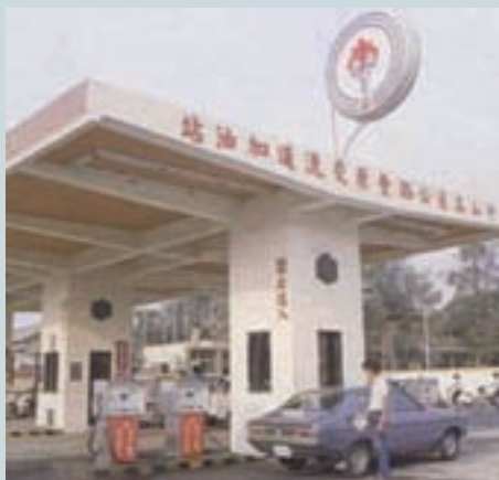
中山高速公路加油站加油一般勞務