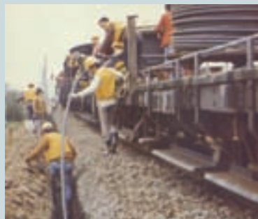
十大建設鐵路電氣化工程電力線鋪設（2）