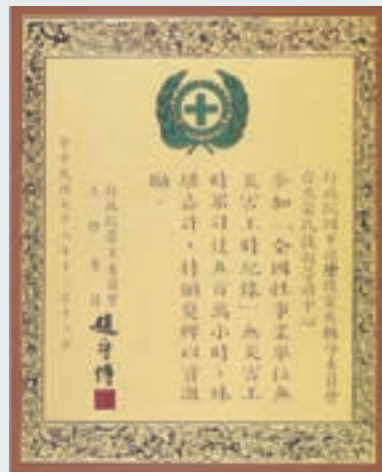
重視工安榮獲勞委會趙主委獎牌

67年11月編組成立抄表收費隊，承攬全省各地台電公司之電錶指數抄錄、電費單投遞及電費收繳業務。計爭取到基隆、台北、桃園、中壢、龍潭、新屋、大溪、新坡、大園、新竹、苗栗、台中、南投、員林、彰化、宜蘭、花蓮及澎湖等地之業務；並承攬新海瓦斯公司、陽明山瓦斯公司之抄錶及收費工作。