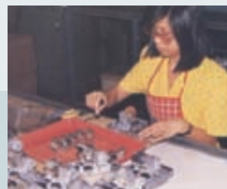
台電公司之家用電錶檢修維護

技術二隊在60至65年間承接台電公司電錶拆裝、清潔、檢測及維修勞務。電錶需定期使用儀器檢測，為維持其使用壽命，尚需定期清洗，故障的電錶，需拆下進行維修。