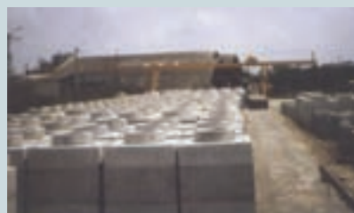
水泥製品加工隊生產之地下管路人孔

中心的水泥製品加工隊專門製作人孔、水泥隔板、水泥管、基樁等料材，供給公、民營機構工程使用。