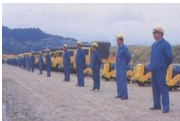
施工技術人員及裝備