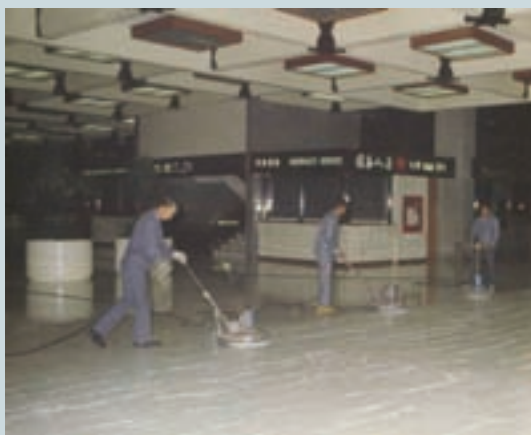
公共場所清潔打蠟