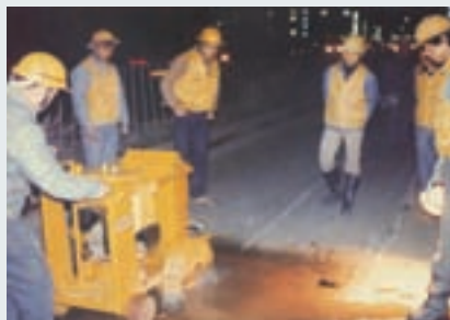
鋪設管線柏油路面切割

線工程。在國道、省道、鐵道等沿線埋設油管線、電纜、電線、瓦斯管線等之埋設工程；地下