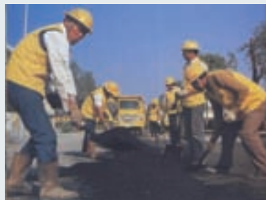
鋪設管線後柏油路面恢復