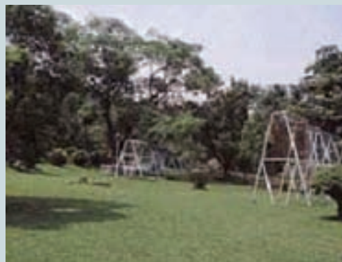
高雄市庭園綠化工程