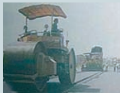
松山機場滑行道整修 (2)