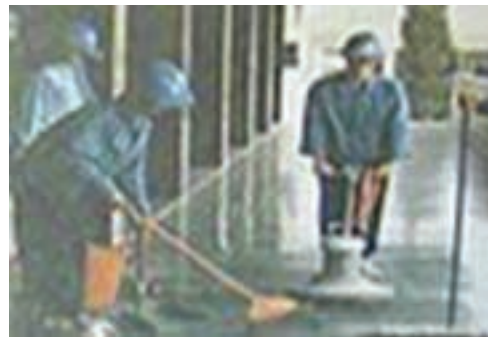
清潔打腊一般勞務