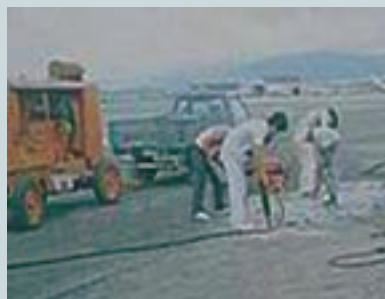
松山機場滑行道整修 (1)