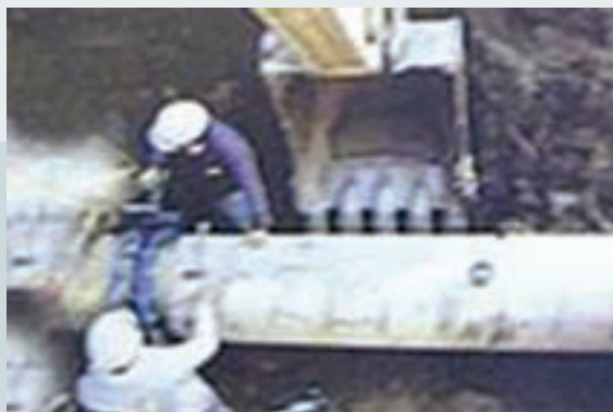
液化石油氣管路埋設

善工程、欣泰、欣雄、欣高等瓦斯公司輸氣管理設工程，因中心承接甚多該類工程，因而累積了甚多挖埋管技術，使中心業務蓬勃發展，對促進國內社會安定、經濟穩定，貢獻良多。不論電力公司、電信局、中國石油公司或瓦斯公司等之地下涵管管線埋管工程，作業程序大同小異，步驟如下：涵管加工組裝待埋→挖管路→埋管→接裝→覆土。