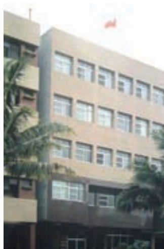
高雄市河北一路辦公大樓