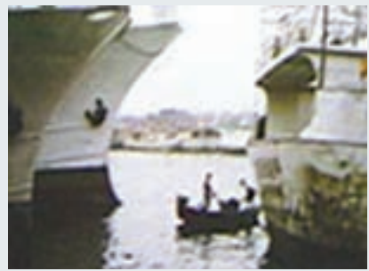
高雄港水面油污清除