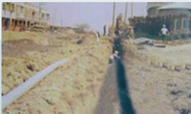
電信局電信線管路埋設