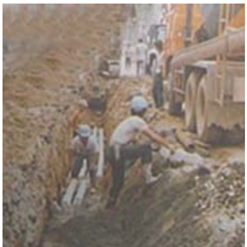
電信管路埋設工程