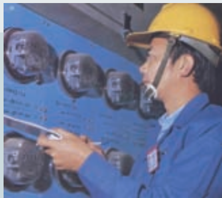
為台電公司抄錶服務