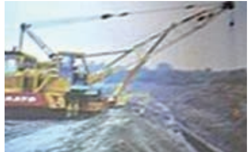
液化石油氣管路埋設工程