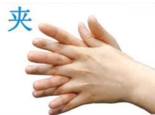
3. 十指交錯，搓洗指縫