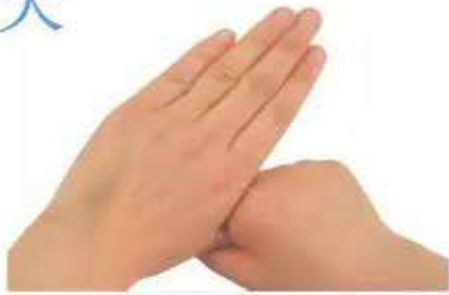
5. 搓洗大拇指與虎口