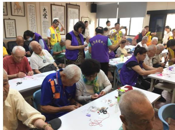
住民們動手作香包