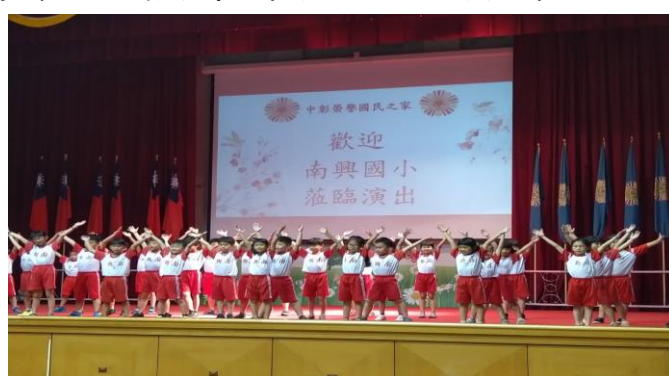
小朋友活潑可愛的舞動表演