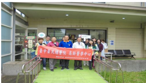
108 年度住民健康檢查