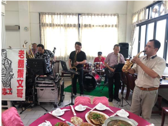
「老鬍鬚樂團」薩克斯風表演

本家於 6 月 5 日舉辦端午節會餐，並邀請家屬至家區與住民共同餐敘，深獲家屬好評。一道道豐盛的佳餚，讓大家吃得津津有味，開懷不已。還特別邀請「老鬍鬚薩克斯風樂團」現場演奏優美經典歌曲，讓住民與家屬於享用美食時，同時享受悠揚美妙的音樂，現場溫馨熱鬧，氣氛融洽。