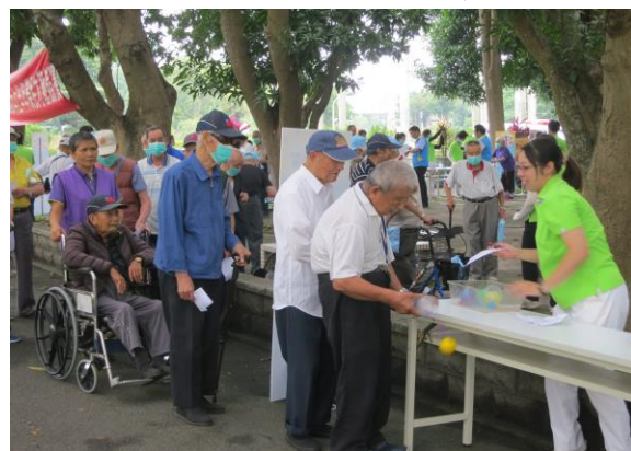
住民們參加趣味闖關遊戲情形-1