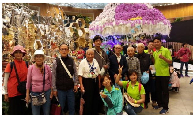
住民分梯參觀台中花博展情形-1

今年上半年自強旅遊活動，特別前往「臺中花博后里馬場園區」參觀，榮家特別安排區分 6 梯次每次 18~20 人，以「小批次、多梯次」方式辦理，並安排品嚐在地特色美食與參觀后里糖廠及快樂購物等行程，尤其不用到臺北即可看到故宮博物院鎮宮之寶「翠玉白菜」，讓長輩們一飽眼福、口福。