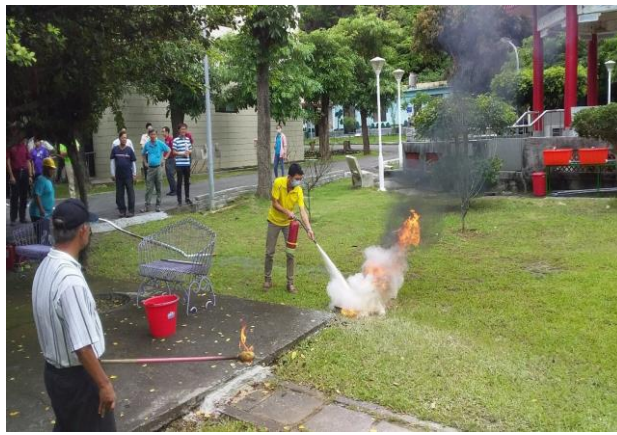
消防安全講習及操作演練