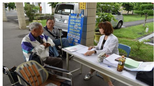
108 年度輔具檢測維修