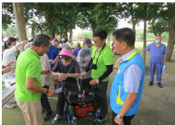
主任與基金會尤秘書長陪同住民闖關