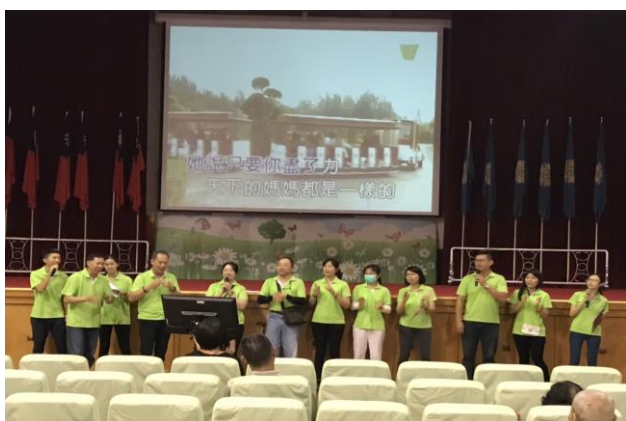
主任與全體職員工一同合唱

母親節前夕本家特別舉辦「母親節 K 歌活動」，邀請全體住民及職員工們一同歡慶。主任並於現場分送女性住民、職員工及照服員，每人一朵康乃馨。最令人驚艷的是，榮家的好朋友---實力派唱將大百合李艷甄，突然現身，讓現場住民都熱烈鼓掌歡迎，大百合隨即帶來多首膾炙人口的經典老歌，並與多位住民一同歡唱。