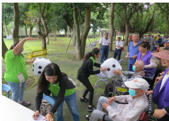
住民們參加趣味闖關遊戲情形-2