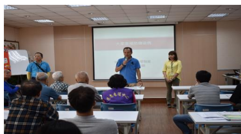
「大家來預防傳染病」健康講座