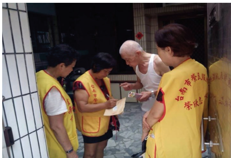
榮欣志工到府訪視年長榮民

，暢通溝通管道，簡化服務流程。 對行動不便及年長榮民，以到府訪視及協助社福資源連結之服務模式，提升總體服務品質。