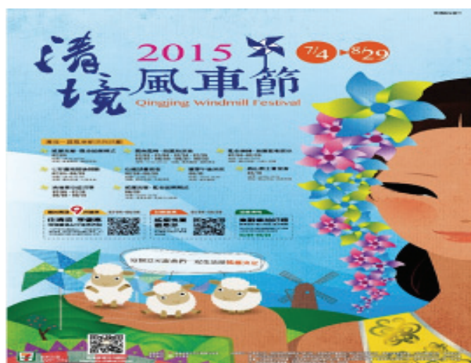
清境農場 2015 風車節宣傳海報

各農場配合時節辦理武陵櫻花季、清境風車節、福壽山賞楓季等特色主題活動，及銀髮族長宿居遊、親子採果樂活遊等促銷專案 ，提高平日及淡季遊客量。 本年雖受颱風影響，迄今遊客166萬8千餘人次，盈餘2億4,394萬餘元，均較去年同期分別成長5.76%及5.39%。