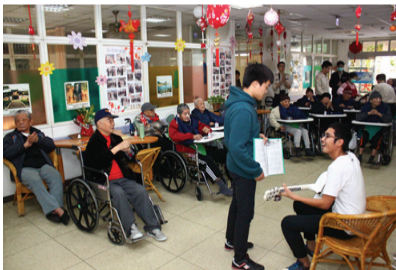
雲林榮家少年安親學園與榮民長輩互動

方縣市政府簽訂資源共享協議，接受委託安置， 包括安養38床、養護57床、失智18床，共計113床。 。 雲林榮家與雲林縣政府簽訂代間教育合作備忘錄， 共同合作成立 安置中輟學生之少年安親學園 。目前安置6人， 協助渠等於正常環境下學習，完成教育。