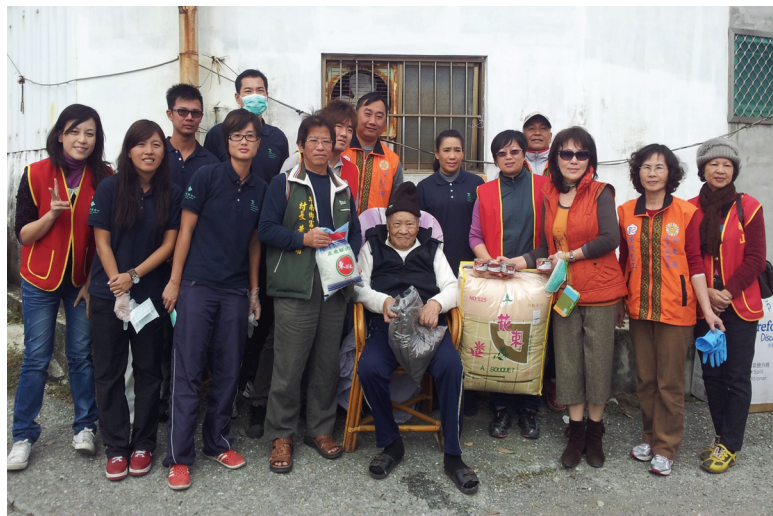
榮服處結合社福團體訪慰單身獨居榮民

以各縣市榮服處作為地區資源整合平臺 ，連結會屬安養、醫療、農林機構與地方政府、民間社福團體、地方村/里長、幹事及國軍、海巡、警政、郵務、戶政等單位。執行榮民就學、就業、就醫、就養等輔導服務工作。 建構具主動性、即時性、系統性、多元性的服務照顧安全網絡。