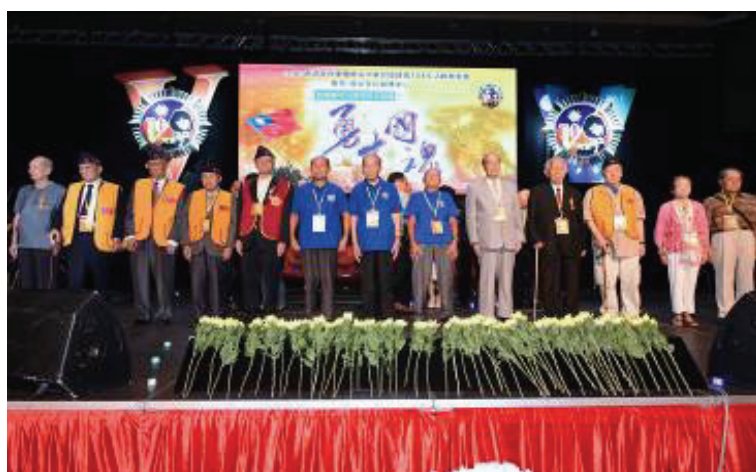
香港榮光會辦理抗戰勝利紀念活動

本會在海外並無編制內之分支機構 ，為服務僑居海外我國退伍軍人， 以歐、美、亞及大洋洲等19個國家成立之42個榮光聯誼會為平臺 ，協助 服務旅居海外之退伍軍人及眷屬 。鼓勵積極參與僑居地各項退伍軍人相關活動，同時與各國退伍軍人組織保持良好互動，維繫情誼。