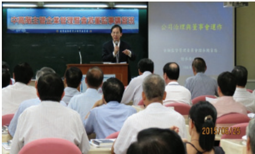
本年6月舉辦中高階主管企業管理暨董監事講習班

25家主要投資公司 近3年（101-103年）平均投資報酬率12.45%。本年迄今，營收241億7千萬餘元，稅後盈餘17億6千萬餘元，依持股比率可認列投資收益約5億7千萬餘元， 經營績效尚稱良好 。安置榮民/眷1,102人， 安置率36.14% ， 超過平均持股率32.72% 。