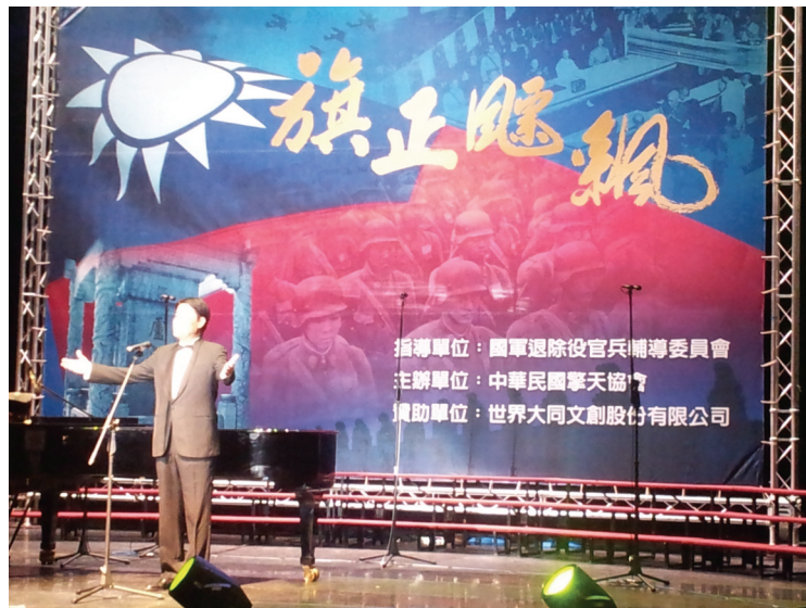
擎天協會舉辦抗戰勝利紀念音樂會

為了賡續輔導整合、活化各退伍軍人社團，未來將由各榮服處建立網路社群溝通管道，使之成為協助政策溝通及服務退伍軍人的支持力量與後盾。