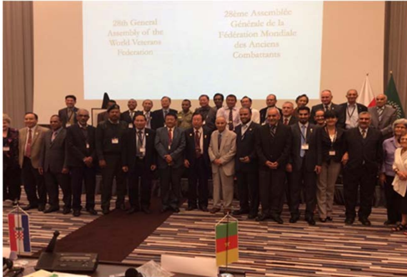
104年9月中華退協高理事長仲源先生(前排左8)及本會代表(後排左1)出席世界退伍軍人聯合會大會

長仲源先生，當選亞洲常務理事會理事長兼世退會副總會長，有助於與各會員國維繫良好關係。