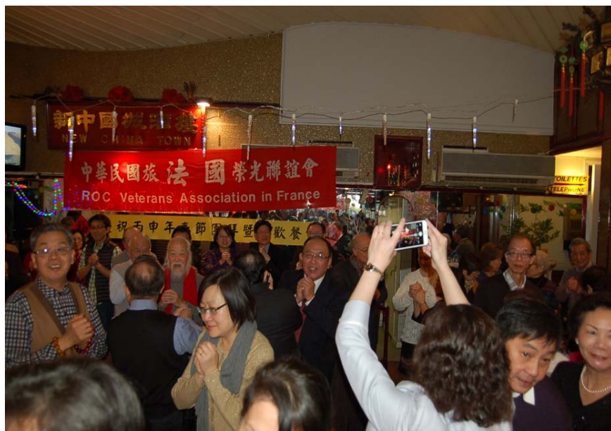
105年1月31日法國榮光會於巴黎酒店舉辦春節團拜暨團圓餐會情形

本會在海外並無分支機構，為服務僑居海外我國退伍軍人，在全球20個國家，輔導成立43個海外榮光聯誼會(簡稱榮光會)；其中南非榮光會於104年10月31日(榮民節)召開成立大會。除協助服務旅居海外榮民/眷，更是僑胞支持政府的重要基石。