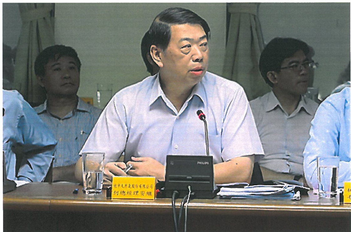
本會 108 年第 1 次廉政會報實況-3