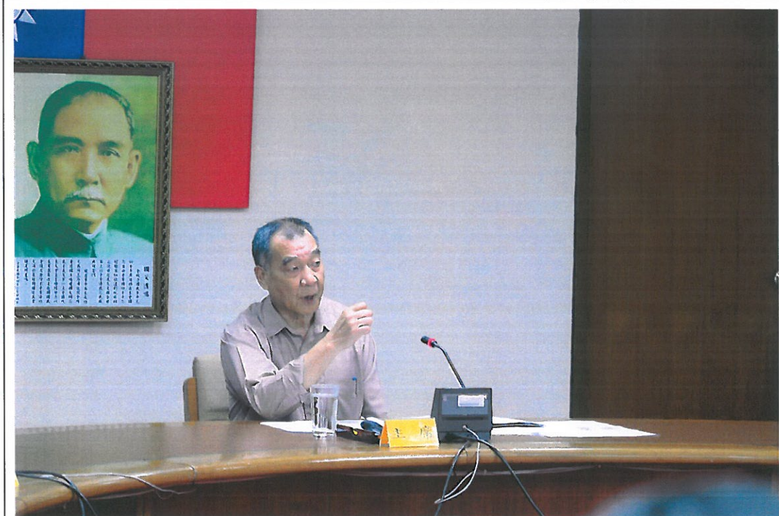
本會 108 年第 1 次廉政會報實況-1