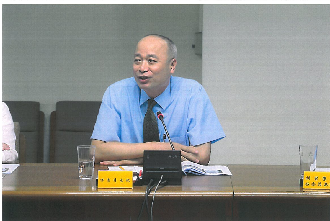
本會 108 年第 1 次廉政會報實況-4