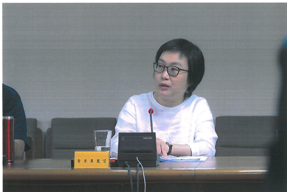
本會 108 年第 1 次廉政會報實況-5