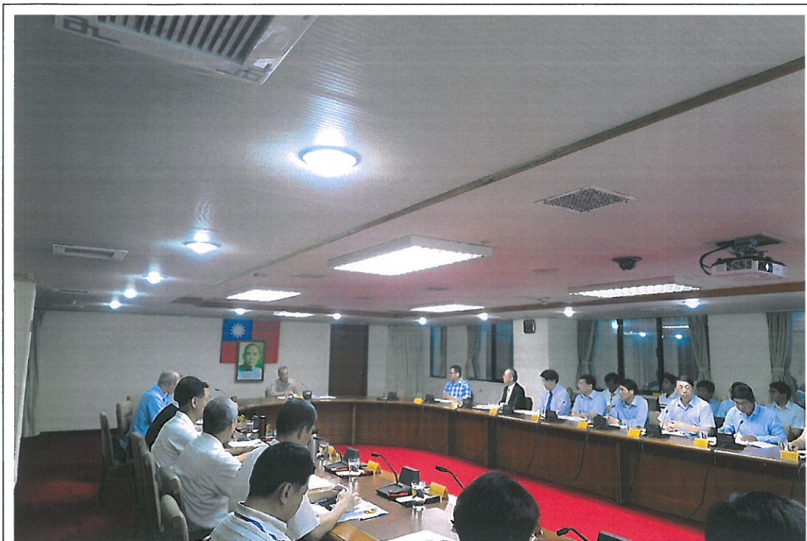
主任委員主持本會 108 年第 1 次廉政會報