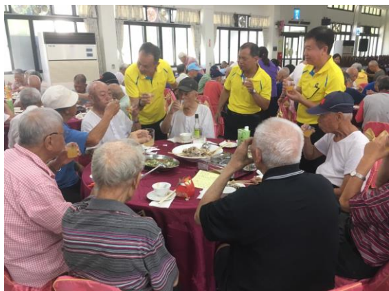
秋節住民及家屬聯誼餐會

本家於 9 月 11 日舉辦秋節會餐及家屬聯誼懇談會，邀請家屬至家區相聚歡慶中秋。除在養心園辦理「陽光、歡唱、品茗」戶外卡拉 OK 活動，讓住民與親友共同歡唱。另提供「代訂桌餐」，讓住民與親友於秋節團聚享用豐盛的美食。還邀請「老鬍鬚薩克斯風樂團」演奏優美經典歌曲，現場歡慶熱鬧，氣氛溫馨融洽。