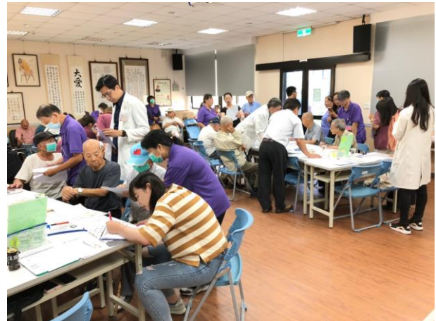
中榮醫師為住民解說及辦理簽署

衛生福利部國民健康署高齡友善健康照護機構認證委員，9月27日蒞臨本家進行認證實地訪查，由主任率各級主管及主要業管接待與簡報後，即對本家各項服務措施及照顧長者做法進行驗證。