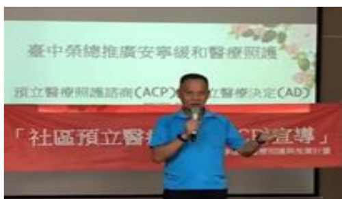
預立醫療照護諮商宣導