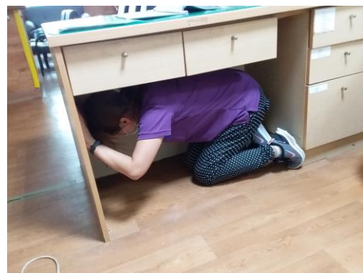
地震災害防救演練講習