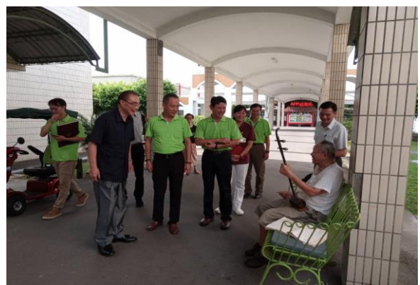
馮主任委員與住民話家常