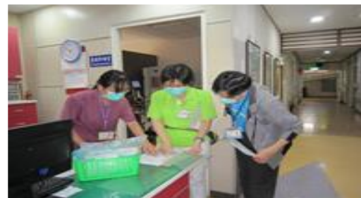
108 年度感染管制查核