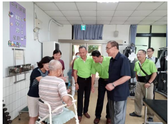
馮主任委員關心住民復健情形