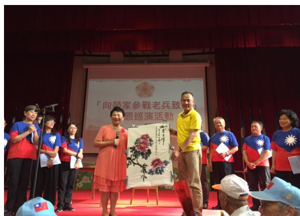
書畫家包容女士贈予本家畫作