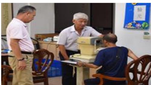
108 年度榮民配鏡活動