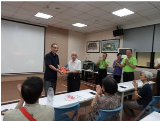
馮主任委員致贈秋節加菜金

馮主委也感謝榮家同仁的努力與付出，使住民們都能受到最用心的服務與照顧，也期勉榮家同仁們，能持續做好服務照顧工作，讓住民感受如家人般的溫馨照護，營造快樂的頤養環境。