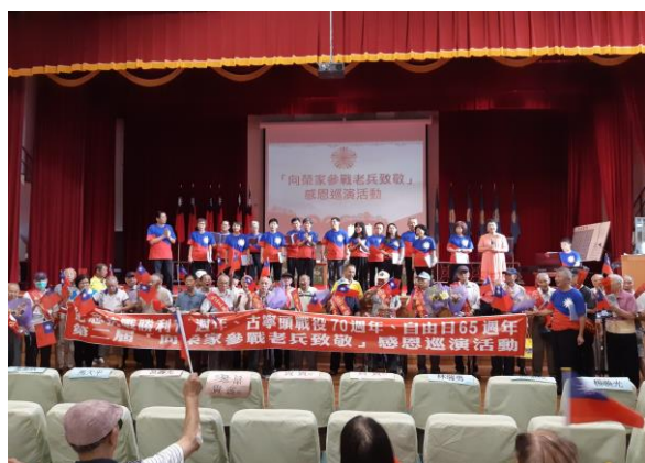
協會及演出人員與住民合影

台北市感恩協進會及社團法人全球華人紀念抗日協會，於8月29日至本家舉辦「向榮家參戰老兵致敬」感恩巡演活動。協會人員向參加抗戰、古寧頭、登步島戰役及韓戰反共義士的老兵們獻花、掛彩帶表達敬意，表彰其對國家的貢獻。