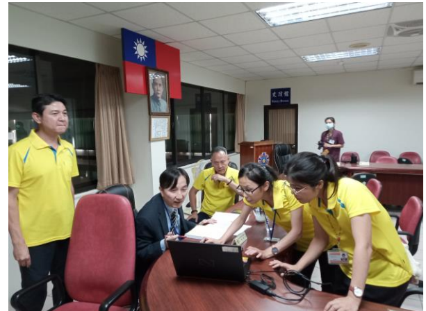
委員查核各項業務