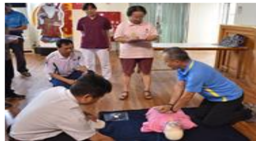
108 年度 CPR+AED 在職教育訓練