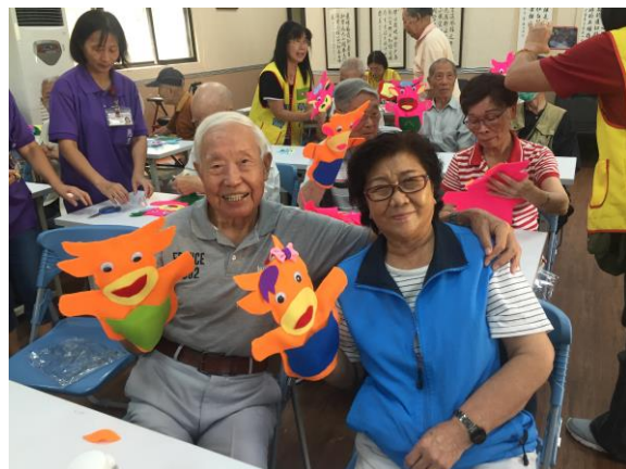
住民們動手作牛牛布偶