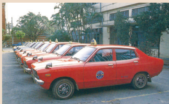
早期榮民計程車外貌。

另為輔導榮民（眷）就業服務，促進交通運輸產業發展，振興社會經濟，減低失業人口，68年10月18日奉准於臺北市榮服處設立「榮民計程車業服務中心」（簡稱榮車中心），並於臺北、新北、桃園、新竹、臺中、臺南、高雄等7個地區設立分中心，其組成均以榮車員（司機）及自備計程車