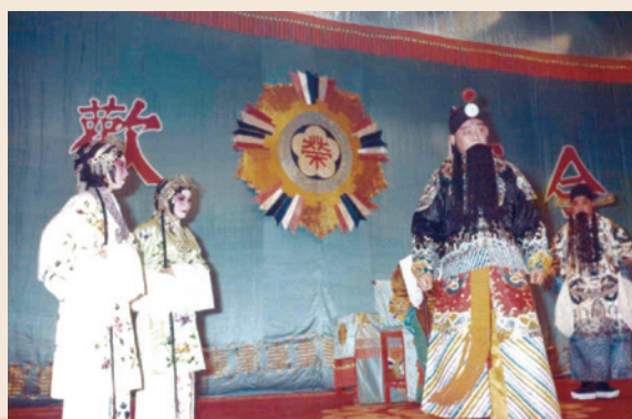
榮光國劇隊公演劇照。

67年7月1日再更名為「榮民文教服務組」，持續文教巡迴宣慰服務。迨政府開放大陸探親後，榮民往來兩岸不絕於途，化解了老兵近40年的鄉愁，走過近30年的「文教工作隊」，亦於77年10月16日裁撤，曲終人散，熄燈落幕。