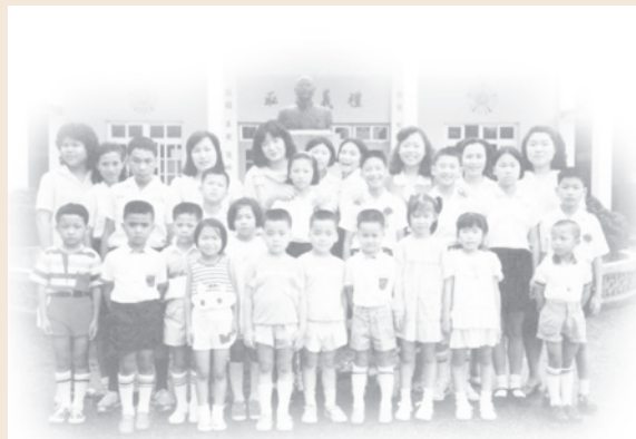
設於臺東的「慈母育幼院」師生合影。

85年「兒童福利法」頒行，中央主管機關為內政部，慈母育幼院階段性任務完成而裁撤。期間歷經35年，培育無數院童，散布社會各角落，貢獻心力。正是：育幼慈暉，永照人寰。