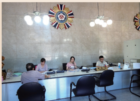
輔導會服務臺受理榮民（眷）服務。

業務職掌：偶發特殊事件、時限急迫案件、急難救助案件等。處理原則：即到即辦、協調連繫，催辦管制，通權達變，情理法兼顧，婉言疏導，耐心說服。