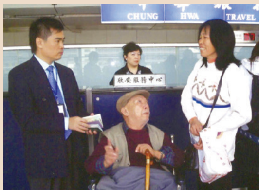
欣安服務中心於香港赤鱗角機場服務返鄉榮民。

香港欣安服務中心，自民國79年5月8日奉行政院核定成立，為榮民（眷）中轉港澳赴大陸地區探親，遭遇困難時，採無間隙、走動方式服務，除獲榮民（眷）認同，更獲得當地陸委會駐港、澳單位一致肯定，可說是成效斐燦。97年因兩岸政策需要實施小三通及嗣後開放兩岸直航，兩岸關係不斷演進變遷，該中心與陸委會業務性質重疊，奉行政院核定，自民國100年1月1日起，歸併陸委會香港事務局及澳門事務處，力求能充分整合，為國人發揮最大服務效能。