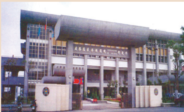
巍峨宏偉的桃園縣榮民服務處。

各縣市自謀生活榮民聯絡中心，係民國47年10月1日成立臺北榮民服務處、臺中（轄苗栗縣、臺中縣市、彰化縣、南投縣、雲林縣、嘉義縣、澎湖縣等8縣市）、臺南（轄臺南市、臺南縣、高雄市、高雄縣、屏東縣等5縣市）、花蓮（轄花蓮縣、臺東縣等2縣）等4個聯絡組演變而成。