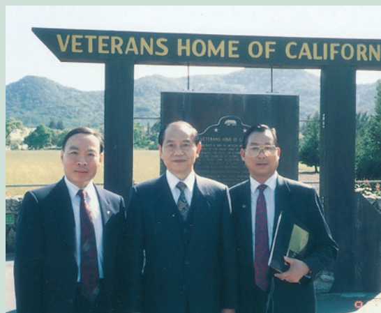
時處長(左1)於82年7月參訪美國加州退伍軍人安養中心時留影。

時處長任職第二處期間，適值本會執行退除役官兵第2階段輔導工作，甚多作為，如爭取就養安置員額，調整就養榮民生活給與，發還早年部分低階官兵申請安置就養時繳交之半數退伍金，規劃支俸榮民自費安養與養護、榮民夫婦自費安養，辦理就養榮民進入大陸地區定居，設置馬蘭榮家慎修養護中心，收容養護社會中低收入戶老人及身心障礙者等，成效顯著。