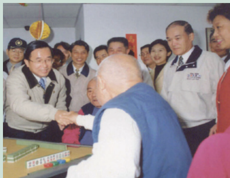
商先生（右2）陪同陳總統訪慰岡山榮家榮民。

商處長任內積極督導榮民就養業務，諸如91年策辦安養機構首次評鑑，績效顯著；督導92年各安養機構防範SARS疫情各項措施，成效深獲行政院肯定；指導辦理各安養機構照顧服務員基礎訓練及進階訓練，有效提升安養機構服務人員素質；另督導「榮家家區環境總體營造中程計畫」現地會勘、簡報、評估及研討會等，成效顯著。