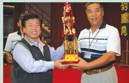
金處長（左）於98年度中區榮民才藝競賽頒贈得獎人員獎座。

金處長任內配合政府組織再造之推動，積極規劃安養機構組織功能精實化，並配合政府推動長期照護服務，結合地方政府長照資源，規劃佳里榮家成立「失智教研中心」，有助於精進本會失智照顧服務品質，並於八八水災期間協助政府緊急提供榮家床位安置災民581人，同時廣續推動「安養機構功能調整暨資源共享總體營造中程計畫（98-102年）」，修正就養安置辦法及增訂輔導條例第16條第3項等法規，放寬就養條件及確保就養給付不得作為扣押、抵銷、供擔保或強制執行之標的等，以期提供榮民優質頤養環境，並於法制面落實對榮民權益之保障。