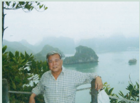
李處長退休後生活留影。

李處長任內重大措施，諸如持續調整就養榮民生活給與2次，有效照顧榮民生活；研訂「榮民安養設施改善中程計畫」（88至93年度），逐年編列預算整建改善，以符榮民長遠需求；修正「輔導條例」暨施行細則，將參加823戰役之義務役官兵及金馬民防自衛隊納入實施照顧範圍。