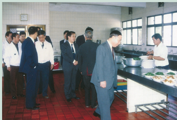
時處長（右2）參觀岡山榮家榮民新建餐廳伙食。