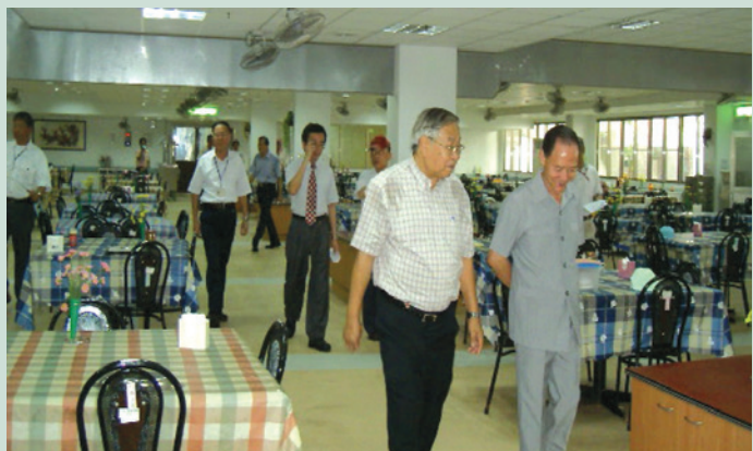
評鑑小組至各榮家現場複評。

為提升本會安養機構服務照顧品質，自民國91年起辦理所屬榮家評鑑工作，每次評鑑均參考內政部（現業務移撥衛生福利部）臺閩地區老人福利機構評鑑內容，並外聘專業評鑑委員，結合本會相關規定及榮家實況實施評鑑，106年7月至9月間結合長照政策辦理長照機構整合計畫第1次榮家評鑑。本會91年至106年榮家評鑑成績優等榮家如下表，歷經多次評鑑，評鑑委員一致認同榮家服務照顧無論在軟硬體上皆有長足之進步。