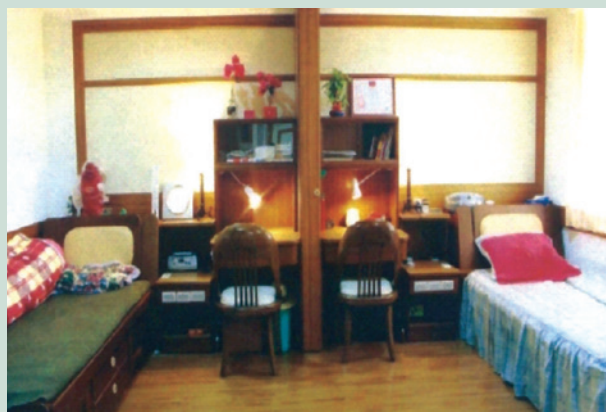
新整建有隱私的雙人套房。

為因應榮民眷屬及安養、養護照顧需要，把握設施人性化、房舍家庭化、庭院公園化、環境社區化要領，訂定「榮家家區環境總體營造中程計畫」（93年至96年），奉行政院核定編列預算21億餘元，分4年將桃園、新竹、彰化、岡山、花蓮、馬蘭等6所榮家，全面改善為雙人有隱私套房，各項生活及休閒設施（備），總計完成新（整）建3,104床，使年老榮民及眷屬，