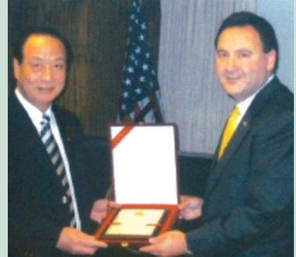
楊先生率團參訪美國退伍軍人事務部，致贈該部主管醫療次長博林博士紀念牌。

楊處長任內積極協調第2階段「榮家家區環境總體營造中程計畫工程」，使該項工程順利招標與施工；另依據本會「醫養合一、融入社區」政策，以臺東榮院遷入馬蘭榮家，建構「馬蘭健康社區」為示範基地，獲行政院謝前院長嘉許，列為六星計畫之模範。檢討修訂「就養安置辦法」，自95年1月1日起修正施行，合理擴大照顧榮民（眷）；另研修「輔導條例」施行細則第2條，將志願役士兵服滿現役10年始能獲得榮民資格，對募兵制產生正面效益。