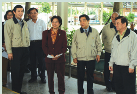
朱處長（左1）陪同劉副主委（右3）主持安養機構98-102年中程計畫跨部會現地會勘及協商會議。

朱處長任內積極配合行政院推動各項社會福利政策，對弱勢族群之照護、充實安養機構設施設備及增設失智老人照護專區，充分將安養護資源與民共享，並規劃建構「醫養合一榮家」，整合區域醫養資源，照顧老年弱勢榮民（眷）及民眾，提升安養品質，並與社區資源共享。