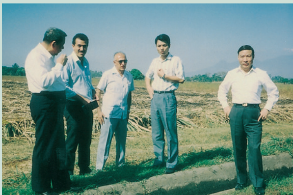
時處長（右1）於82年3月參訪薩爾瓦多政府退伍軍人農場。