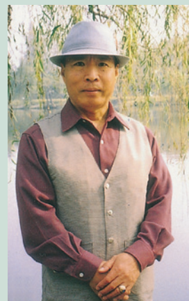
時先生遊覽大陸揚州「瘦西湖名勝」。

時前輩回顧以往，認為榮民安養係持續性之工作，隨著榮民高齡老邁及政府組織再造，本會應前瞻因應，並將社會變化因素納入整體考量，以持續嘉惠退除役袍澤。