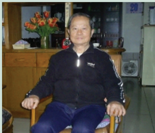
梁先生退休後生活安祥愉悅。

梁前輩個性剛直，夫婦育有2子1女，均已成年，家庭生活和諧美滿，享含飴弄孫之樂；退休後喜好寫作，將軍中生活及工作感言彙編「苦旅爪痕」一書，並常於本會榮光周刊及老兵天地雜誌投稿，擔任某季刊編輯，偶寫短篇雜文自娛娛人，定時運動與旅遊習性，故保持健康身體精神愉快。