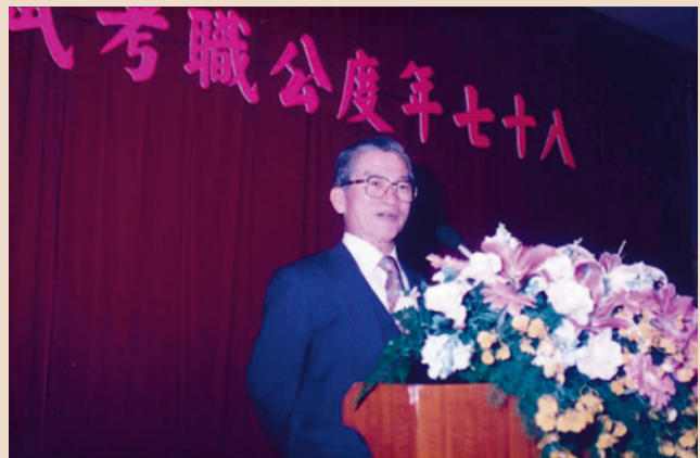
黃副主任委員鏡峰主持87年度公職考試輔導班開訓。

輔導會為強化榮民就業知能，於民國80年度起利用松柏新村舊址，自行規劃開辦榮民進修教育班，利用夜間及週末開設一般行政、人事行政、土地行政、財稅行政、會計審計等公職考試輔導課程，及辦理「大樓管理幹部儲備訓練班」加強樓管人員管理知識。另亦委託資策會辦理資訊教育基礎