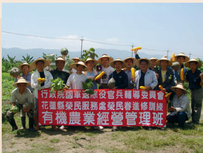
98年度花蓮縣榮服處有機農業經營管理班。

由於預費來源有限，辦理初期係以短時數之在職進修訓練為主，並以輔導考取證照、提升職能專長為目標。其後因應青壯退除役官兵就業需求增加，及立法院、審計部等監督機關要求之下，職訓任務調整以輔導就業為主，課程以長時數、職能導向設計，以開辦多能訓練為目標。