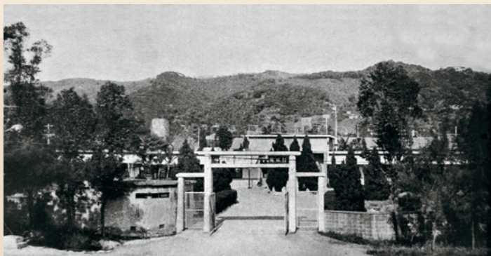
民國64年1月14日「職技訓練中心」奉行政院核定成立，此為當年之校門。

民國64年1月，輔導會為積極加強榮民及其子女之職訓工作，並配合政府推行職業訓練之整體計畫，乃在桃園成立「職技訓練中心」，專責辦理退除役官兵職技訓練。86年7月與板橋專教中心合併，更名「訓練中心」，併入職員工在職訓練業務，93年奉核解除該