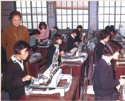
高商實驗班中文打字實習。

輔導會於民國65年間遵照當時任行政院院長蔣經國先生「照顧小榮民」之指示，經協調有關單位支援，先委託省立桃園農工職業學校（現為國立桃園高級農工職業學校）利用輔導會桃園職技訓練中心設施辦理「高工實驗班」，