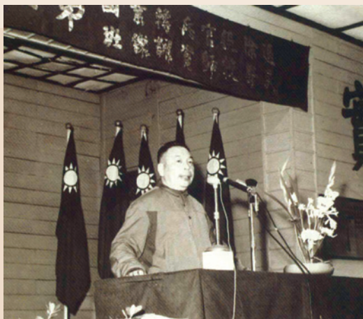
蔣主任委員主持師資訓練班開訓典禮。

輔導會為輔導退除役官兵轉業教育工作，於民國48年12月委託省立花蓮師範學校（現改為國立東華大學美崙校區）辦理師資訓練班21期，53年7月委託國立臺灣師範大學辦理國文專修科11期；64年9月改制為國文學系辦理2期；69年起委託省立臺北師專（現為國立臺北教育大學）辦理二年制師專班5期，總計4,511人，畢業後均分發全省各國民小學任教師，上山下海獻身基層教育，尤以服務偏遠離島地