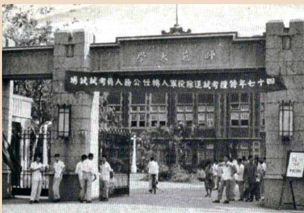
民國47年退除役軍人轉任公務人員特考師大試場。

輔導會在退除役官兵就業輔導方面，係採取自創事業機構安置榮民，以及洽請政府機關學校與公民營事業機構提供職缺輔導榮民就業等兩項途徑辦理，而在轉業至機關學校任公職，因無公務人員任用資格，於民國47年洽商考試院舉辦退除役軍人特考，鼓勵退除役官兵進修，取得公務人員任用資格，增加就業機會。