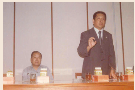
席處長於座談會致詞。

席處長湖南衡陽人，民國18年12月21日生，61年2月到會服務，63年擔任就學科科長，65年10月任副處長；78年4月由第三處副處長調陞為處長，84年1月屆齡退休。任內重要措施有：爭取職員員額，申辦80、82年退除役特考；策訂退除役官兵介紹就業與人力培育實施計畫；訂定及推動「拓展民營企業就業管道實施計畫」；協助國防部規劃「國防人力移轉培訓方案」；推展退伍官兵「生涯規劃」活動等等。