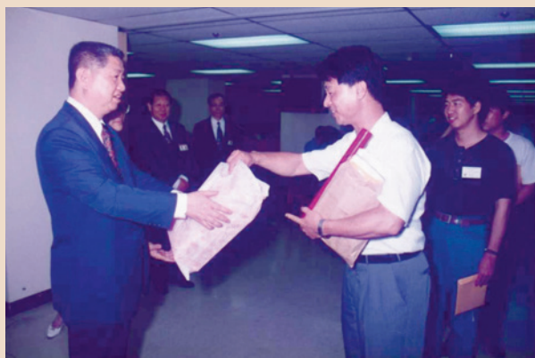
楊主任委員頒發86年度應屆畢業生畢業證書及致送紀念品。

民國63年輔導會在輔導就學工作上，由消極的輔導轉為積極的計畫培育，商請教育部同意，指定國立臺北工專、高雄工專、臺北商專、臺中商專、屏東農專及中國海專等六所工農商海事專科學校，專案由輔導會甄選退除役官兵就讀並取得學籍。同時並逐漸將原來偏重文法科系之教育，轉向以理工科為主之專技教育，此項轉