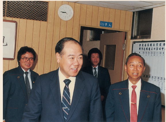
鄧處長於民國75年2月巡視高勞中心業務。

鄧處長河北任邱人，民國17年7月17日生，陸軍官校23期，76年1月由本會第二處轉調第三處處長，78年4月調臺北榮民技術勞務中心主任。82年於臺北榮民技術勞務中心主任屆齡退休。任內規劃推動榮民轉業機關學校工級安置作業，授權各縣市榮民服務處視實需辦理，有效紓解安置困擾；督導臺北、高雄榮民技術勞務中心業務，研擬業務劃分原則及兩單位聯誼交流，平息雙方爭取業績爭議；悉心擘劃榮民大陸探親募款案，本案募款計5億餘元，受惠榮民計2萬4,000餘人；爭取轉業職員員額，申辦退除役特考並主持策劃督導辦理78年退除役特考試務工作。