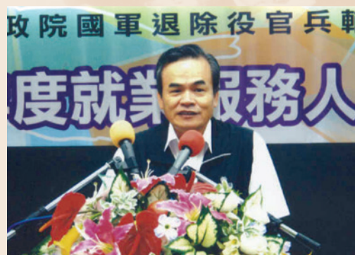
戴處長於民國96年就業服務人員講習會致詞。

戴處長福建莆田人，民國36年11月4日生，海軍官校58年班，76年9月由海軍後令部後管中心副主任外職停役到會服務，95年2月由本會第五處處長調任第三處處長，96年9月1日調陞副秘書長，97年8月轉任欣屏石油氣股份有限公司董事長，101年10月於泛亞工程股份有限公司董事長任滿離職。任內配合行政院「大溫暖—照顧弱勢」政策，於95年規劃完成「榮民外籍及大陸配偶照顧輔導實施計畫」；完成編印創業有成榮民典範專輯「重返榮耀」乙書，藉以提供有創業意願之榮民（眷）學習效仿；為促進青壯榮民順利就業，推動「菁英榮民職場體驗計畫」、「無職業榮民生活狀況與再就業需求」專案調查；修訂退除役官兵及眷屬參加大專校院進修補助作業規定，提高退除役官兵補助上限為1萬元，並增列無業、遺眷等加強輔導對象，予以覈實補助，鼓勵及扶助順利完成進修，增進學能，以促進榮民（眷）就業競爭能力。