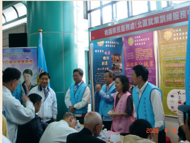
98年度就業媒合活動。

輔導會鑑於青壯退除役官兵就業需求增加，及國內失業問題日趨嚴重，為協助退除役官兵順利就業，於民國88年5月底完成職訓中心及各縣市榮服處「就業服務工作站」之設置，採專人專職辦理就業服務工作。因應業務需要，97年試辦，98年起正式將「就業促進員」納入就業服務站，協助就業服務工作推展。