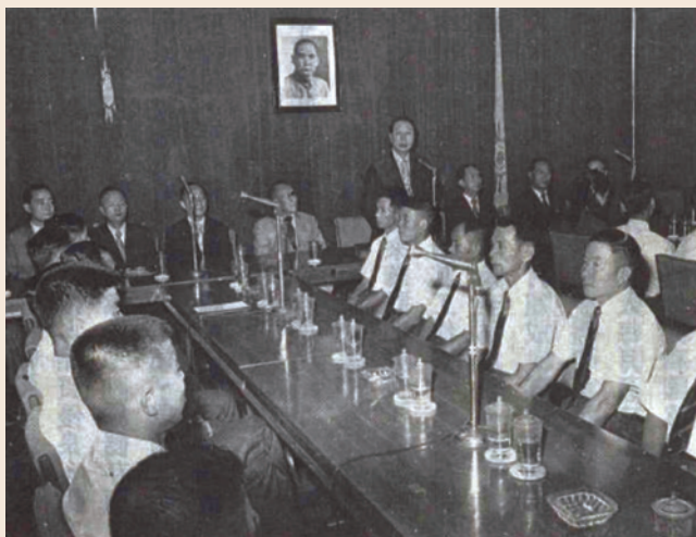
趙主任委員訓勉我赴諾魯技術人員茶會。

預留員缺，安置就業。同時為擴大就業輔導範圍暨配合國家整體外交，亦向海外地區拓展，甄選具有專長技術人員，應聘至國外友好國家工作。