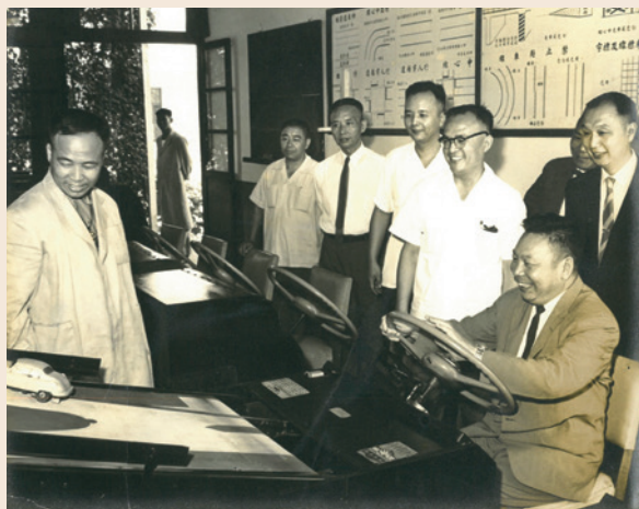
蔣主任委員試用駕駛人員訓練班駕駛教學儀器。

例如委託訓練部分，委託早期公路總局辦理汽車駕駛訓練班，訓練大客車駕駛；又如，委託省立高雄工業專科學校辦理瓦斯配管訓練班；委託臺北商專辦理會計人員訓練班。又如自辦訓練部分，新竹就業講習所辦理皮鞋加工；彰化就業訓練中心辦理木工廠；臺北就業訓練中心辦理果樹種植、蘭花培植；花蓮就業訓練中心辦理豆腐製作訓練；反共義士輔導中心辦理紅磚製造等，輔導退除役官兵謀得一技之長，順利與社會銜接。惟因時代變遷，上述班隊均已停辦，就業講習所及就業訓練中心亦已轉型為榮民安養機構。