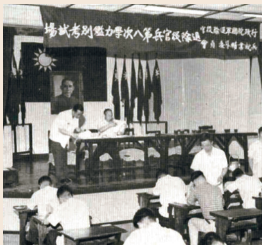
第八次學力鑑別考試。

為協助有志升學退除役官兵因戰亂而缺乏合法學歷證件，致無法報考各級學校之困難，輔導會曾商得教育部同意，自民國46年起迄67年止，於每年暑假前由輔導會與教育部會同有關機關共同舉辦「退除役官兵學力鑑別考試」共計23次，是項考試分高中及初中畢業兩種程度，歷年共計錄取高中及格者5,060人，初中及格者226人。後因大陸來臺之退除役官兵年事漸長，再升學者稀，在臺入伍依法退除役官兵，幾已具高中學歷，故報考退除役官兵學力鑑別考試之人數逐年銳減，68年起暫停辦理。