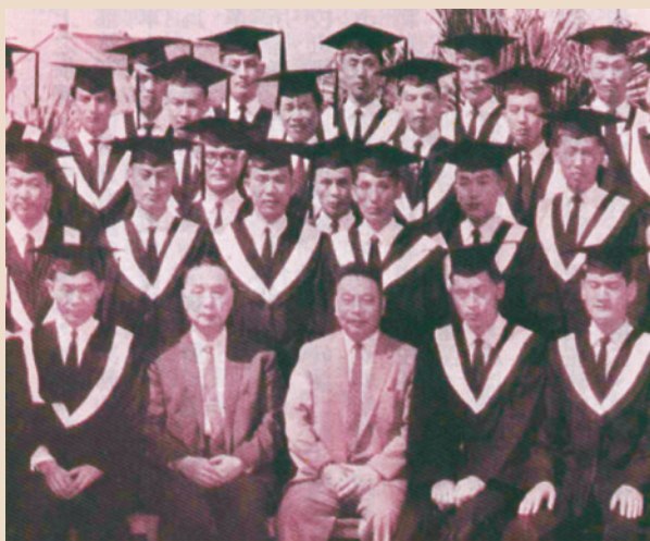
蔣主任委員（前排中）暨趙主任委員（前排左2）與大專院校畢業退除役官兵合影。

輔導會對退除役官兵的就學輔導工作，自民國46年起，經由辦理退除役官兵學力鑑別考試，協助取得高、初中學力證明後，據以參加升學或其他有關之考試；同時會商教育部訂頒「退伍軍人報考專科以上學校優待辦法」（民國93年1月14日修正名稱為「退伍軍人報考高級中等以上學校優待辦法」），對於參加升學考試人員，給予加分優待錄取。並為鼓勵在學人員勤奮向學，辦理退除役官兵就學獎助，期使就學人員能在輔導會協助下，順利完成學業。