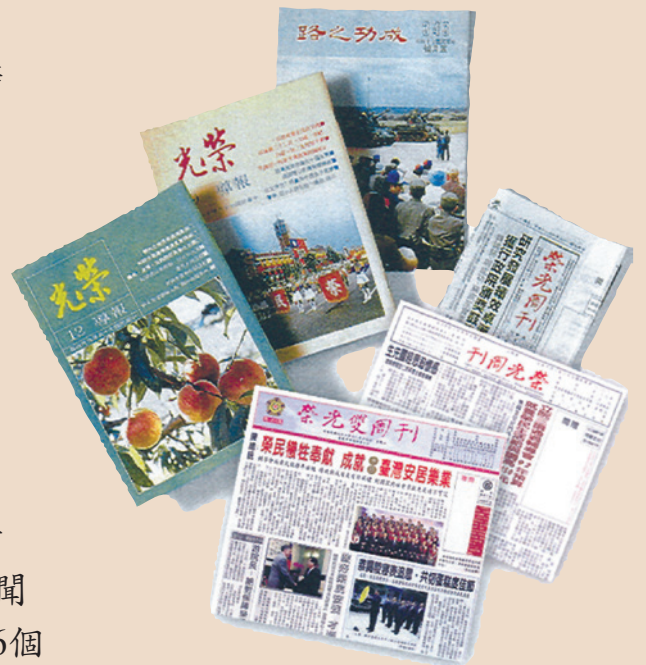
由華欣文化中心編印之成功之路、榮光報導、榮光周刊、榮光雙周刊等刊物。

93年1月7日，建置「榮光電子報」，與「榮光周刊」（第1972期起）同步啟用，以因應e化時代脈動與讀者實際需求，並自該期起，將原為1張四開新聞紙規格之周刊擴增為對開、四開各1張，6個全彩版面（重點新聞、焦點新聞、交流傳真、訊息短波、生活萬象、榮光副刊），同時更名為「榮光雙周刊」。因應時代變遷及榮民漸趨年輕化，自96年1月11日第2309期起再度改版，原第三、四版合併為第三版「榮