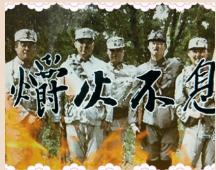
「燭火不息——榮民的生命故事」微電影。