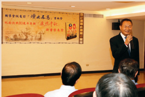
首映暨新書發表會。

為紀念抗戰80週年，本會特別於民國106年10月編製「紀念對日抗戰八十週年專輯」——《英烈千秋》，及製作「燭火不息——榮民的生命故事」微電影，