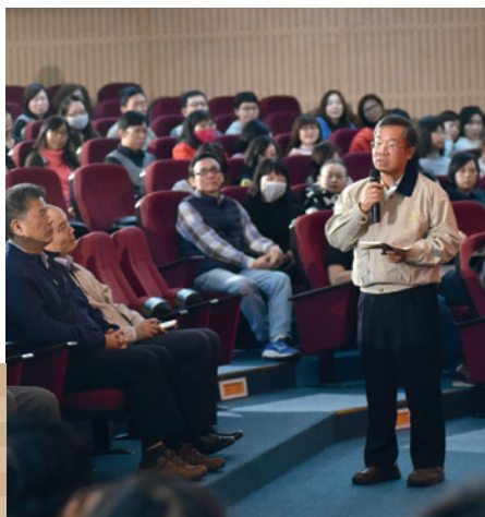
簡處長（中站立者）於本會職員工座談會中經驗分享。