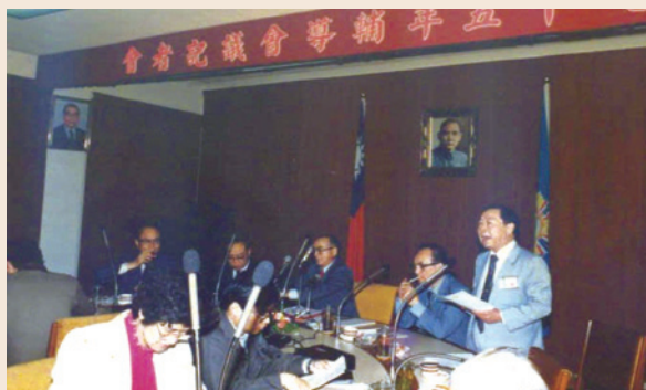
劉處長（右1）參加民國75年輔導會議記者會。

劉處長民國16年2月9日生，陸軍補給管理學校（聯勤軍需講習會8期）畢業，71年1月1日國防部部長辦公室上校副處長退伍。任內積極執行榮光大樓興建計畫與流程等相關作業，終使興建工程於74年下半年正式開工，76年下半年次第遷入；而在國會聯絡組尚未組成前，在有限的資源下，負責立、監兩院相關事務之協調聯繫，對於本會政務推展、預算爭取等，卓具貢獻。另於媒體公關工作，亦汲汲營營，不遺餘力，使得本會各項施政與績效，均得以及時、正向報導，對於本會形象塑建，甚有助益。