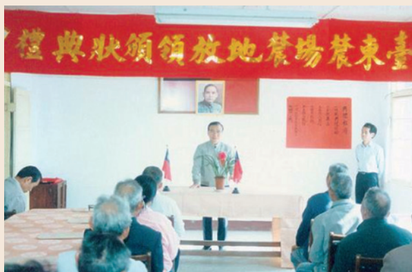
民國79年1月許前主任委員前往臺東農場頒發領土地權狀。

有鑑於農場土地原為河川、砂礫等不毛荒地，經安置之場（墾）員二、三十年胼手胝足，辛苦開墾而成良田，場（墾）員對其配耕土地均有深厚感情。為協助渠等取得配耕土地所有權，經報奉行政院民國77年2月27日臺77臺防字第35176號函修正核定之「本會開發農地放領辦法」，對進墾滿10年且有繼續從事農墾意願之農場場（墾）員放領其原配耕地，使渠等能靈活運用土地、機動調整經營方式，提升經營層次，增加營運收益，改善生活品質。此項工作為政府的一大德政，深獲榮民場員感激。迄今，本項業務因配合行政程序法之頒布，廢止放領辦法而停止辦理。其間，計完成放領者4,011人。