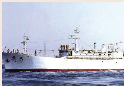
海開處之遠洋鮪釣漁船。

先生亦輔導漁殖管理處利用桃園水利會蓄水池繁育淡水魚類及魚苗；利用彰化鹿港沿海之海埔地，輔導榮民養殖蛤蜊、淺水魚類及鰻苗；利用處部養魚池整修供人垂釣，開發休閒漁業相關業務。並督導漁殖管理處辦理國軍官兵副食品漁貨供應業務，由於所供應漁貨品質優良、價格公道，深獲國防部肯定。