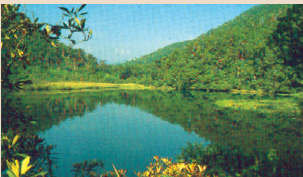
生態維護良好之鴛鴦湖景觀。

民國50年榮民森林保育事業管理處（簡稱森保處）開發林道時，即重視環境生態保育，為保護珍貴的自然資源，與臺灣省林試所合作，完成鴛鴦湖四周沼澤地2.2公頃之調查規劃，全面闢為保護區，75年再依政府「文化資產保存法」，列為自然保留區，並奉核定為管理單位，僅供學術研究及生態觀察，對外不開放，被譽為國內保護最完整之自然保護區。