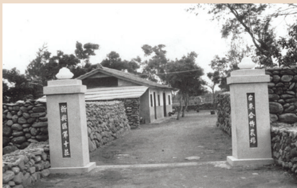
臺東農場新興區第十農莊（攝於民國53年）。