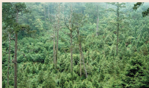
棲蘭山林區枯立倒木移除後，次生林密佈。

森保處所轄棲蘭山林區檜木天然林林相老化，枯死風倒頗多，立木稀疏、透光性強，造成下層灌木雜草叢生，檜木種子於下種時無法著地萌芽生長，致使林中幾無中、下層檜木幼林存在，檜木林於生態系演替中呈現劣生性演替，淪為非極盛相樹種，有賴人為力量加以輔助維護，方能於未來的演替中仍維持優勢。森保處遂於民國72、73年度試辦整理計畫，整理後林區林下檜木幼苗密佈。經學者專家及林業管理機關多次現場勘察，咸認枯立倒木移除能有效達成老化檜木林的林相更新，所營造之複層立體林相，對水土保持、國土保安、水源涵養等具正面效益。緣此，自75年度起編訂第一期7年整理計畫及第二期6年計畫報奉核定後執行；期間經國內外學者專家50餘次蒞臨現場實地勘察、參訪評估，普獲正面肯定，但自87年部分環保人士質疑學者專家之專業意見，主張全面封山，任其自然演替，行政院為避免爭議耗費過多之社會成本，遂核定枯立倒木整理作業自88年7月1日停止辦理。