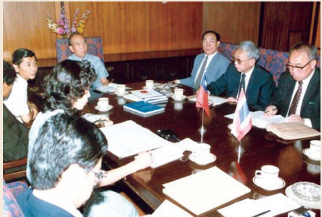
民國73年間蕭處長(右2)訪問泰國，出席泰山地計畫檢討會議。

蕭處長湖南省湘鄉縣人，民國8年2月26日生，畢業於國立中正大學農藝系，並赴美國伊利諾大學進修，致力於農業技術、種子繁殖及農業機械之研究推廣，曾派駐利比亞農耕隊、駐模里西斯農耕隊隊長，於任職中華農工技術顧問公司副總經理時，調本會第四處副處長，72年12月調陞處長。任內辦理福壽山華岡農地水土保持工程，改善福壽山農場生產條件；並依據適地適作原則，規劃各類農作生產專業區，及推廣農漁牧綜合經營，提升產品競爭力；策劃武陵、清境及嘉義農場興建國民賓館轉型發展觀光事業；積極推動農業技術援外，並與國際進行農、林、漁業產銷合作，改善事業經營體質。