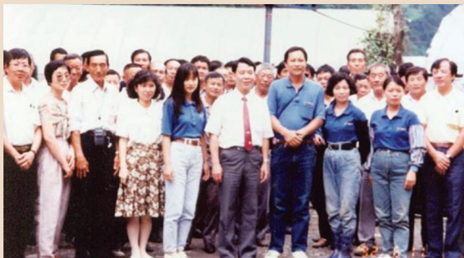
民國79年推動團結致富方案，農場及場員參訪臺一種苗場。

因應社會經濟結構變遷，農業收益相對偏低情況，為提高農場場員所得，進而凝聚向心，鞏固團結之目的，本會於民國79年—82年間推動「團結致富」方案，依據各農場特性及條件，律定其研究項目，向高經濟價值產業（精緻農業）方向發展，透過多角經營、技術指導、開拓市場、統一運銷四大工作，期使生產與銷售一貫作業，並擇具有天然資源之農場，發展旅遊觀光事業，冀以場員共同參與經營，共同享有成果之理念，有效提高場員所得、改善生活品質。