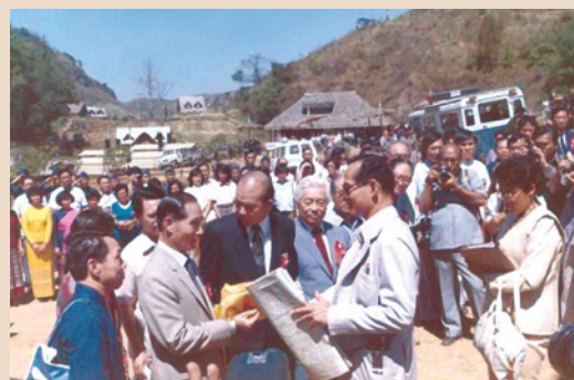
民國71年3月鄭前主委為元（前排左2）訪問泰王山地計畫農場，泰王蒲美蓬（前排右2）親自接見。

62年本會應泰國請求，支援泰國北部山區農業發展計畫，經陳報行政院核准，由本會成立技術服務團前往協助，由於我工作人員努力負責，工作成效深受泰國朝野及泰皇之讚賞；該項計畫成功以高經濟價值之農作物取代罌粟為全人類造福，普獲國際社會之肯定，並於1988年獲得麥克塞塞國際合作獎，為本會爭取莫大的榮譽。