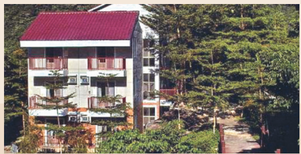
臺東農場東河分場。