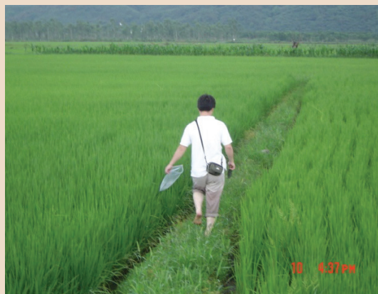
長良有機專區，有機稻生長情形。

為營造優質環境，農場爭取水利及水保單位補助經費辦理農水路改善，本會同時著手修訂符合有機農業契約規範及辦理有機農業訓練班，加強委營戶有機栽培專業技能。