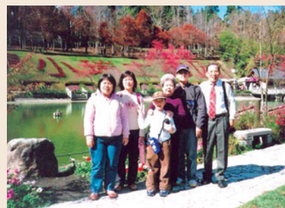
林處長（右1）全家於清境農場小瑞士花園。

林處長福建省永春縣人，民國22年12月1日生，畢業於陸軍官校27期，三軍大學指參學院正規班、戰研班，任職陸軍總司令部後勤署副署長時，調本會高雄農場場長，84年調任第四處處長。任內積極推動農場轉型發展休閒農業，辦理武陵農場宜蘭分場清水果園、臺東農場長良地區及屏東農場高雄分場等3處發展觀光休閒之可行性評估，其中屏東農場高雄分場於完成整體規劃及整建工程後，已正式對外營運，宜蘭分場清水果園及臺東農場長良地區，因受整體經濟不景氣影響，暫緩推動；爭取行政院人事行政局將所屬棲蘭、武陵、嘉義及東河等遊憩區列為公務人員休閒活動中心，對於遊憩區之事業經營及推動公務人員旅遊均有正面效益；75年配合行政院農委會依據「文化資產保存法」將森保處所轄大溪事業區之鴛鴦湖374公頃，公告為「自然保留區」，並指定森保處為管理機關，為本會及森保處對生態保育之貢獻，留下見證。