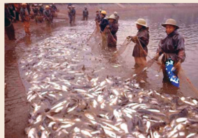
漁殖管理處之淡水魚類養殖。