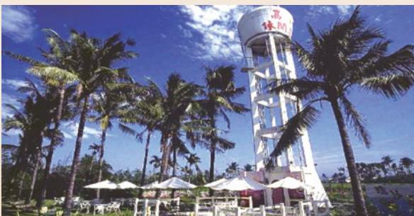
屏東農場高雄分場。