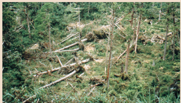
老化檜木須移除，以維持優勢演替。