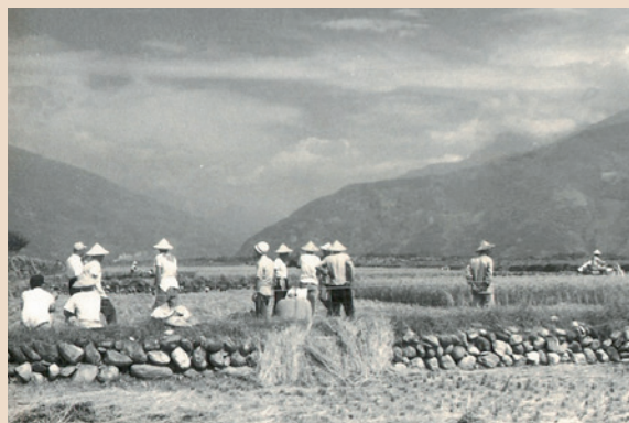
民國55年合耕合營時期，榮民集合下田耕作情形。