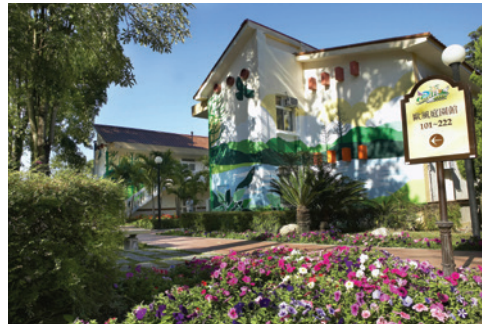
嘉義農場於民國70年興整完成之國民賓館。