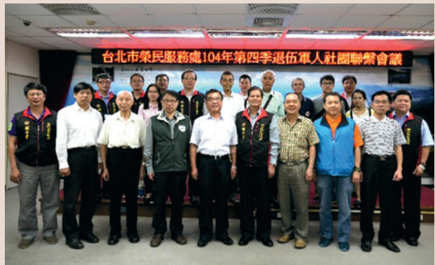
辦理退伍軍人社團聯繫會報。

本處積極聯結退伍軍人社團，每季召開退伍軍人社團聯繫會報，迄今已與27個北市退伍軍人社團建立社群網路及合作平台（FB、LINE等），強化榮民服務，共同維護榮民尊嚴與權益，會報在和諧的氣氛下，由各退伍軍人社團代表針對服務榮民（眷）相關議題相互分享及交換意見，並進一步了解本處各項業務。希望藉由會議，能促進各退伍軍人社團之合作，增加社團的交流及互助，以提升服務榮民之能量，落實「榮民在哪裡，服務到哪裡」的理念。