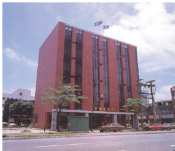
民國74年位於光復北路的榮民服務中心全貌 (74.6)。

榮民服務處成立之初，設籍臺北市16個行政區、臺北縣29個市、鄉、鎮之榮民，總計在10萬人以上，經將本處服務組同仁編組為臺北市、臺北縣、綜合業務三個股，劃分為9個服務區，並設置服務臺，妥善有效處理榮民服務照顧業務，除了屬區域性者為臺北市、臺北縣榮民一般服務照顧工作，屬全面性者係以全國榮民(眷)為對象；視實際需要設置服務單位、舉辦各項福利服務事業。