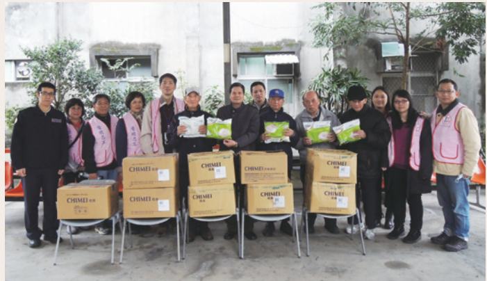
102年12月24日吳興街退舍寒冬送暖活動。

鄭處長除祝福榮民伯伯春節快樂外，特別提醒榮民長輩們注意身體保健，並進行防騙宣導，鼓勵單身年長獨居榮民進住榮家，以頤養天年。