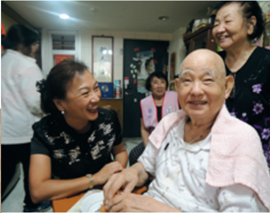
池處長訪視萬華區榮民。

池處長玉蘭，民國50年出生於臺北市，政治作戰學校72年班，國防管理學院決策科學研究所94年班，103年少將轉任公務人員考試及格，104年轉至輔導會任職，曾任國防部軍事發言人室副主任、主任、文教處處長、陸軍委員、簡任編纂，及輔導會就學就業處副處長、南投縣榮民服務處處長等職。