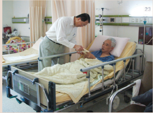
謝處長探視住院榮民。

謝處長本著服務照顧榮民的理念，鼓勵服務體系同仁要累積智慧、愛心和經驗，讓榮民（眷）在各項權益和福利上得到及時、貼心的照顧，並讓渠等受到尊重及感受到榮服處用心服務與關懷。