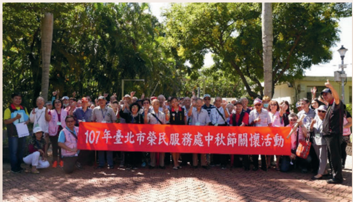
辦理中秋節關懷活動。

107年9月本處辦理「士林官邸秋遊—榮民眷歡度中秋」活動，前往參觀士林官邸，在這棟饒富歷史意義的建築中，大家在導覽員生動的解說下，除了遙想大時代的人事物，對蔣中正總統、宋美齡夫人的日常生活起居更得以一窺堂奧。官邸外花木扶疏的公園景致更讓人感到愜意舒暢，隨著導覽志工漫步其中，聆聽解說園區內的一景一物以及歷史名人的陳年軼事，更添不少趣味。本次活動贊助人也特地抽空前來關懷訪慰，將伴手禮一一發送榮民眷並祝賀佳節愉快，場面溫馨和樂。活動在活潑熱絡的氣氛下結束，大家帶著滿滿的祝福，意猶未盡地互道珍重再見、期待下次再相會。