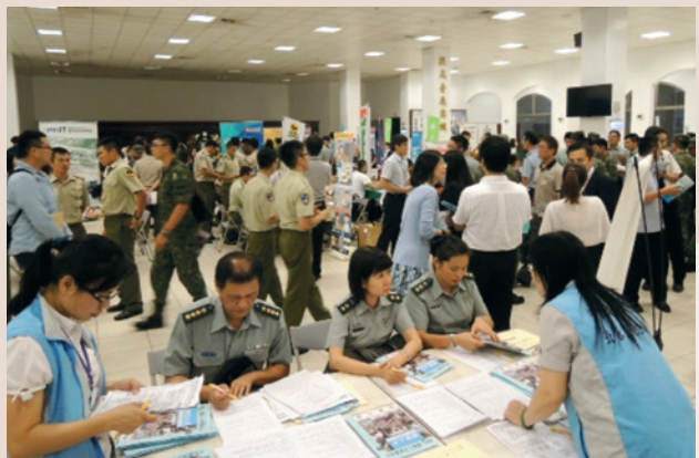
105年度屆退官兵權益說明會暨媒合徵才活動。

為協助屆退官兵，做好職涯規劃與退後輔導，本處結合新北市、宜蘭、基隆等榮服處、國防部後備指揮部、陸軍後勤指揮部、輔導會桃園職訓中心等單位，定期辦理「國軍屆退官兵權益說明會暨現場徵才活動」，期使屆退官兵能充分