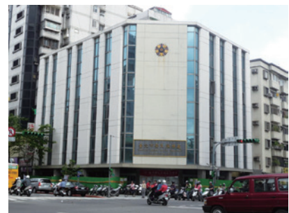
民國94年臺北榮民服務處外牆整建後全貌 (94.12)。