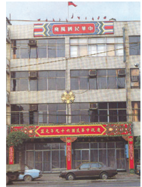
民國64年~74年位於南京東路榮民服務處的全貌 (69.6)。

85年12月組織修訂後，按臺北市12個行政區劃分責任區，執行榮民(眷)就學、就業、就養、就醫及服務照顧等工作，並辦理單身亡故榮民治喪善後作業及遺產管理人業務。102年11月1日組織改造，原「行政院國軍退除役官兵輔導委員會臺北市榮民服務處」，更改名銜為「國軍退除役官兵輔導委員會臺北市榮民服務處」。