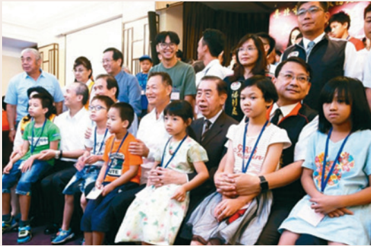
106年8月29日舉辦106年度「大手拉小手·讓愛延續」相見歡活動。

企業的支持與捐助，積極邀請中華民國軍人之友社、財團法人聯合報慈善基金會等捐助單位，於106年8月29日舉辦106年度「大手拉小手·讓愛延續」相見歡活動。