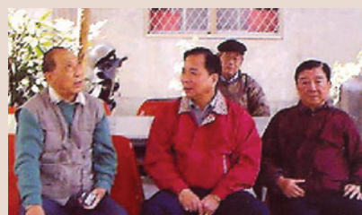
柯處長（中）親近榮民、照顧榮民、瞭解榮民（94.1）。

柯處長服務本處3年，重點工作在「建立制度」暨「革新風氣」績效卓著，員工團結一致，都能體恤榮民（眷），並願為服務照顧而繼續努力。