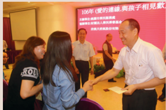
孩子親送感恩謝卡。