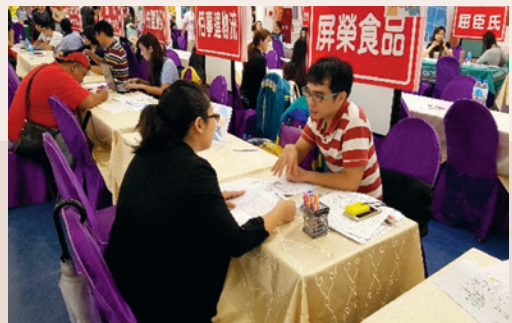
現場就業媒合活動(106.06)。