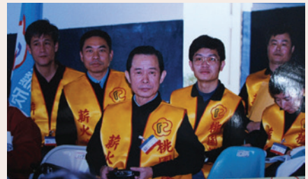
許員（前中）與榮欣幹部合影（87.10）。

許員喜好運動，軍校學生時代即為體操隊員，能於榮服處服務的原因即是鍾愛榮服處寬敞場地與良好的運動設施。平日上班之暇均以打羽毛球、打乒乓球作運動。94年7月1日退休後，恢復支領軍方上校退休俸，生活悠閒無慮，夫婦鶼鶼情深，並常於國內、外旅遊。許員更經常偕同志同道合之好友，打羽毛球消遣，對服務處服務工作仍甚關心，遇有榮民（眷）問題，均能向單位首長或業管同仁反映，繼續扮演服務處與榮民間的溝通橋樑，表現良好。