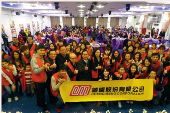
采盟免稅商店辦理單身榮民歲末暖冬圍爐活動(106.01)。

年節氣氛，由采盟愛心志工及榮服處榮欣志工，一起陪伴現場168名獨居長輩們，提前圍爐過新年。