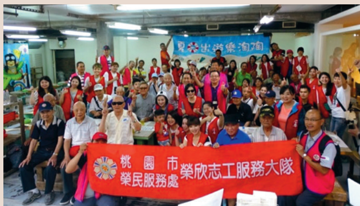
參與人員於陶藝教室大合照。