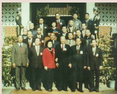
前排右3邊主任於慈湖留影（71.10）。

民國11年生，浙江諸暨縣人，28年抗戰軍興，投筆從戎，就讀軍校受教，為中央軍校16期畢業，歷經抗日與戡亂戰爭，歷任海軍陸戰隊學校總教官、海軍總部作戰署副署長、國防部政三處（監察）處長（62年晉升陸戰隊少將），及陸戰隊師長、校長。69年6月少將軍階轉任本會臺南縣聯絡中心主任、70年8月調桃園縣榮民聯絡中心主任。73轉任新竹就業講習所所長、76年公務員退休，奉命籌設「欣雲石油氣公司」，以迄80年5月正式退休離職。