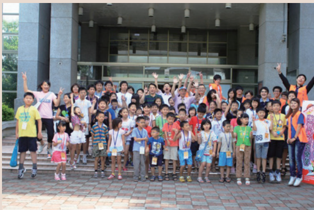
舉辦育樂營培養兒童認識航空科技。

100年8月13日邀請就讀國中小學之榮民遺孤及清寒子女60餘人，於服務處與「欣桃天然氣股份有限公司」及「開南大學」共同主辦「榮欣學童航空魔法育樂營」活動，培養兒童認識航空科技及健康喜樂的學習。