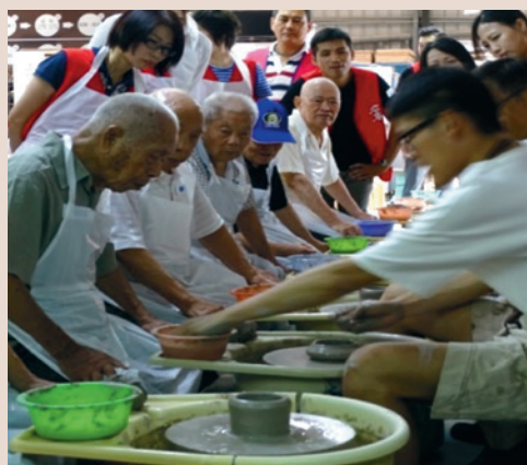
榮民伯伯學習手拉坯(106.7)。

手工陶作在經過施釉、窯燒後，屬於伯伯們獨一無二的陶瓷作品也亮麗地送到他們手中，看見伯伯們所展露歡樂的笑靨，相信在他們心中也留下難以忘懷的獨特回憶。