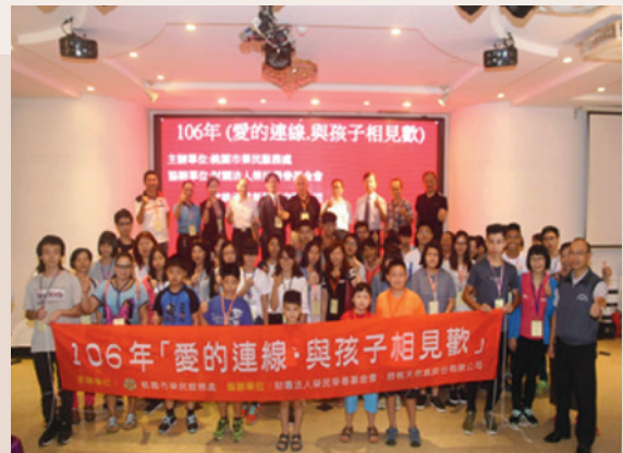
認養人與孩子的相見歡合影。

本次相見歡活動以『愛的連線·闖關玩遊戲』為主題，藉由趣味保齡球、打憤怒鳥機、套圈圈及捏塑DIY等小遊