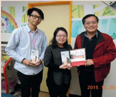
拜訪八德區家服中心與幹部合影（右1）（104.12）。

民國45年生，福建金門人，財經學院67年班財經系畢業。89年軍職外調輔導會，歷任輔導會科長、專門委員、副處長、榮家副主任，104年9月16日奉調桃園榮民服務處處長，106年1月16日調任高雄榮譽國民之家擔任家主任。