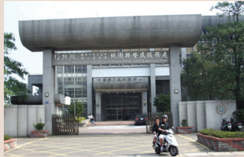
榮服處地處市區，交通便利，建築宏偉，空間寬敞為榮民洽公休閒最佳場所（86.10）。

本處成立於民國51年7月1日，是為「桃園縣聯絡中心」，主任由會屬「漁殖管理處」處長兼任，並合署辦公，負責對轄區內領一次退伍金榮民之照顧。54年擴編，主任改為專任，65年遷離漁管處至桃園市中山路361號租屋辦公，70年於桃園市長沙街22號興建辦公廳舍以擴大服務。76年奉令易名為「桃園縣榮民服務處」。85年起，再依輔導會政策，除榮家就養的榮民以外，轄管區域內榮民與榮譽的服務照顧工作。