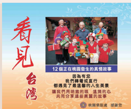
「看見臺灣－12個正在桃園發生的真情故事」桌曆與微電影（102.12）。

會。而臺灣最美的是人，本項桌曆與微電影製作，就是希望藉由一些發生在週邊真實的感人故事，讓大家看見希望，找回工作的價值，重返應有的榮耀。