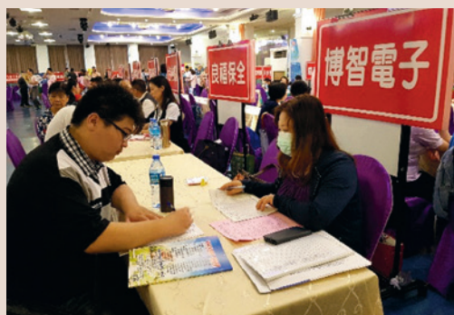
現場就業媒合活動(106.06)。

本次徵才活動含科技業、傳產業及服務業等多元化行業職缺，當天除邀請勞動部勞動力發展署桃竹苗分署、國軍人才招募中心及創業榮譽指導員協會等單位共同參與，以提供求職民眾與求才廠商全方位