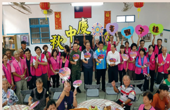
與會者中秋活動大合照。