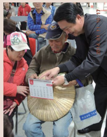
董處長於榮民代表座談會中，將桌曆致贈故事主角（103.1）。

榮民是榮譽國民的簡稱，是對出生入死、保國衛民軍人們的無限尊崇。近來「看見臺灣」記錄片讓所有國人看見了臺灣的脆弱，也看見機