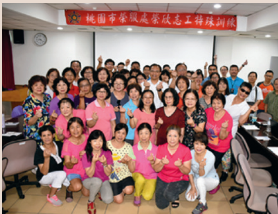
本處志工特殊訓練開訓。

為精進志工專業職能，優化服務照顧品質與效能，本處近年積極辦理「榮欣志工特殊訓練」，除邀請服務多年的資深志工、新進志工參與外，社區服務組長及職員也主動參訓。