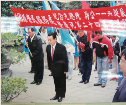
盧處長率幹部代表至慈湖 (91.10)。

民國34年生，臺灣省嘉義縣人。83年政戰上校軍職外調輔導會，歷任嘉義、臺南縣榮服處總幹事、副處長、南投縣榮服處處長，91年7月調任桃園縣榮服處處長職，迄93年7月奉令改任屏東榮譽國民之家主任。南投縣、桃園縣榮服處處長，屏東榮家主任及臺南榮家主任。