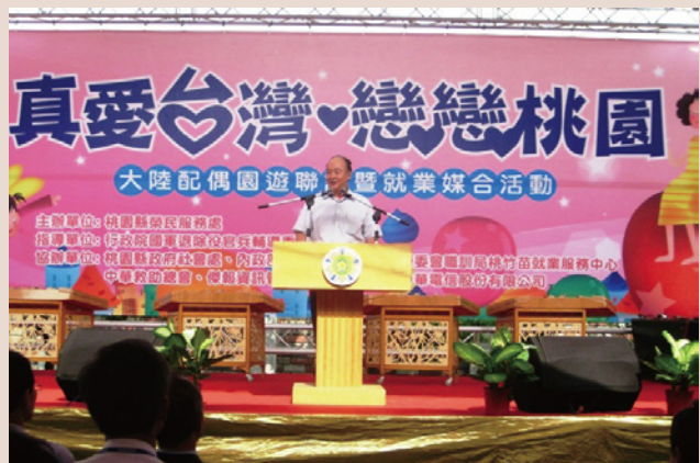
大陸配偶園遊會暨就業媒合活動。