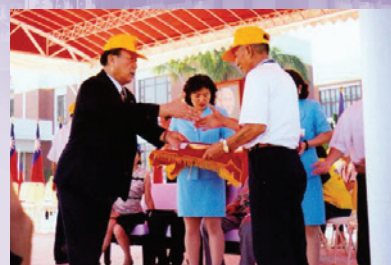
宋處長（左）於榮民節表揚模範榮民（87.10）。

宋處長就任新職後，即訂定培養團隊精神等多項工作重點，作為努力方向，並與全體員工共勉，積極為榮民袍澤爭取權益與應有尊榮。任職期間，以工作紀律提升員工同仁良好績效，以熱誠服務凝聚榮民（眷）向心，87年因辦理互助組長新春聯誼獲服務機構評比為優等單位，88年1月宋處長榮調岡山榮家主任並於90年退休。