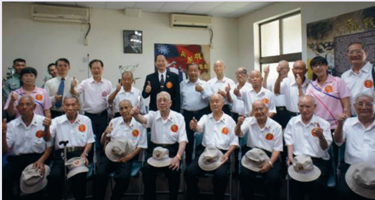
陳處長陪同董主任委員向抗戰榮民致敬。

抗日戰爭是中華民國建國歷史上，最重要的戰役，在當年蔣委員長的領導下，全國軍民團結一心，經過八年艱辛卓絕的浴血奮戰始獲勝利，不僅奠立了中華民國邁向民主安康的里程碑，終結異國侵略，同時更光復長達50年殖民統治的臺灣，衷心感謝當年百萬榮民前輩，用鮮血所換取的勝利，讓臺灣