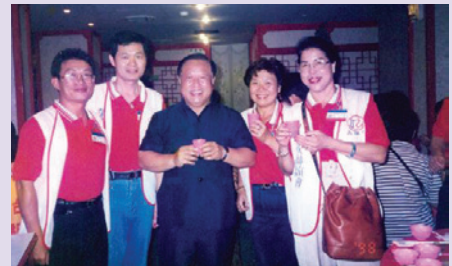
張處長（中）與志工合影（85.6）。

84年6月為因應本會調整政策：「外住就養榮民原由榮家負責，調整改由各榮服處服務照顧。」精心規劃將全市11個行政區依本市榮民分布狀況，劃分為7個責任區、29個服務區，並編成1096個生活互助小組，以運用綿密之體系及榮欣志工人力，迎接新的任務與挑戰，其才幹與績效普獲肯定。86年7月外調本會魚殖管理處處長，任內躬親督導產銷，開拓周邊產業，全面提升業務績效，惟以推行民營化政策之故，復於單位裁撤後，調任花蓮自費安養中心主任，迄94年退休。