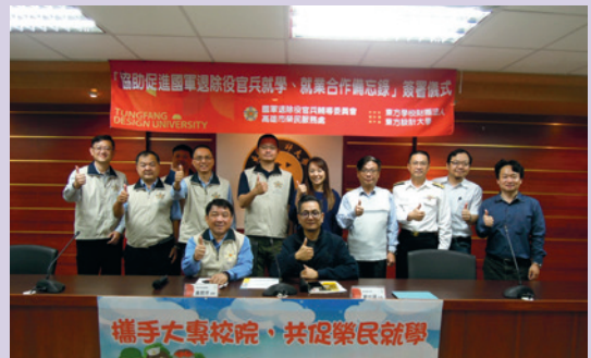
黃處長拜會東方設計大學簽署合作備忘錄。

本處與國內唯一主攻設計專業的東方設計大學簽署「協助促進國軍退除官兵就學、就業合作備忘錄」，雙方共同推動產學（訓）合作計畫，提供多元就學管道及專業訓練資源，冀以協助退除役官兵順利求學、進修，開創職場新出路。