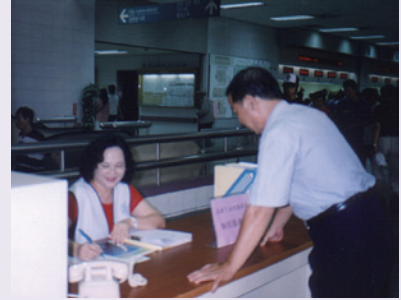
駐榮總服務台接待榮民，受理就醫相關問題（93.6）。

復於94年7月獲軍方支持，配合在左營國軍醫院設置服務台。經累計年度派出輪值服務員工、志工逾600餘人次，服務接待含榮民（眷）及一般民眾合計22,380人次，對象涵蓋南部各縣市，成效顯著，普獲榮民（眷）正面肯定及認同，除現場說明給予解決外，餘均取回本處交承辦人員簽處，並將辦理結果回覆當事人。