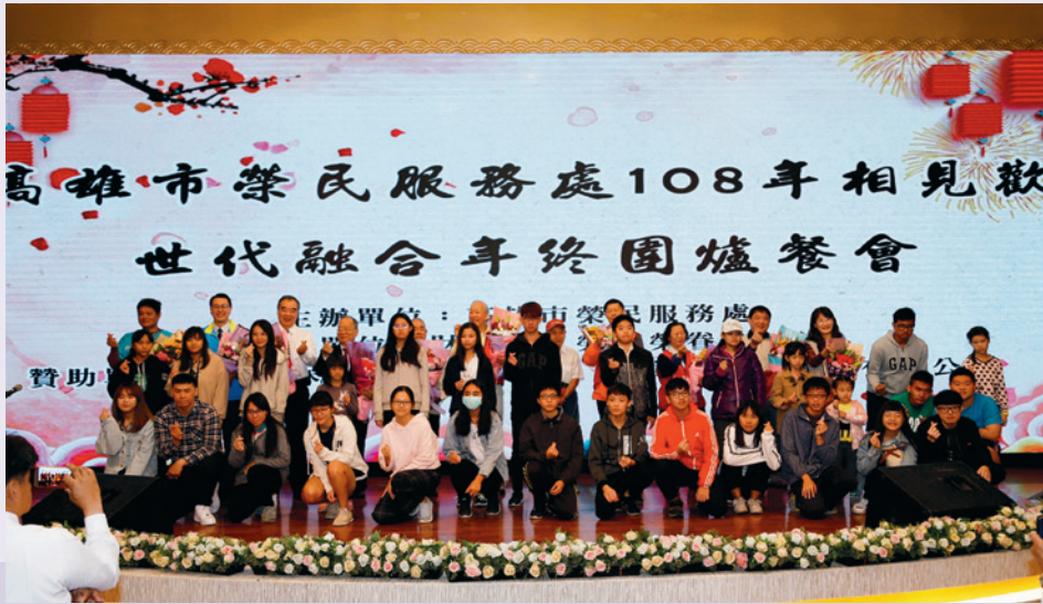
社會各界善心人士共襄盛舉大合照。