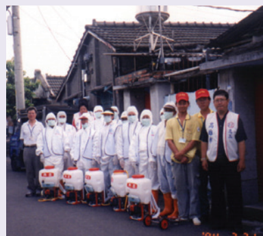
眷村全面防疫消毒—抗SARS總動員（92.5）。

93年4月24日SARS防疫狀況提升為A級，SARS防疫機制再度啟動，本處再度編組，服務人員進駐小港機場，針對入境榮民協助執行健康管理、安置、隔離等檢疫防疫工作，直至疫情獲得全面控制。