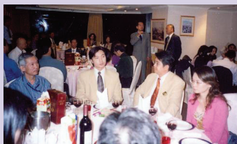
楠梓加工區陳副處長出席就業餐敘，代表貴賓致詞（95.9）。

95年度「榮民生涯輔導與就業媒合活動實施計畫」報准增開具競爭力之教育班次，將有限人力經費作充分發揮。由於地方政府、工商團體之配合，整體就業輔導績效均能勉力達成，以94年度為例，完訓榮民（眷）635位，推介榮民（眷）就業415位，達成率為102%，超越會訂目標，經評比就業總成績居22個服務機構之首。