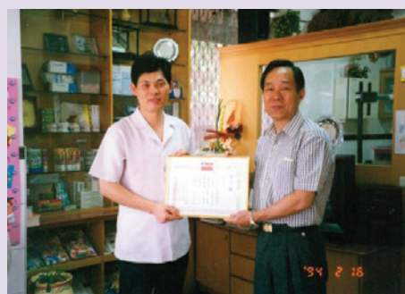
高處長（右）頒狀感謝支援義診醫師（94.2）。

高處長學養豐富、經歷完整、任事負責，不論服務軍旅或調任本會職務，均因績效卓著，深得各級長官肯定及部屬之愛戴。任職期間，積極改善硬體設施，營造良好之工作環境，並嚴格要求依法行政，尤以單身亡故榮民善後事宜必一絲不苟，89年1月1起建立檔案管理，落實文卷歸檔，勤訪基層足跡遍及高市每個角落，充分瞭解榮民（眷）之需求，及時協助解決，深獲榮民（眷）之讚揚。92年12月2日榮調楠梓榮民自費安養中心主任，94年即通過ISO服務品質驗證，領導與才能展現無遺。