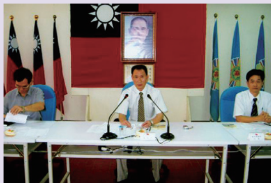
張處長指導舉辦榮民分區座談會（95.8）。

因應世界經濟景氣衰退，處長更致力於榮民（眷）就業媒合與各類型職業訓練班隊之開辦，服務期間推介就業人數1,631人次，間接照顧各個家庭，更辦理43個職訓班隊，完訓1,390人次，其中786人取得職業證照，成效卓著。