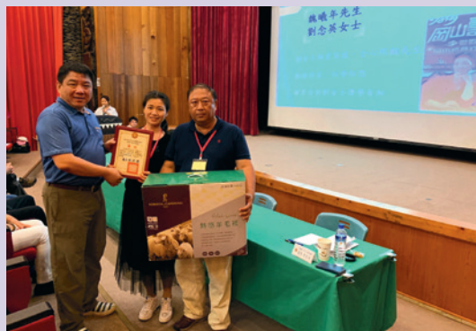
黃處長致贈每對夫妻精美禮品，劃下完美的句點。

為協助榮民新住民配偶適應臺灣生活，建立族群融合社會，特於風光明媚的屏東原住民文化園區辦理「108年新住民生活適應輔導及幸福家庭表揚」活