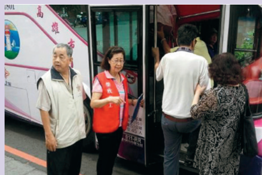
榮欣志工隨車陪同榮民眷搭乘就診專車。

為強化服務偏鄉年長榮眷，租賃「榮民就診專車」，提供每週三趟次，從高雄岡山發車經橋頭，往返高雄榮民總醫院，提供便捷就醫服務，安排榮欣志工隨車服務陪伴看診，並講解車輛安全逃生設備及功能，使就診榮民能安心搭乘，方便就診，106年計服務3100人次。