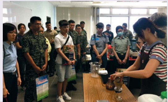
職訓班隊參訪一輕食餐飲班。

辦理108年第2季屆退官兵權益說明會（高雄場次），特別安排於高雄市政府勞工局訓練就業中心舉辦，安排屆退官兵分組參觀汽修、水電、電機、烘焙、輕食、小吃、美容及美髮等8個職訓班隊，透過現場講師深入淺出、生動活潑的解說，讓屆退官兵瞭解職訓班隊學習實況，為職場轉銜提供最佳準備。