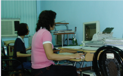
文書室執行檔案回溯及公文電傳作業(91.3)。

輔導會對落腳高雄市榮民（眷）之服務照顧需求極為關切。早在民國47年9月24日即成立「高雄地區輔導組」，當時業務由「楠梓榮民醫院」兼辦，辦公處所則先後設置於楠梓榮民醫院、鼓山三路108之34號、河北二路154號、鼓山一路139號、七賢一路17號、十全一路367號等處址。