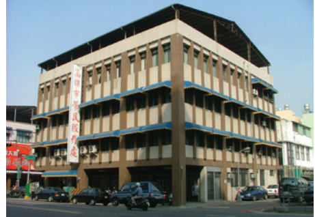
高雄市榮民服務處辦公大樓自強二路門面（94.11）。

整併後榮民服處將建構具有「高效能、負責任、應變力」新服務團隊，提供榮民（眷）優質且兼具方便性、時效性、地域性之服務照顧，彰顯永續服務照顧之功能。