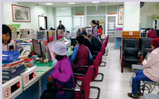
榮民眷臨櫃申辦俸金。

為因應107元月份起，退除役官兵俸金改為按月發放，先期運用本處官網、臉書、LINE@群組及新聞稿等方式，廣為宣導將帳戶改為直撥入帳，俾達提領存款便利性，另於每月初配合臨櫃發放人潮，同時開設3個收件櫃檯，辦理發放作業，並請榮欣志工協助引導，以簡易便民申辦流程，提升發放效率與服務效能。