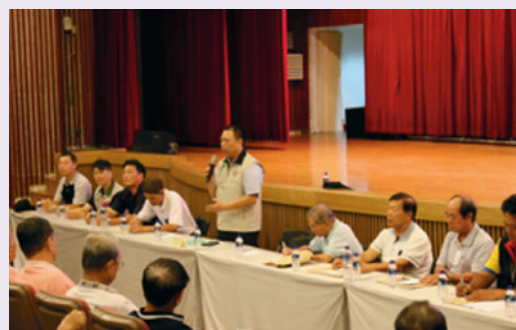
史處長主持退伍軍人社團聯繫座談會。

為強化本處與退伍軍人社團情感交流，並提高退除役官兵再就業率，同時聽取退榮民心聲，察納雅言，每年辦理服務網座談會，另舉辦退伍軍人社團及榮民代表組織聯繫座談，結合就業專題講座，凝聚退除役官兵向心。