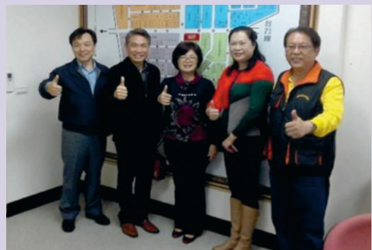
王處長拜會經濟部高雄大發工業中心。

為鼓勵廠商多加進用榮民（眷）、二類退除役官兵，專程造訪經濟部工業局高雄市大發工業區服務中心，宣導有關第二類退除役官兵之就業補助權益與服務項目，並瞭解工業區內610家廠商的產業人力需求，以規劃連結合作方案，提升退除役官兵轉介就業成效，並參與「高雄市大發工業區廠商協進會會員大會」活動，向100餘家廠商簡報說明，介紹退除役官兵特質與轉業需求，強調僱用退除役官兵的優勢，說明運用職業訓練及學用合一計畫，廠商可節省培訓人力成本補充人力缺口，達到互利互惠，並每月規劃辦理至少一場次「單一廠商現場徵才暨職涯發展說明會」活動，並提供場地，由人力需求廠商現場說明職